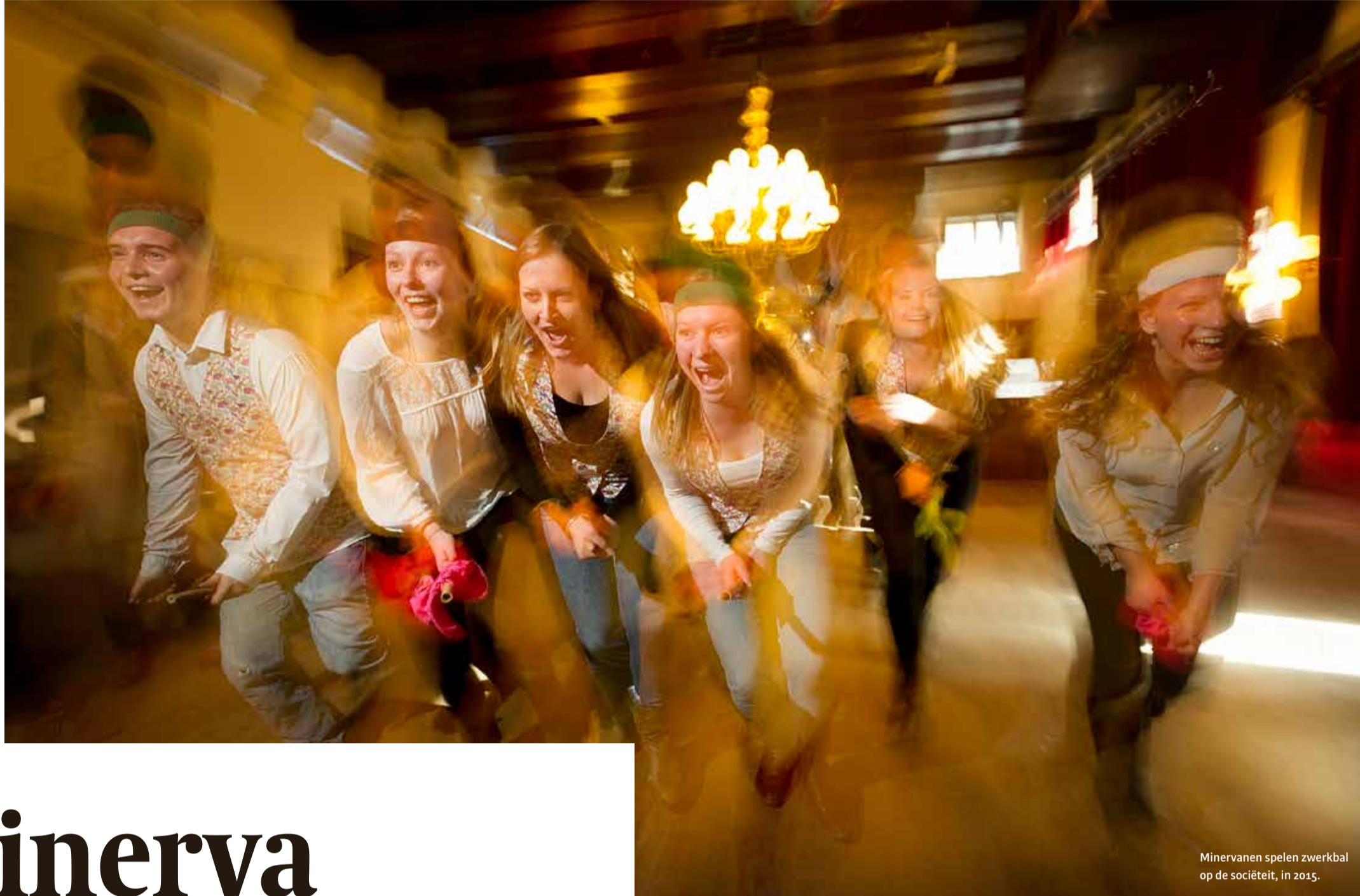
Minervanen spelen zwerfbal op de sociëteit, in 2015.