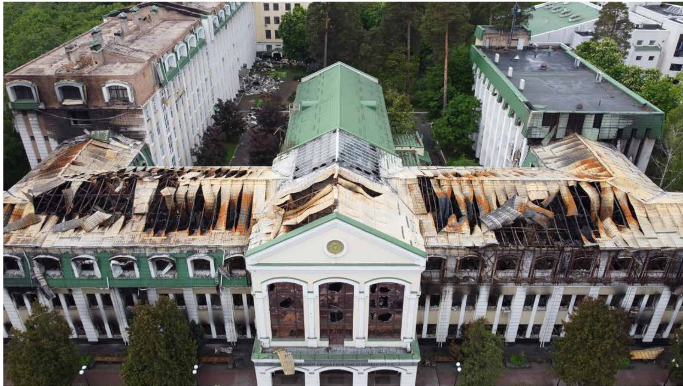
Vervroeste universiteit in Irpin, een voorstad van Kyiv.