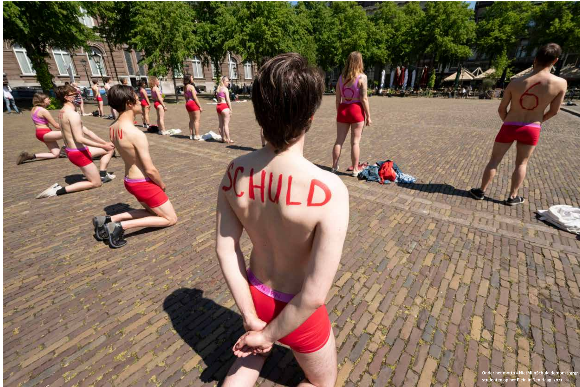
Onder het motto #NietMijnSchuld demonstrieren studenten op het Plein in Den Haag, 2021

Er bestaat verwarring over de rente op studieschuld en hoe zwaar die lening meetelt bij het afsluiten van een hypotheek. Hoe zit het nu precies?