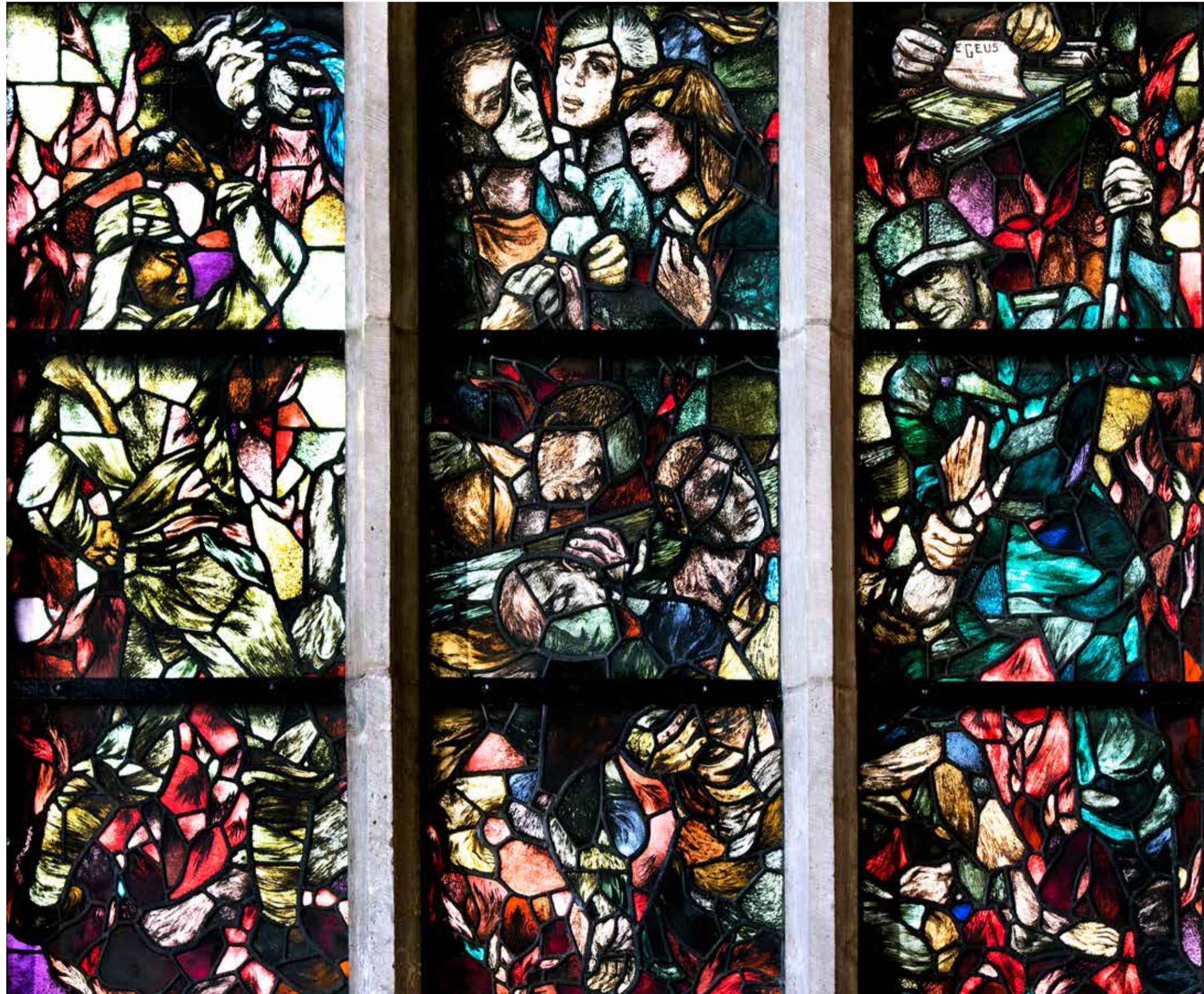
De gedenkramen in het Academiegebouw die de Tweede Wereldoorlog symboliseren