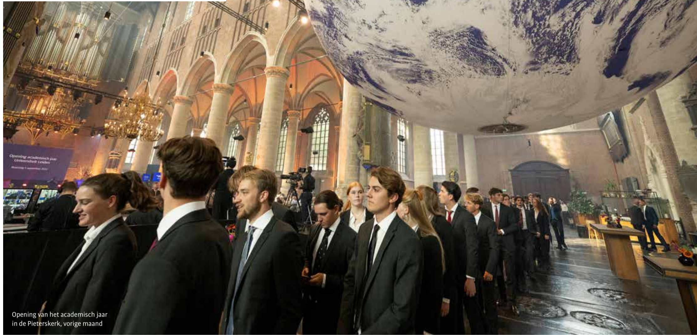
Opening van het academisch jaar in de Pieterskerk, vorige maand

DOOR ANOUSHKA KLOOSTERMAN