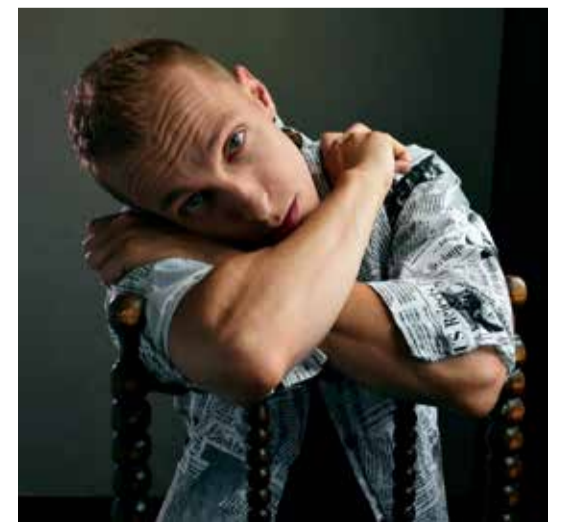
Korean Wave , Museum Volkenkunde. Zaterdag 24 en zondag 25 september, (€15 per dag, €25 voor twee)

Desondanks zou hij het niet anders willen. 'Alle banen in de creatieve sector kosten een hele hoop werk. Ik heb vele uren onbetaald gewerkt en gehobbyd om hier te komen, maar ik ben blij dat het eindelijk gelukt is. Dit is mijn droombaan.'