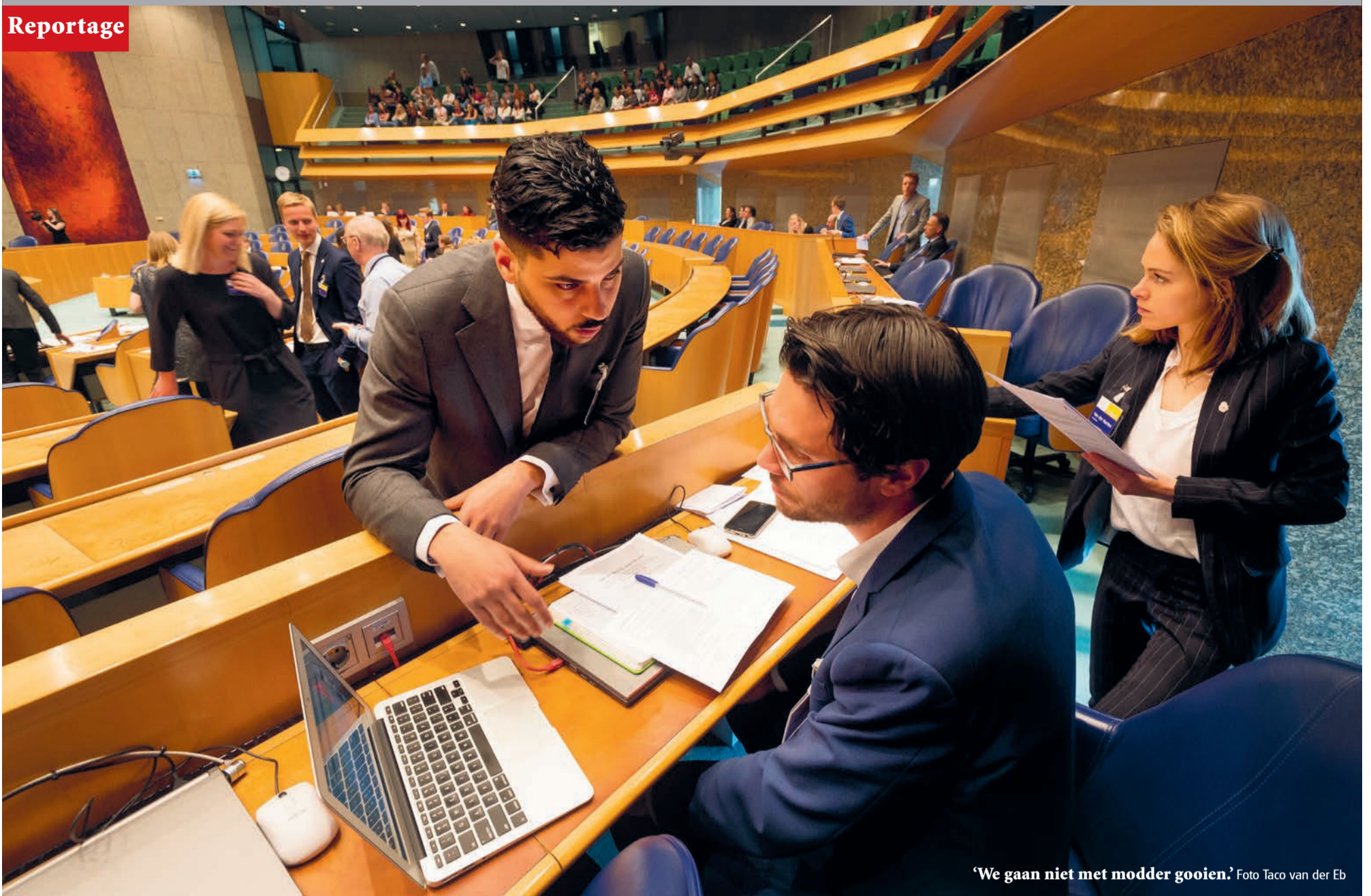
‘We gaan niet met modder gooien.’