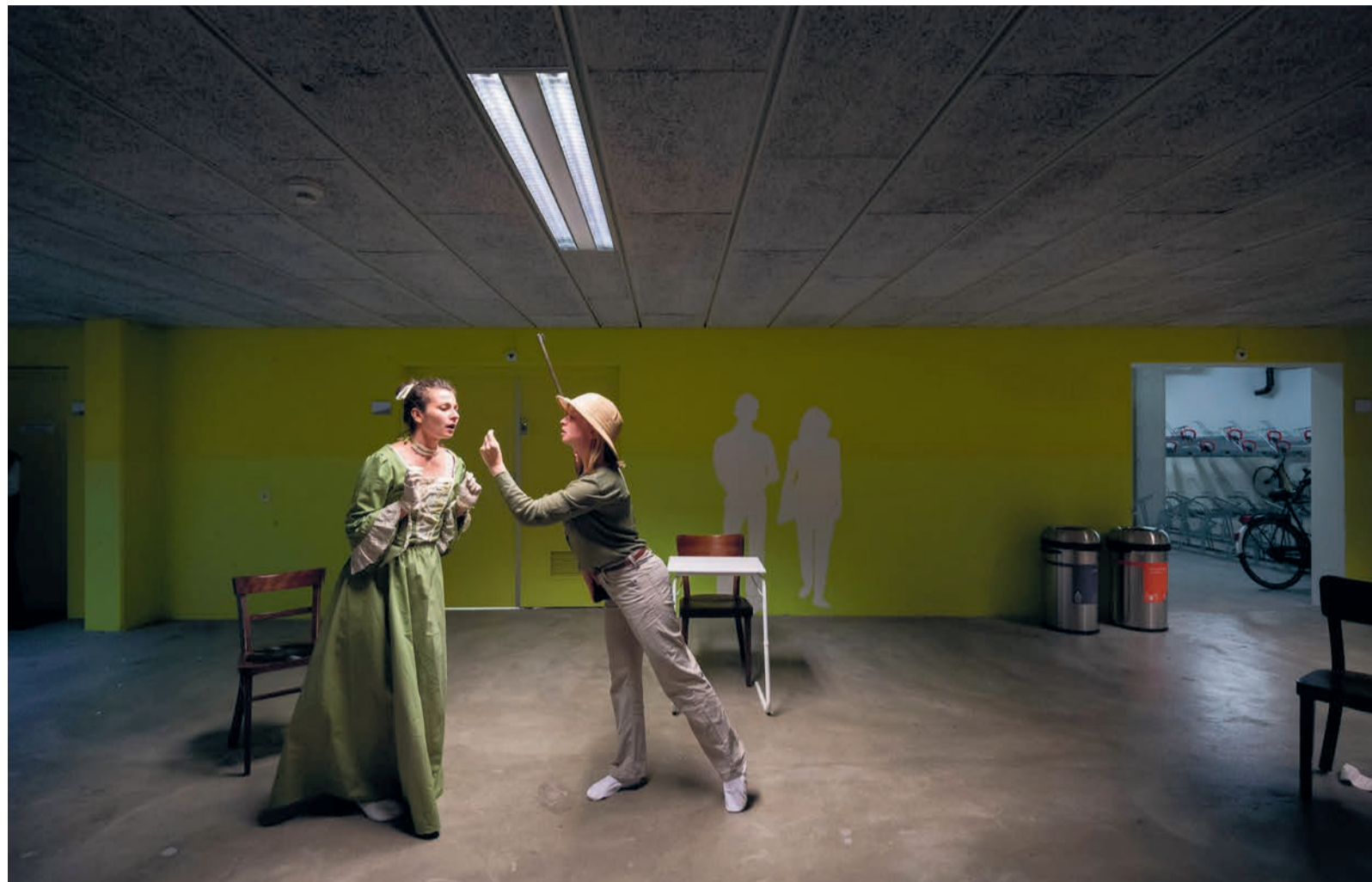
Acteurs van het Leiden English Theatre als Mrs. Mozart en Osa Johnson tijdens de laatste repetitie van Chamber Music .

Tijdens de opwarmoefening op de begane grond, toneel voor Lapin Agile , staan de acteurs in een kring. 'Neo!' roept een acteur. 'Post!' reageert een ander. 'Neo!' volgt een derde. In hoog tempo en in wat een willekeurige volgorde lijkt, kaatsen de woorden heen en weer als een balletje dat wordt overgegooid. Het