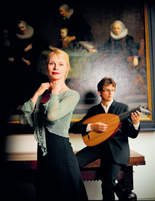
Het Huygens Duo speelt in het Academiegebouw, een 'droomlocatie'.

Leidse hofjesconcerten, 9 en 10 juni, € 17,50 per dag