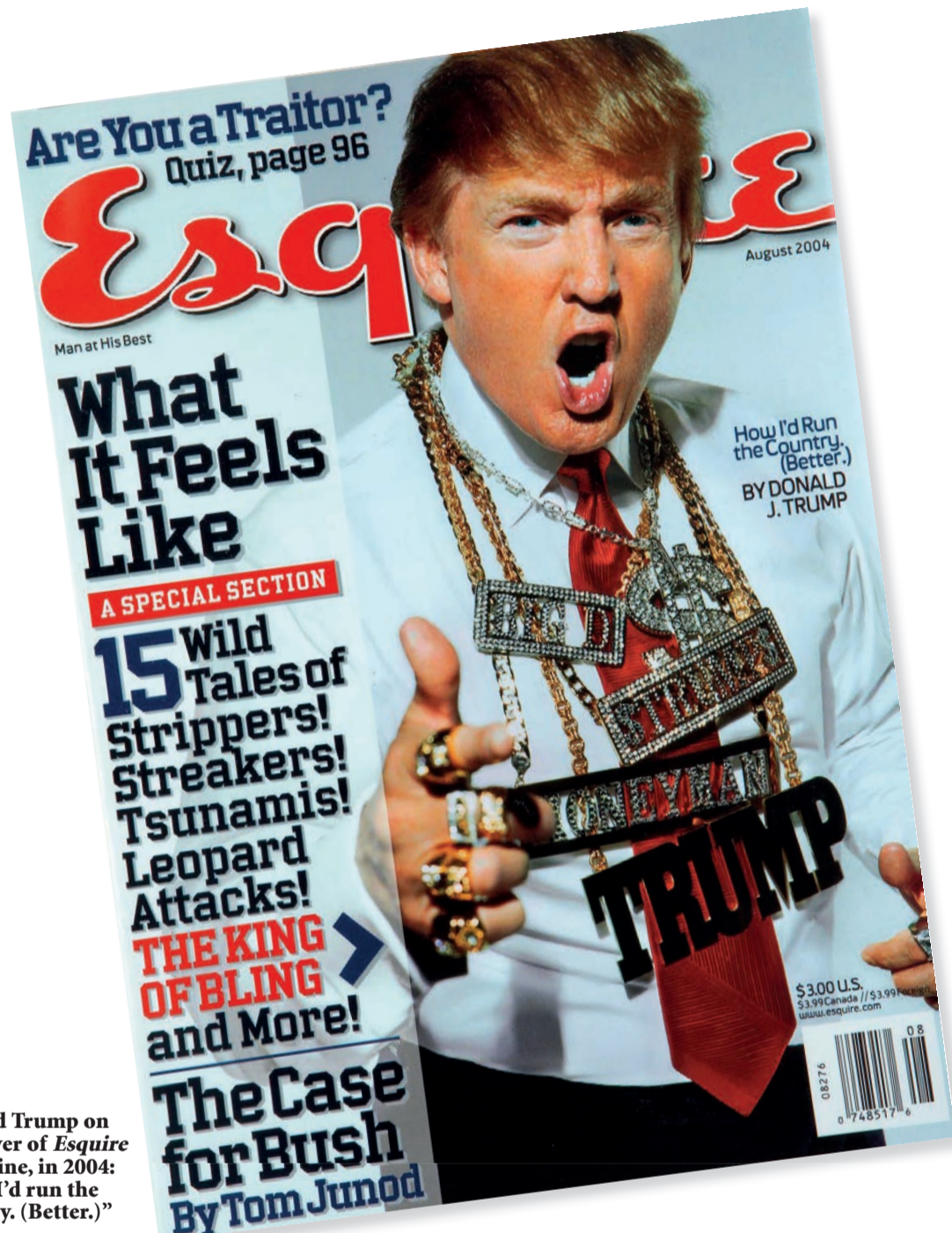
Donald Trump on the cover of Esquire magazine, in 2004: "How I'd run the country. (Better.)"

Stop doom-mongering: the world's not doing too badly