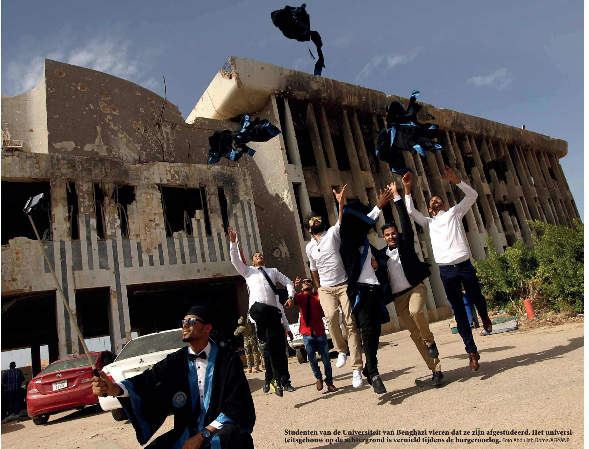
Studenten van de Universiteit van Benghazi vieren dat ze zijn afgestudeerd. Het universiteitsgebouw op de achtergrond is vernield tijdens de burgeroorlog.

Suliman Ibrahim Nienke van Heek, National Identity in Post Gaddafi Libya . Lipsius (zaal 1.48) donderdag 14 februari, 17:15 uur