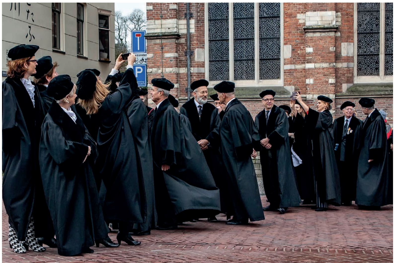
Shinen op 444-selfie Vrijdag vierde de Leidse universiteit haar 444-jarig bestaan. Terwijl het cortège van het Academiegebouw naar de Pieterskerk schuifelde, schoten enkele hoogleraren nog even snel een selfie. Zie pagina 5.

'We zouden een document toegestuurd krijgen waaruit blijkt dat geaardheid nooit mag uitmaken, maar dat krijg ik al twee weken niet. We hopen dat het college op onderzoek uitgaat en er consequenties volgen als blijkt dat er sprake van discriminatie is; mogelijk het inhouden van bestuursbeurzen.'