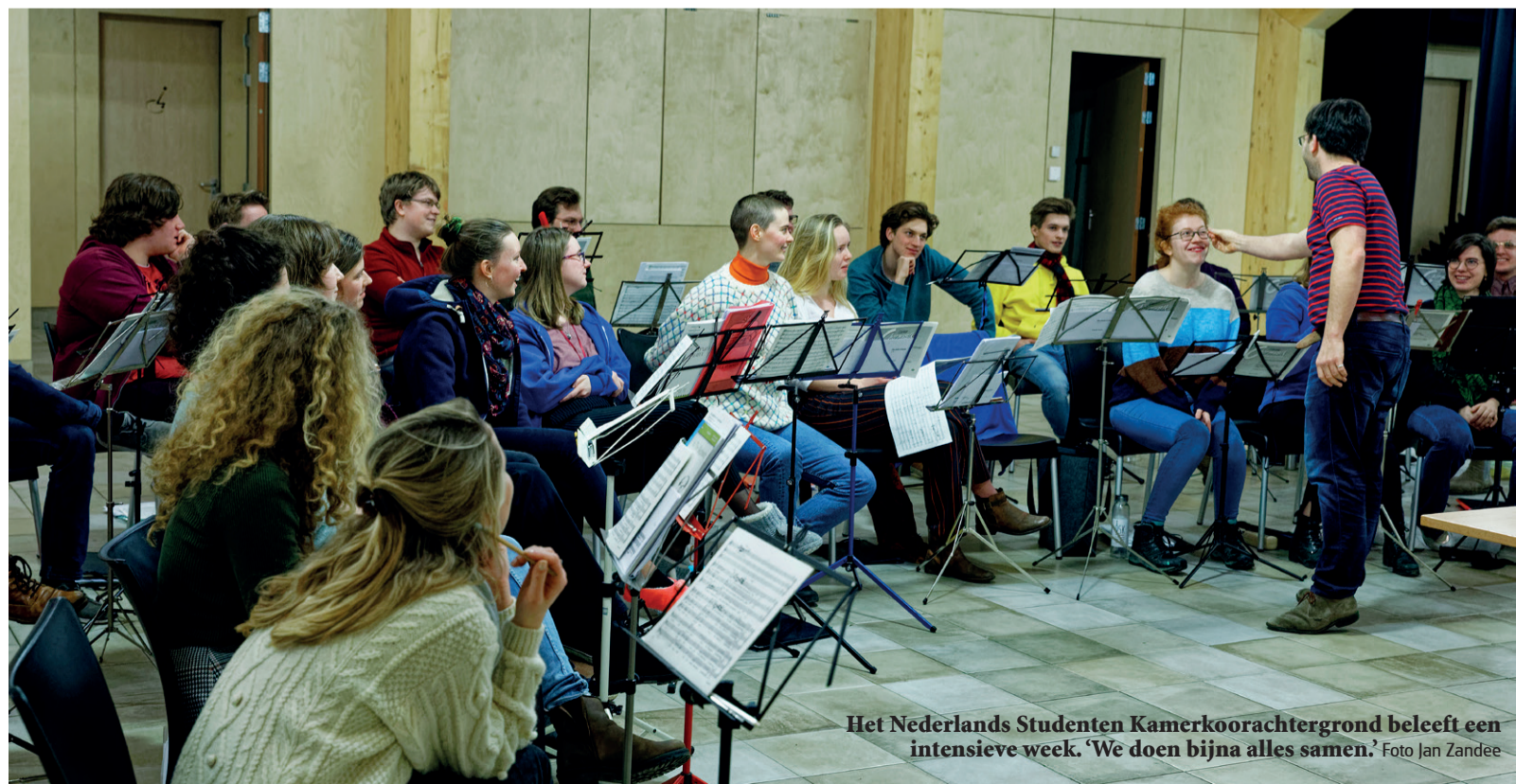
Het Nederlands Studenten Kamerkoorachtergrond beleeft een intensieve week. 'We doen bijna alles samen.'

Zaterdag 16 februari treedt het NSK om 20:15 op in de Hartebrugkerk