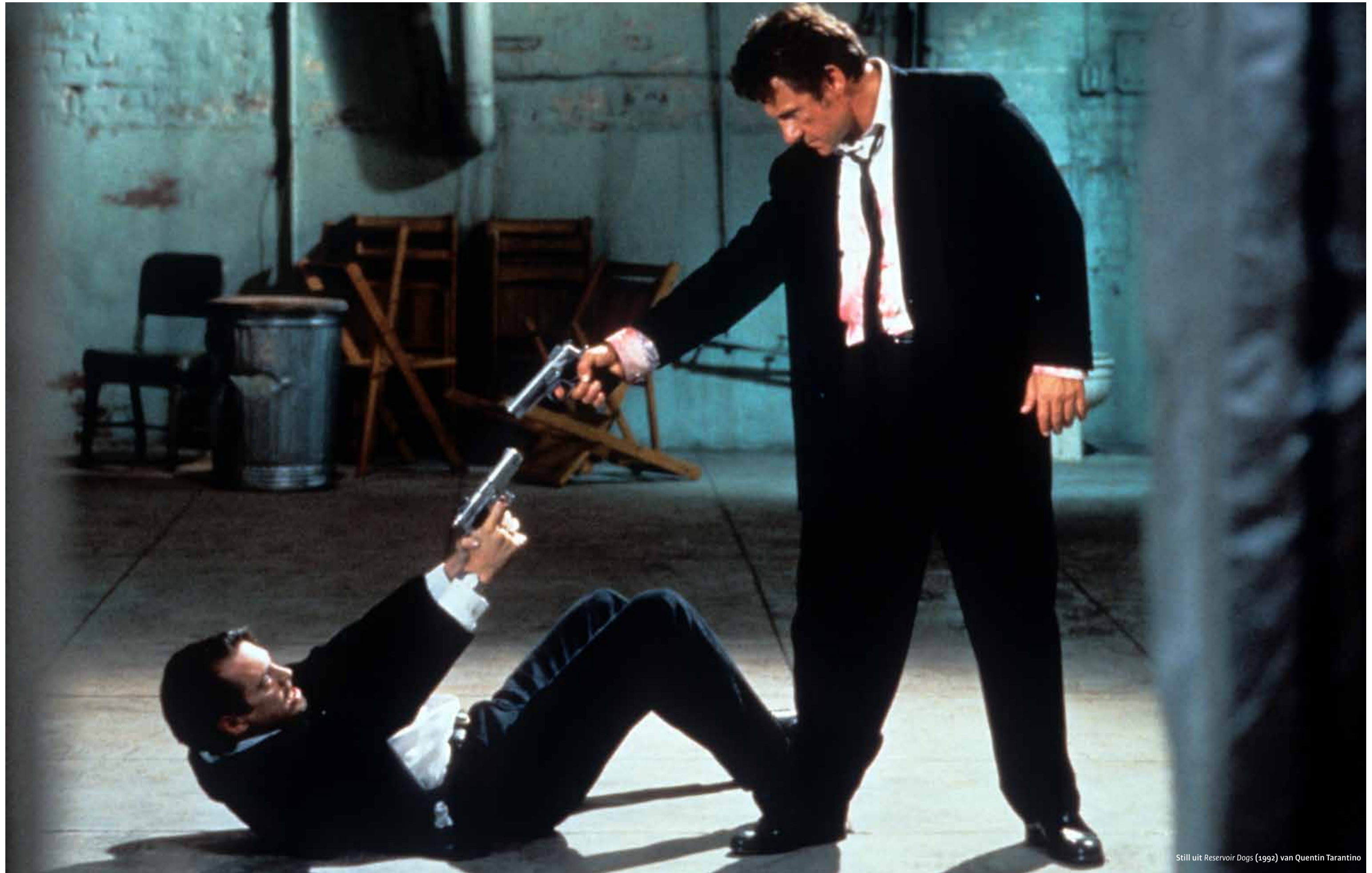
Still uit Reservoir Dogs (1992) van Quentin Tarantino

Kaya ontkent ook dat hij de uitnodiging voor een gesprek met het bestuur heeft afgeslagen. 'De uitnodiging was verzonden tijdens de kerstdagen. Ik ben hier na oud en nieuw op ingegaan met meerdere beschikbaarheden per dag.'