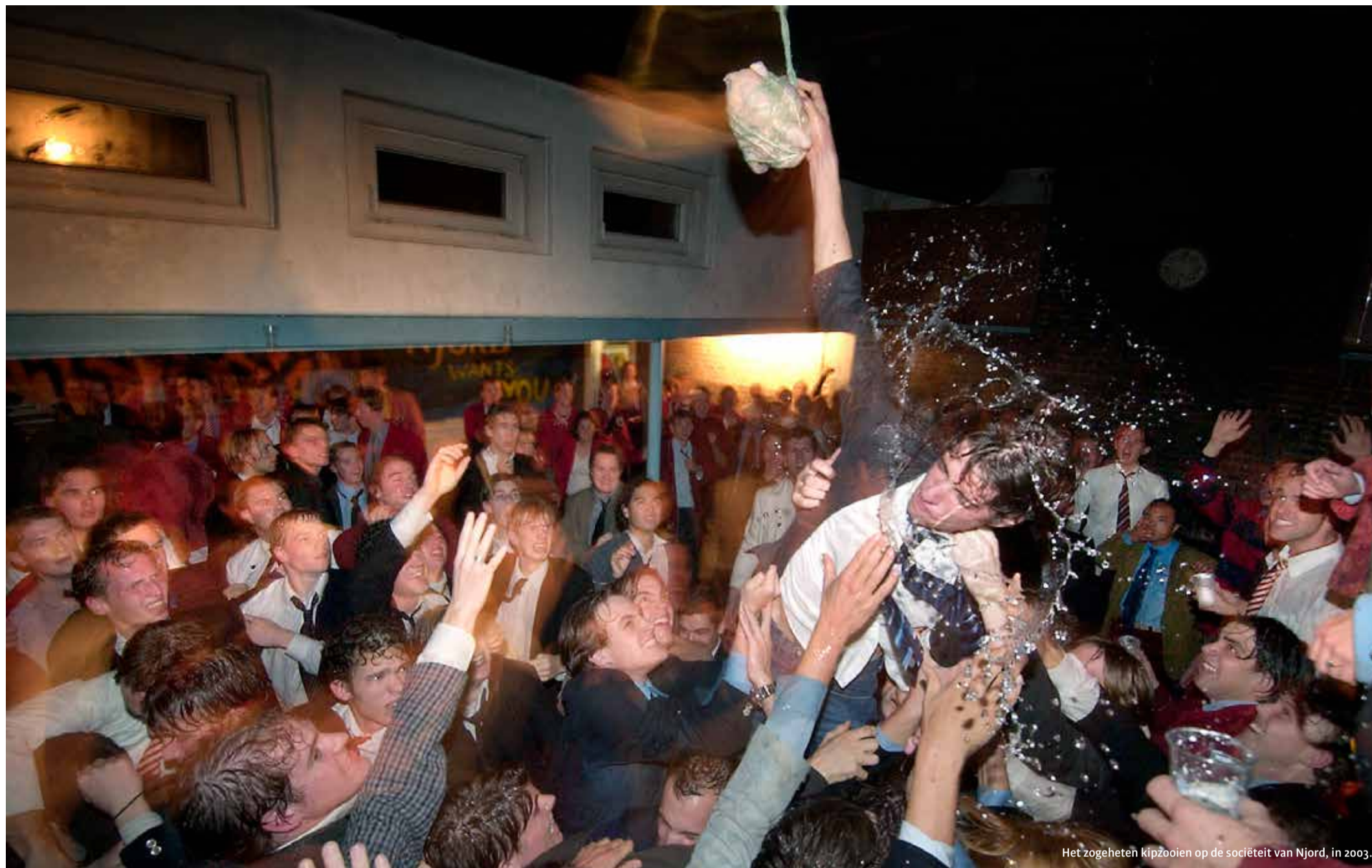
Het zogeheten Kipzooien op de sociëteit van Njord, in 2003.

Hamer werd in 2022 ingesteld als regeringscommissaris seksueel grensoverschrijdend gedrag en seksueel geweld in de nasleep van de #MeToo-beweging en het schandaal bij The Voice of Holland . Afgelopen zomer tekenden Hamer en een aantal studentenorganisaties al een pact om seksueel geweld en grensoverschrijdend gedrag onder studenten tegen te gaan. Aanleiding daarvoor was een incident bij het Amsterdams Studentencorps waar leden van de vereniging vrouwen tijdens een toespraak uitmaakten voor 'sperma-emmers'.