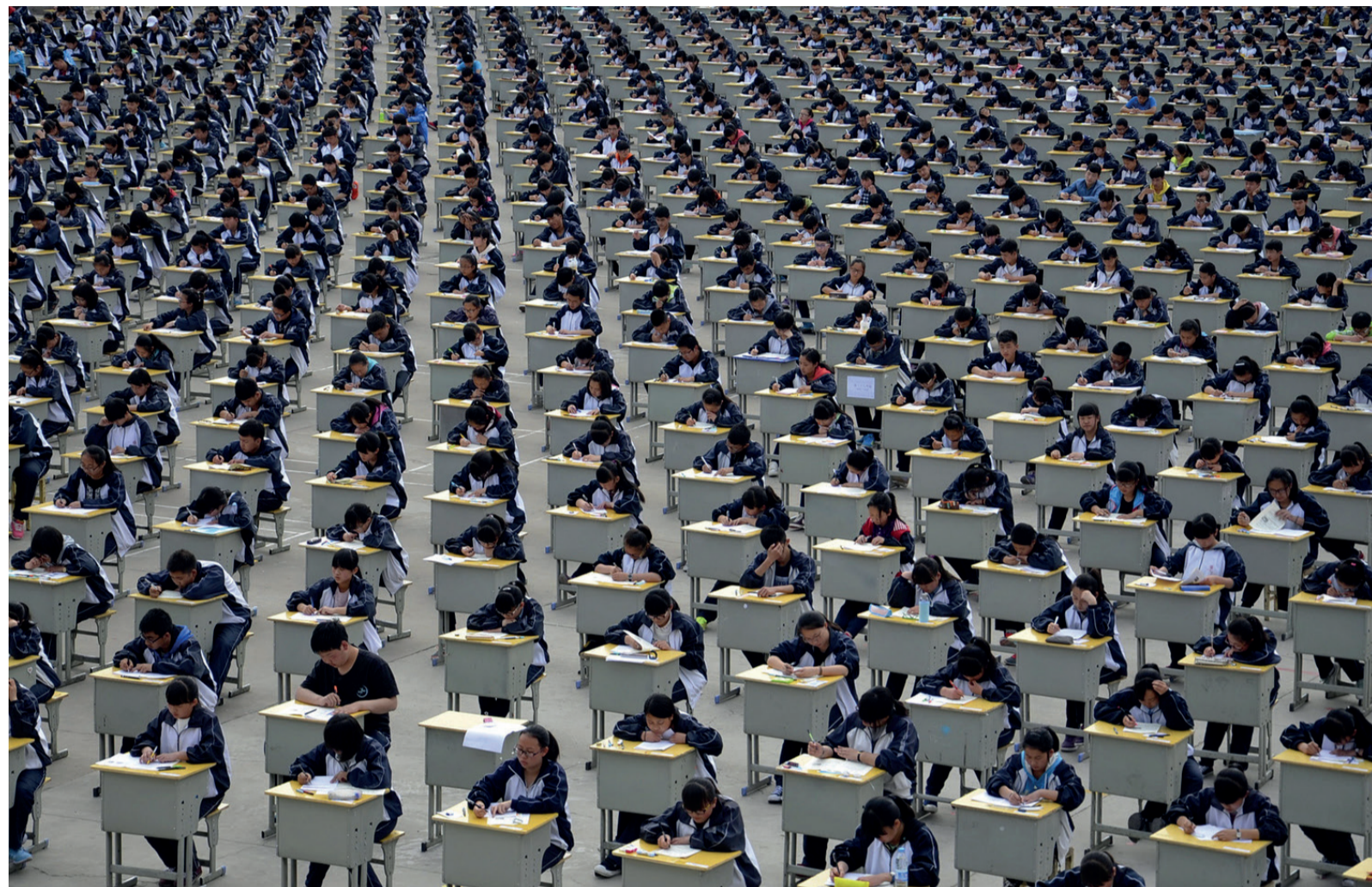
"Chinese universities are not independent. They work for the big man."