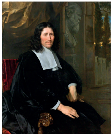
Pieter de la Court in 1667. Schilderij door Abraham van den Tempel.