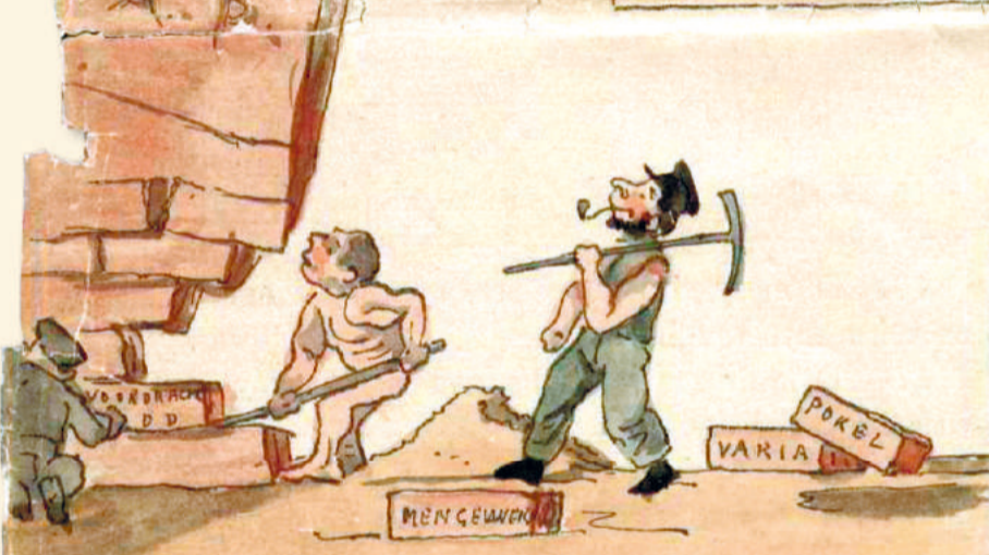
die coninc vindicat

de motto Schrik niet / ik wreed geen quiet Maer dwingh tot goedt Straf is mijn handt Doch lieflijk mijn ge- moedt. P. C. Hoofft.