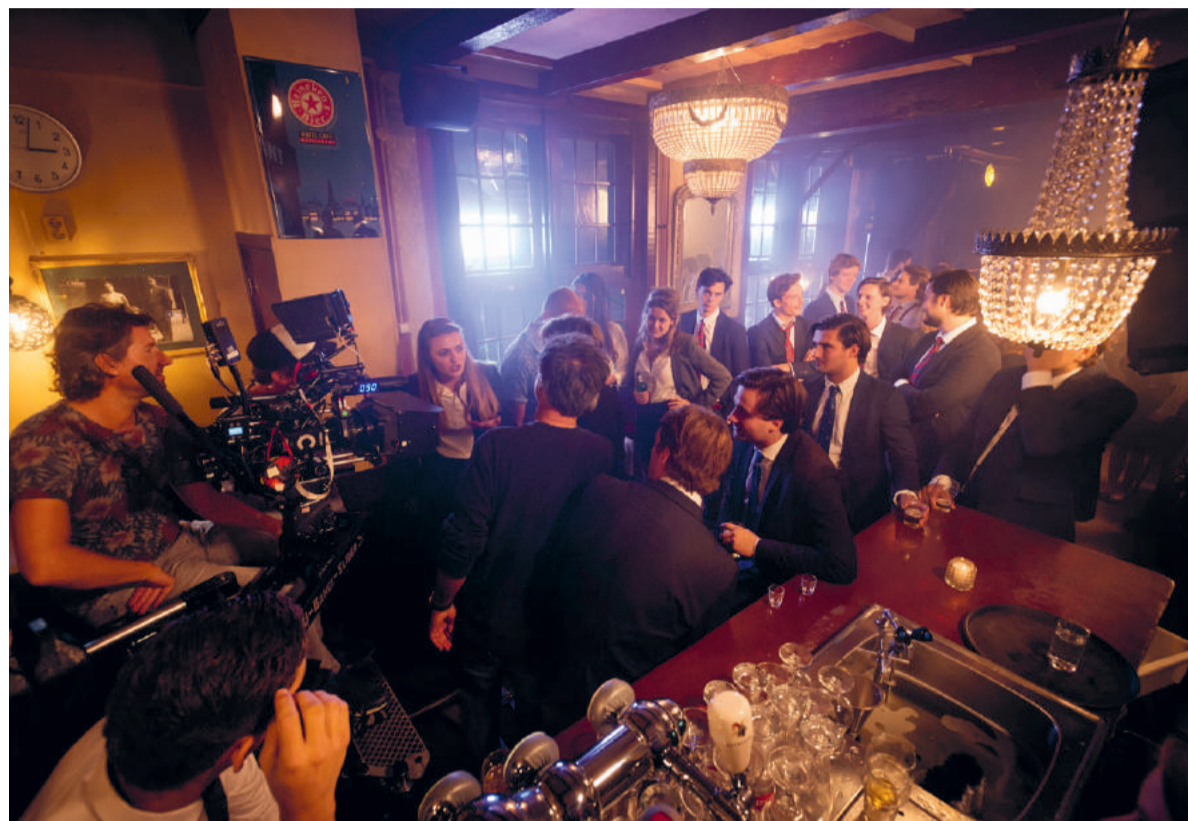
'Als dit het jaar 2000 is, mag er dan ook weer binnen gerookt worden?'

Meer huisgenoten hadden zich opgegeven, maar die waren niet