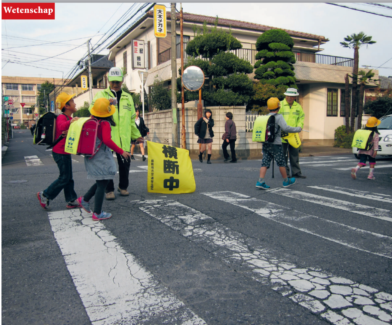
Leden van de 'vrijwillige misdaadpreventie' helpen schoolkinderen om naar school te komen.