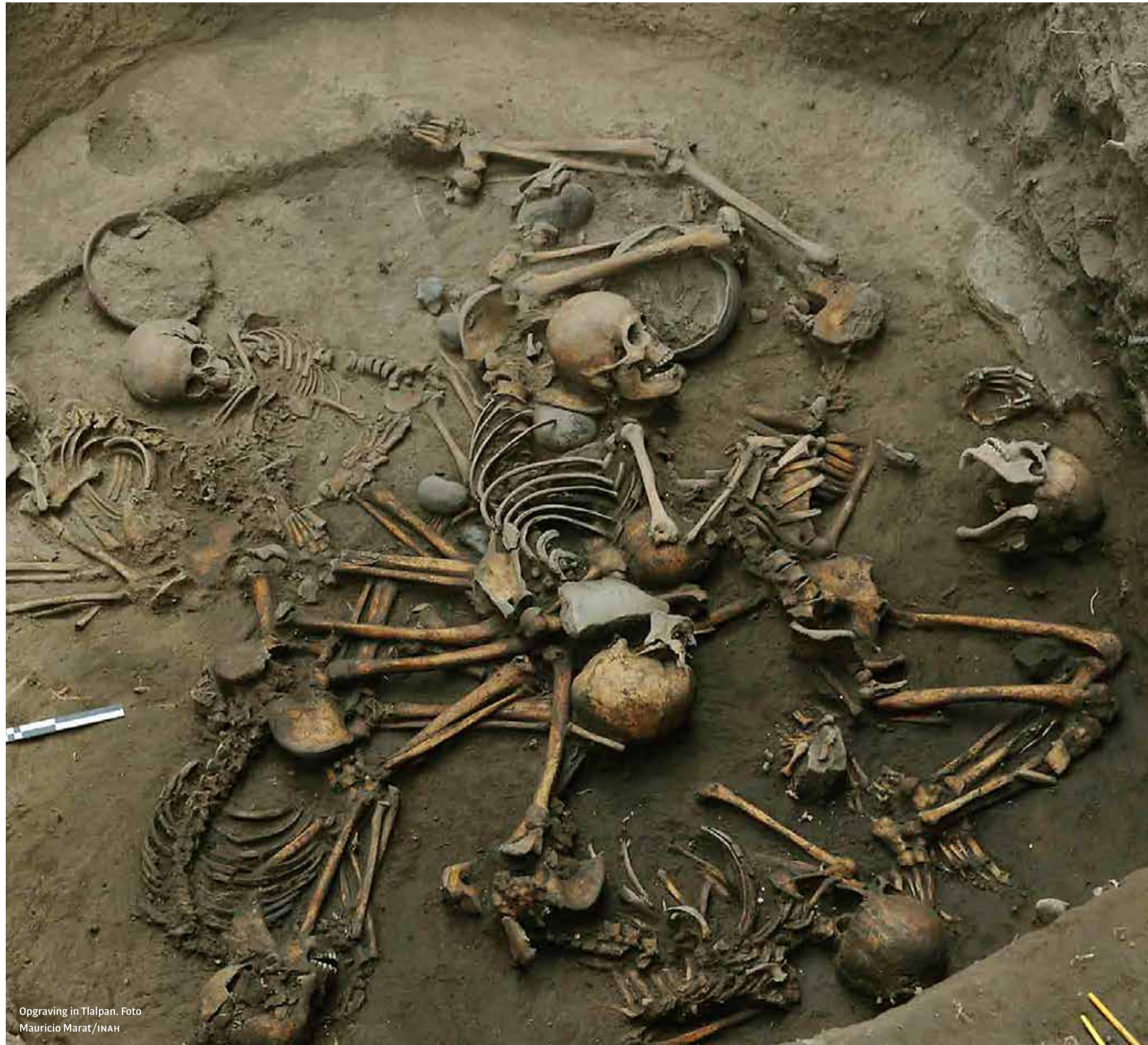
Opraving in Tlalpan.

Ze verzocht de commissie het bezwaar van Hofman en Hoogland ongegrond te verklaren óf niet-ontvankelijk (als de commissie concludeert dat er geen sprake is van misbruik van recht). 'Er kan namelijk ook worden gesteld dat geen openbaarmaking is beoogd en er dus helemaal geen sprake is van een Woo-verzoek.'