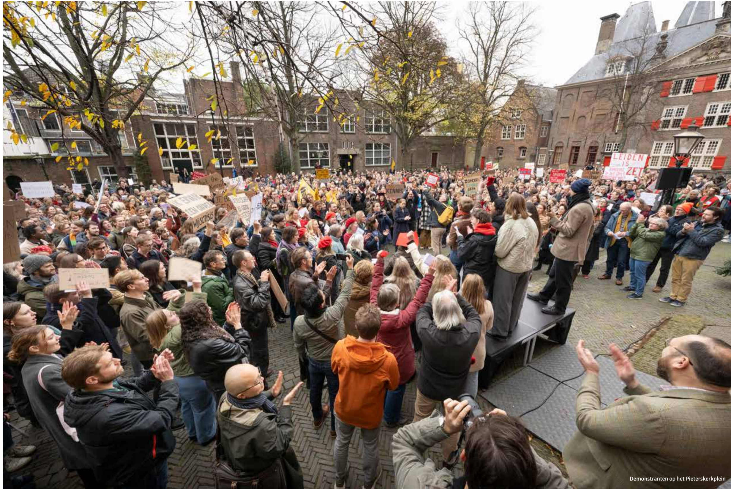
Demonstranten op het Pieterskerkplein

Eerst werd een landelijke protest tegen de onderwijsbezuinigingen afgelast, toen ging het alsnog door. ‘We zijn nu meer verenigd dan ooit.’