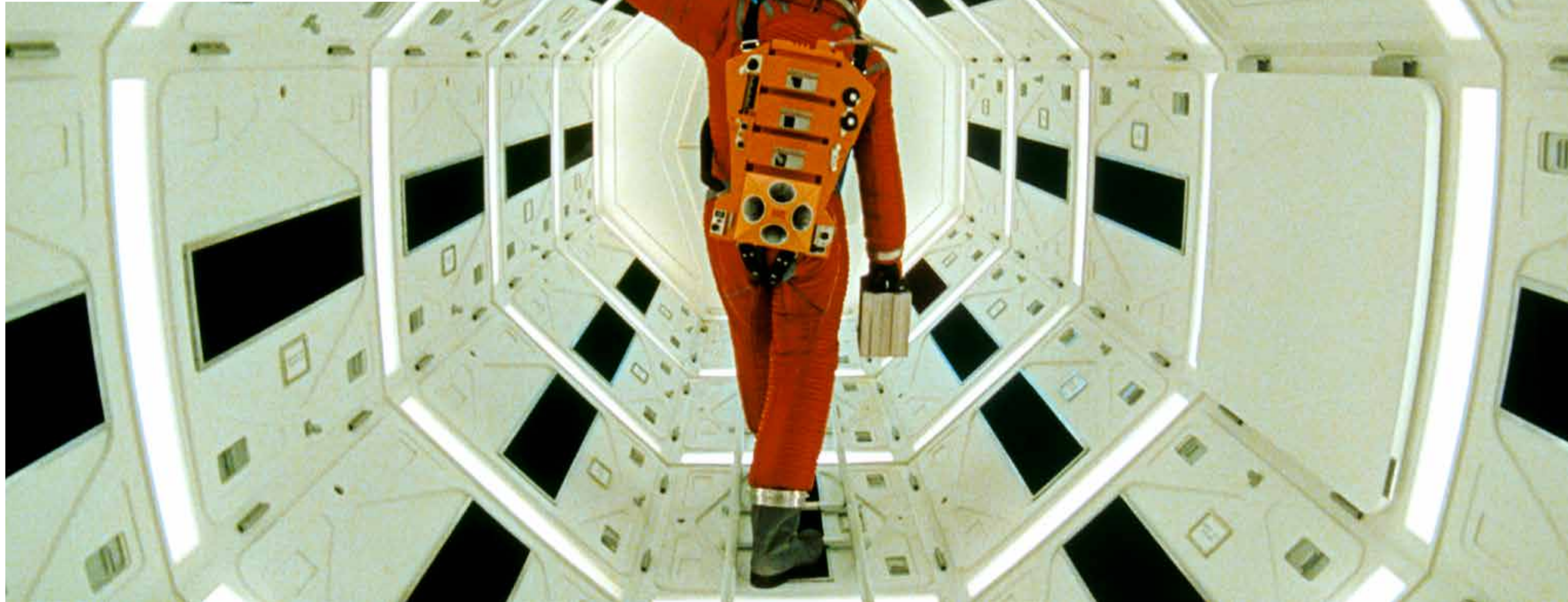
Still uit 2001: A Space Odyssey