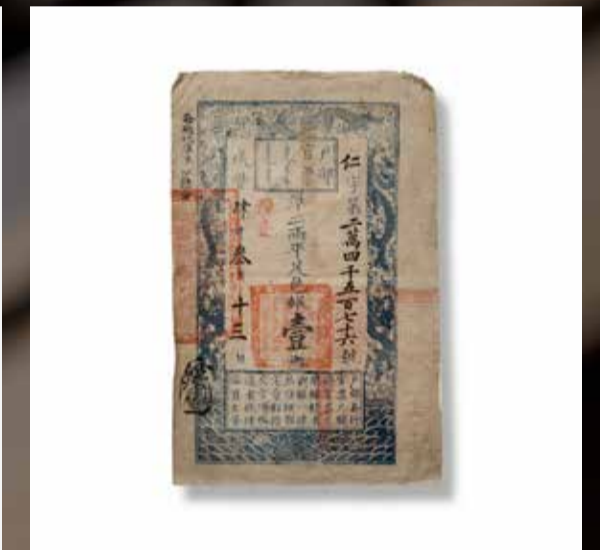
Andersom werkt het ook: dit Chinese bankbiljet laat alle mogelijke manieren zien waarop de overheid valsemunten te slim af wilde zijn, met twee schriften, stempels en handtekeningen. Elk biljet kreeg zelfs een handgezette penseelstreep van een ambtenaar.