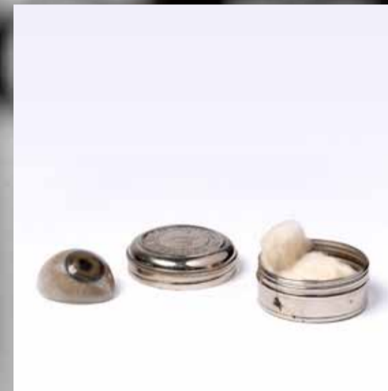
Een glazen kunst oog, gemaakt door de Firma Müller in Wiesbaden, de oudste kunstogenmaker ter wereld. Zij maken sinds 1860 oogprotheses.