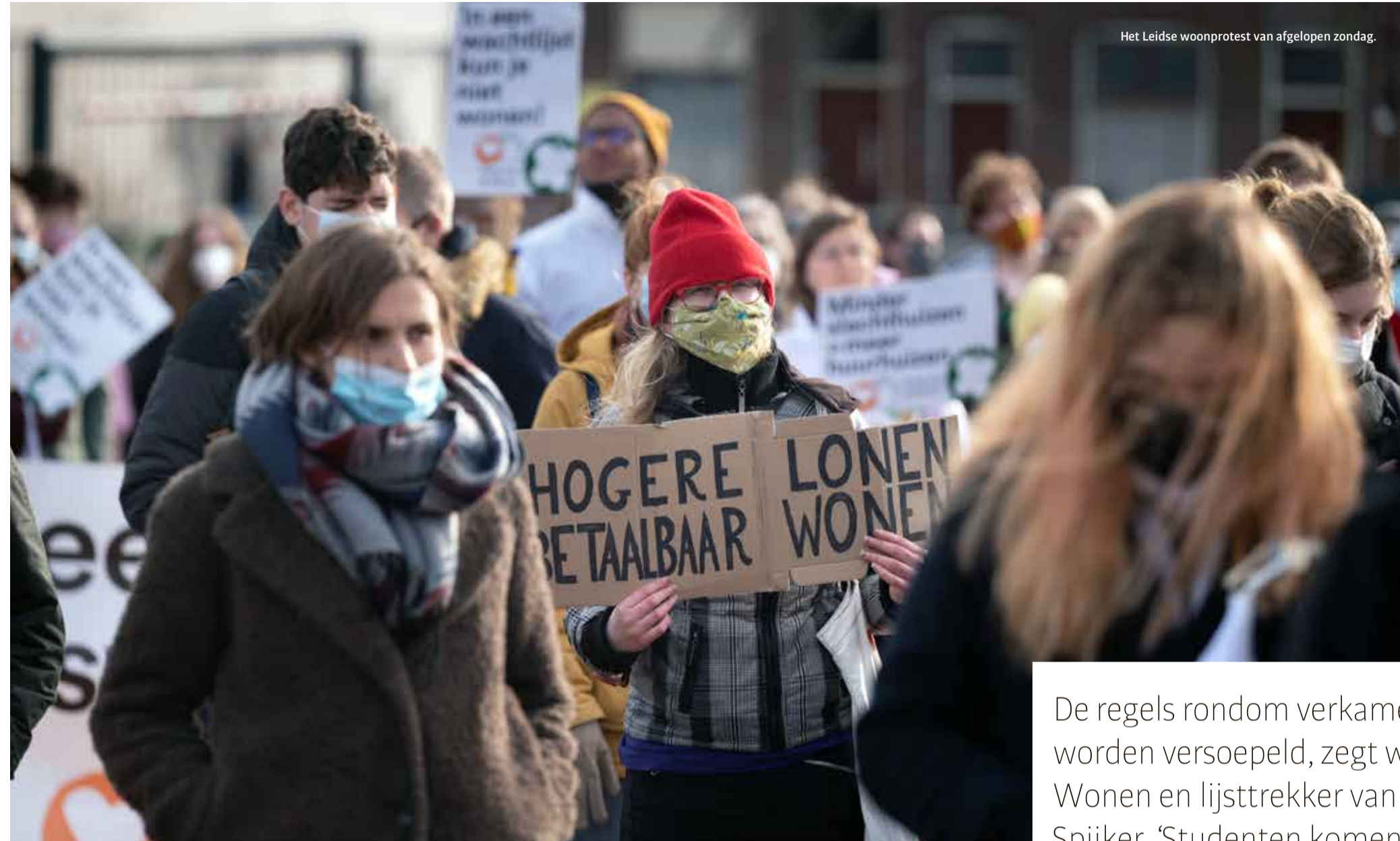
Het Leidse woonprotest van afgelopen zondag.