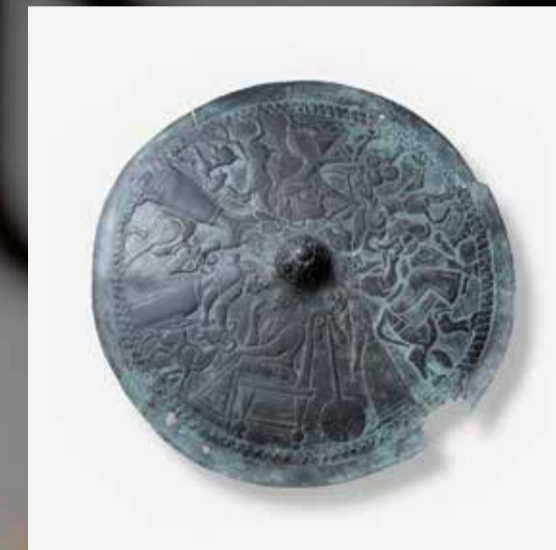
Sinds de aankoop van dit Loeristaanse sierschild in 1943 waren er twijfels over de echtheid. Er staan rare dingen op: een vreemdvormige bijl, linkshandige mannen en bezadelde stieren. De roest nam de twijfel weg. Het schild blijkt echt.