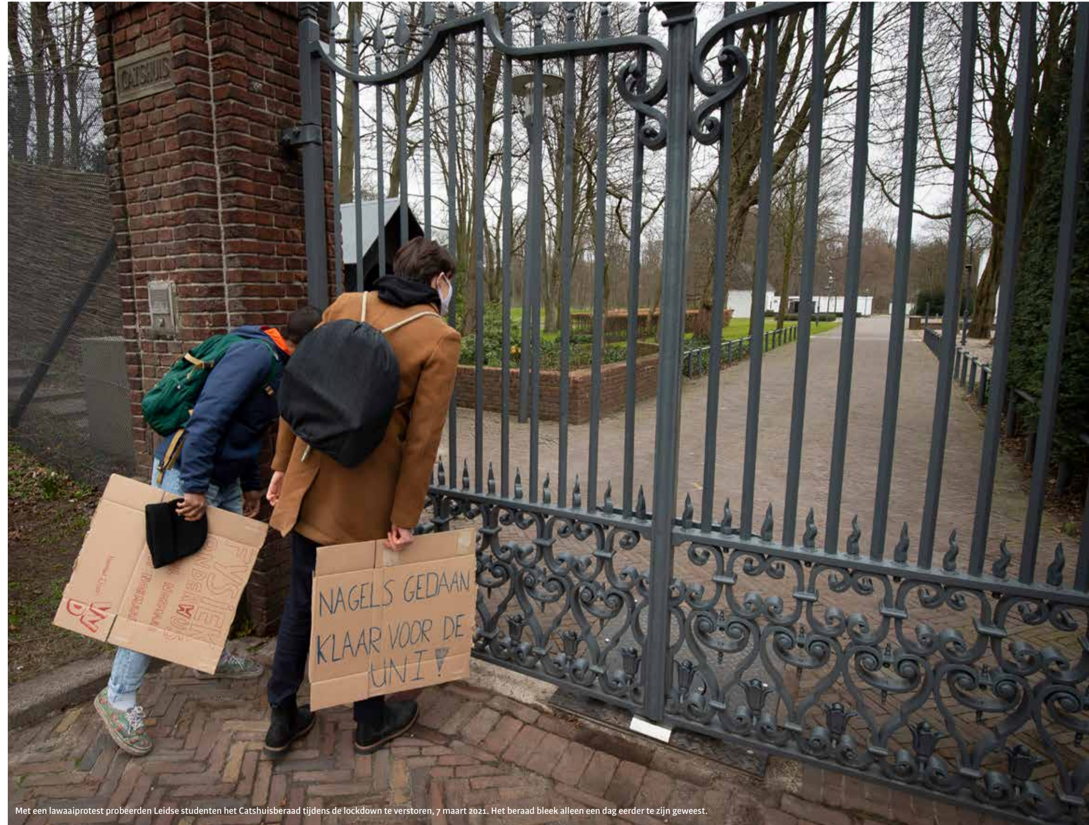
Met een lawaaioprotest probeerden Leidse studenten het Catshuisberaad tijdens de lockdown te verstoren, 7 maart 2021. Het beraad bleek alleen een dag eerder te zijn geweest.