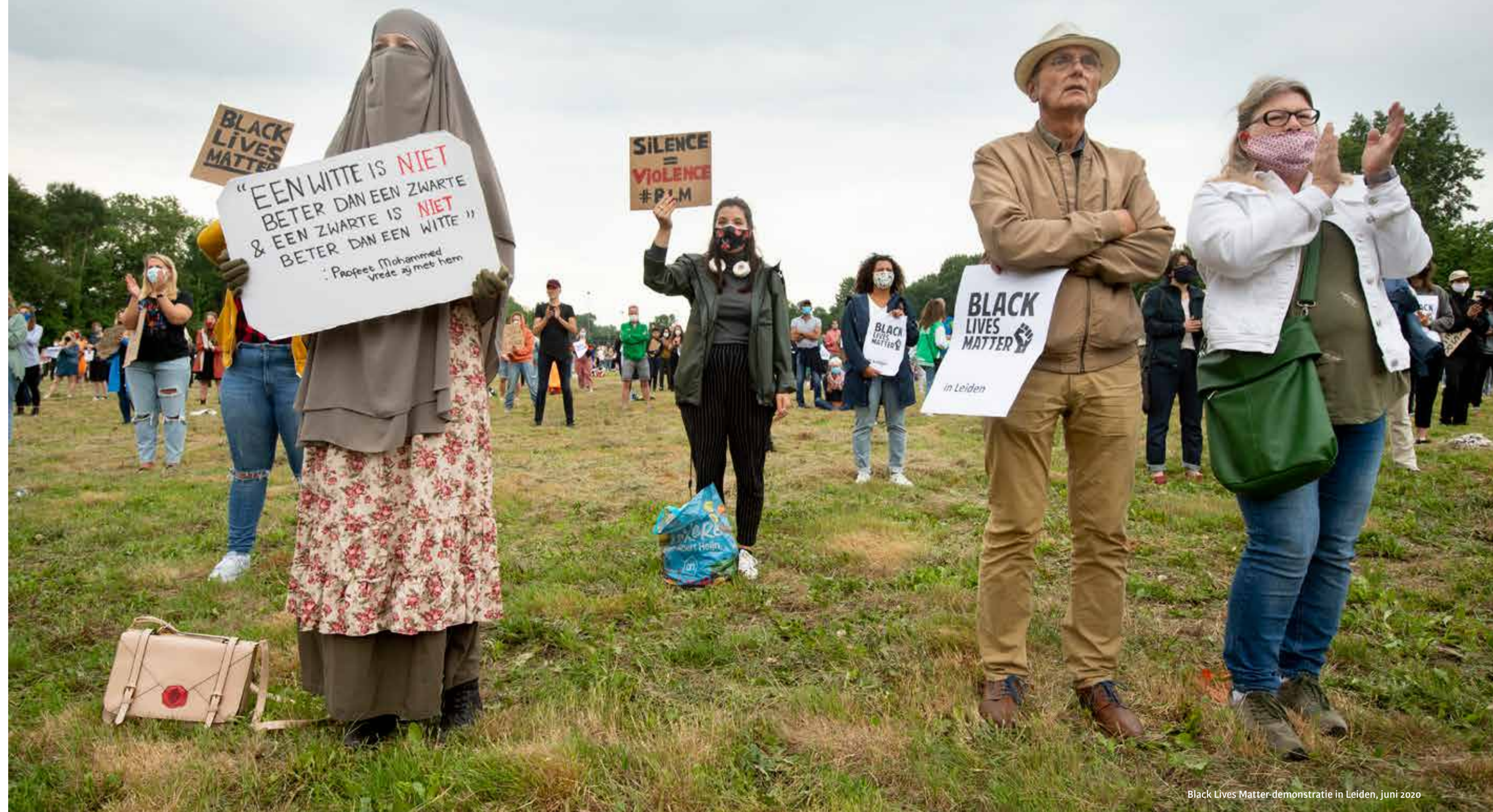
Black Lives Matter-demonstratie in Leiden, juni 2020

DOOR MARCIËLLE VAN DER KRAAN