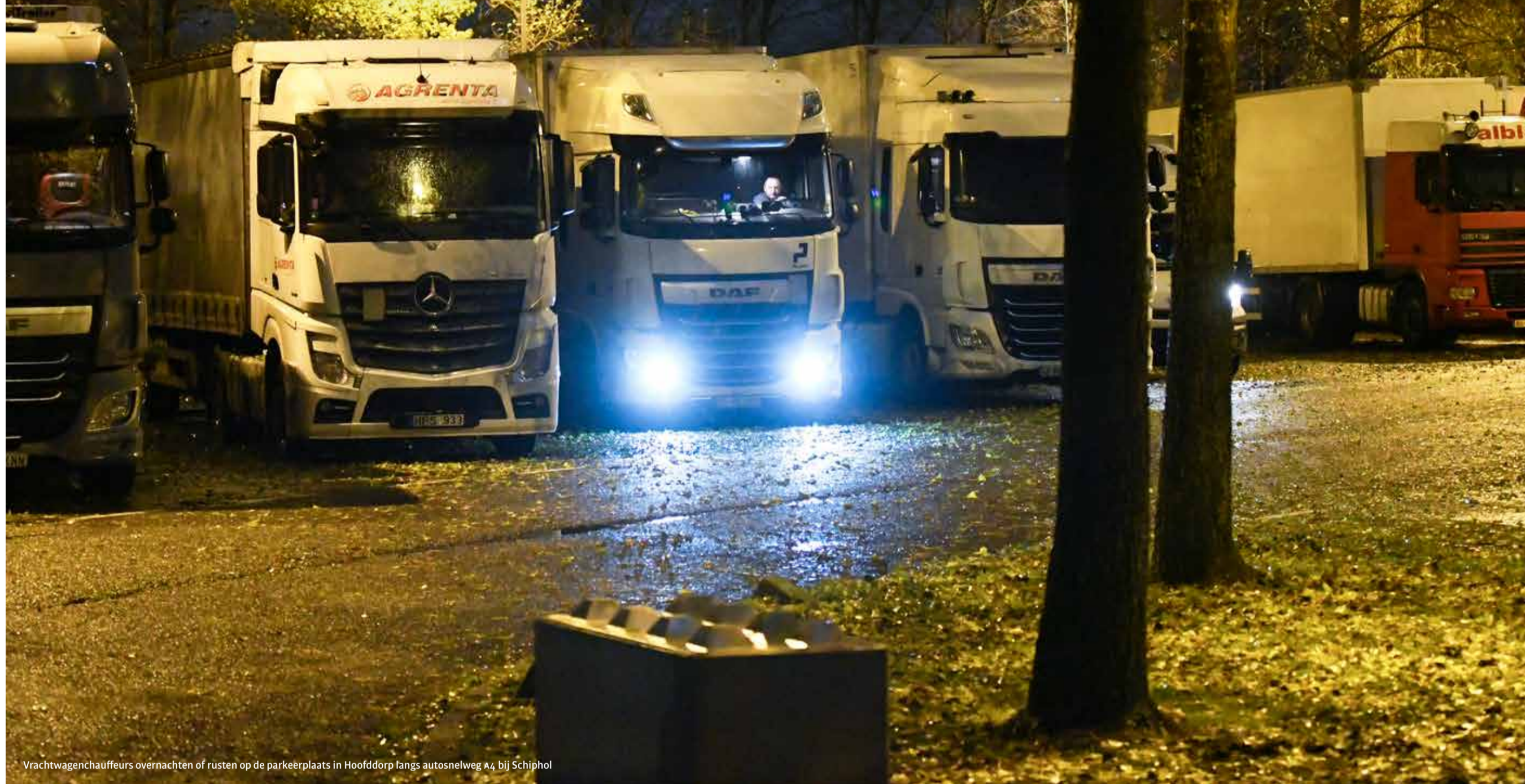
Vrachtwagenchauffeurs overnachten of rusten op de parkeerplaats in Hoofddorp langs autosnelweg A4, bij Schiphol