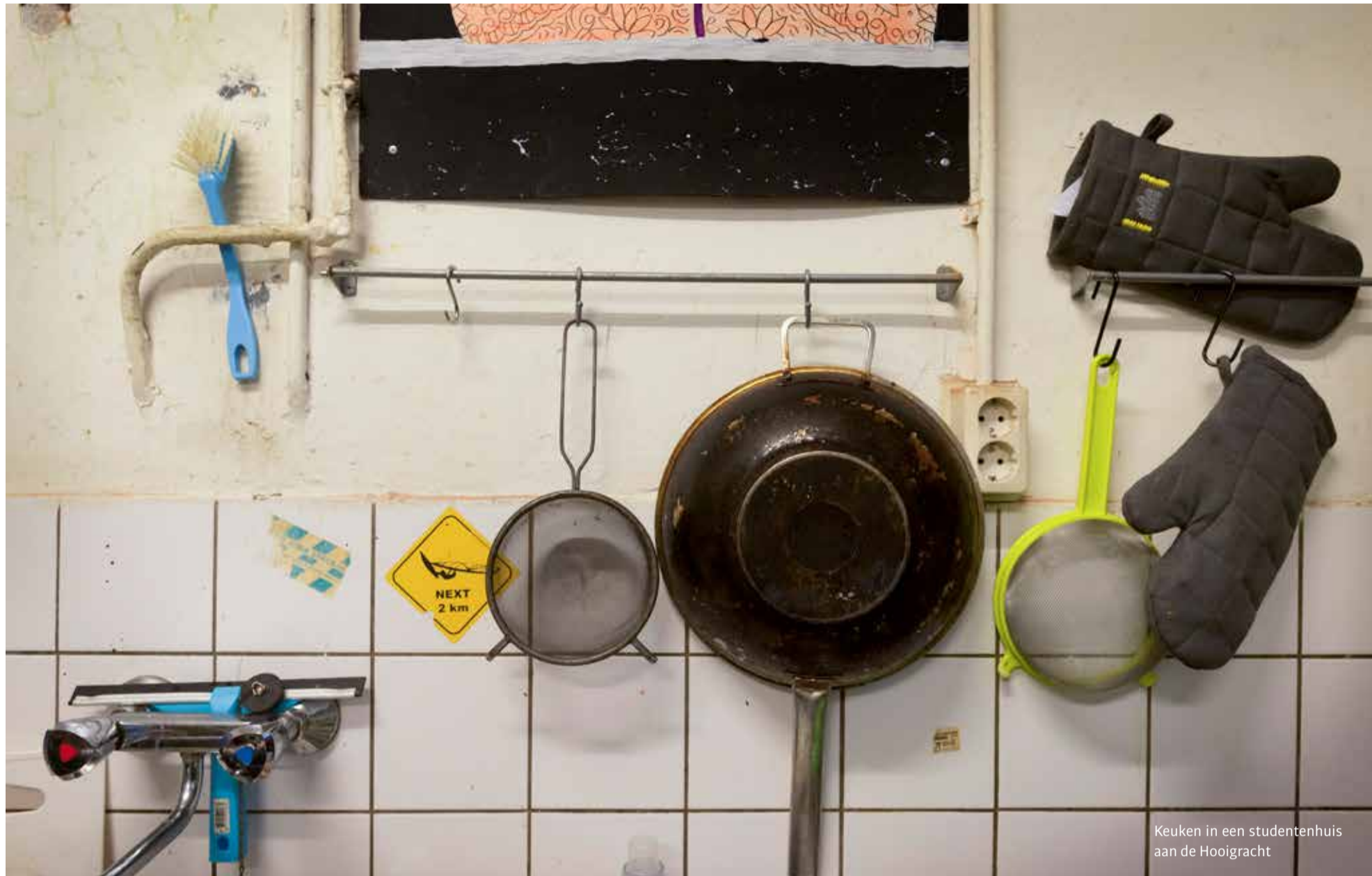
Keuken in een studentenhuus aan de Hooigracht