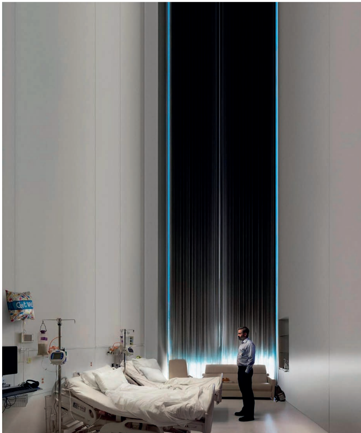
The Killing of a Sacred Deer , by Yorgos Lanthimos.

At Leiden International Film Festival, founded by students, you can watch psychological horror stories, sex in Tehran and the eternal struggle between men and women.