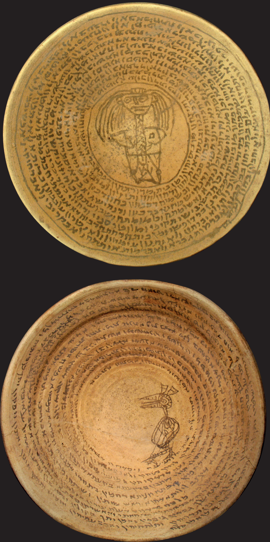
Babylonische toverschalen met tekeningen van demonen en Aramese teksten, vermoedelijk uit de zesde eeuw voor Christus.