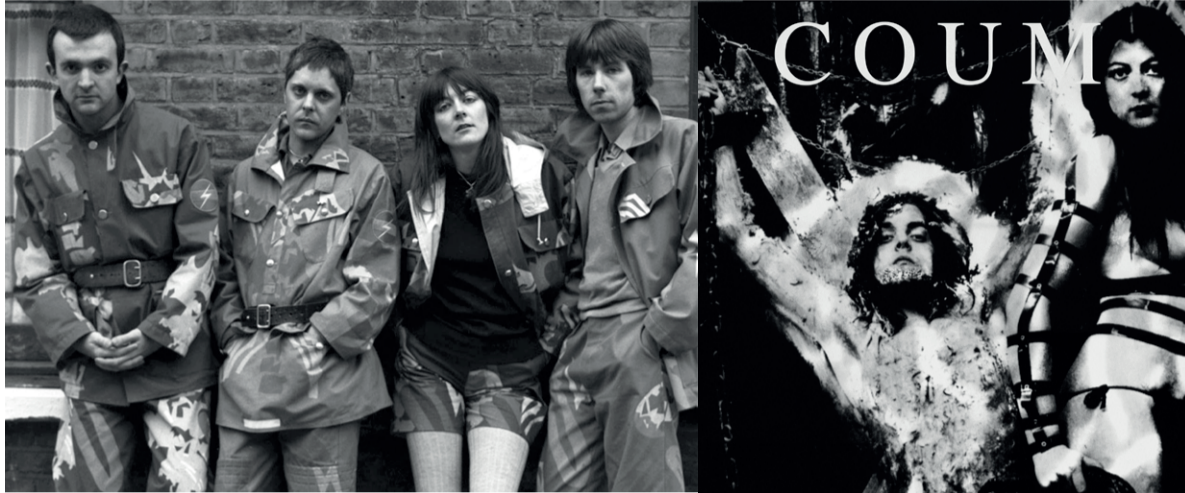
'We duwden de realiteit van SM en masturbatie recht in de gezichten van het publiek.'

Al snel vertrok Cosey naar Londen. 'Ik begon als model te werken voor seksbladen. Dat ging van licht erotische brave foto's tot stevig SM-werk. Ik was echt mijn seksualiteit aan het ontdekken en dat kwam duidelijk naar voren in onze art ac-