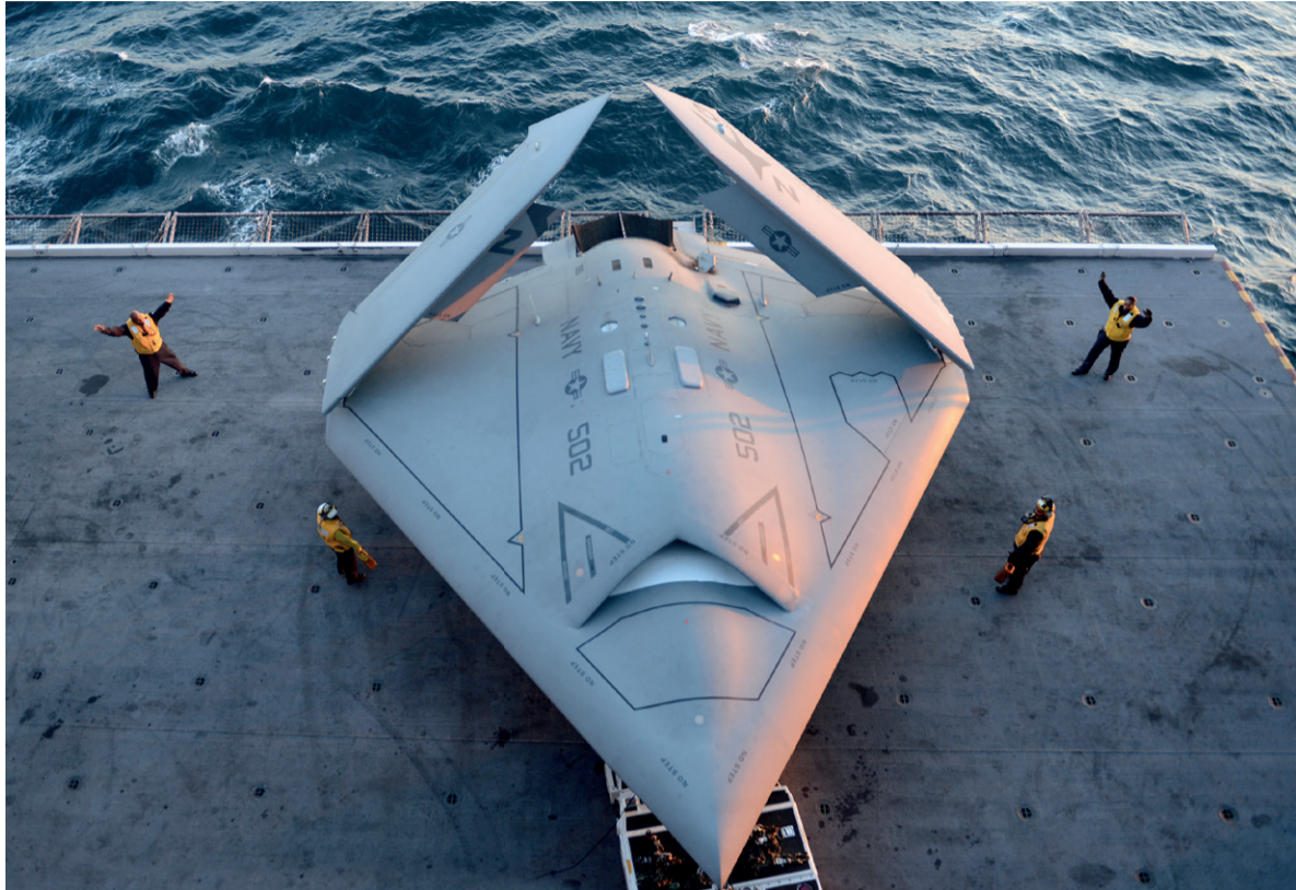
De Northrop Grumman X-47B: deze 'onzichtbare' drone filmt de lucht boven zich en vertoont die beelden vervolgens op een led-scherm aan de onderkant.

'Iedereen kent de Predator-drone van televisie, maar dat ding is al twintig jaar oud, en gaat nu langzamerhand uit dienst. De nieuwste generatie drones van het Amerikaanse leger is al in gebruik: de Northrop Grumman X-47B. Dat is een ingeniëus apparaat. Op de bovenkant zitten camera's die de lucht boven