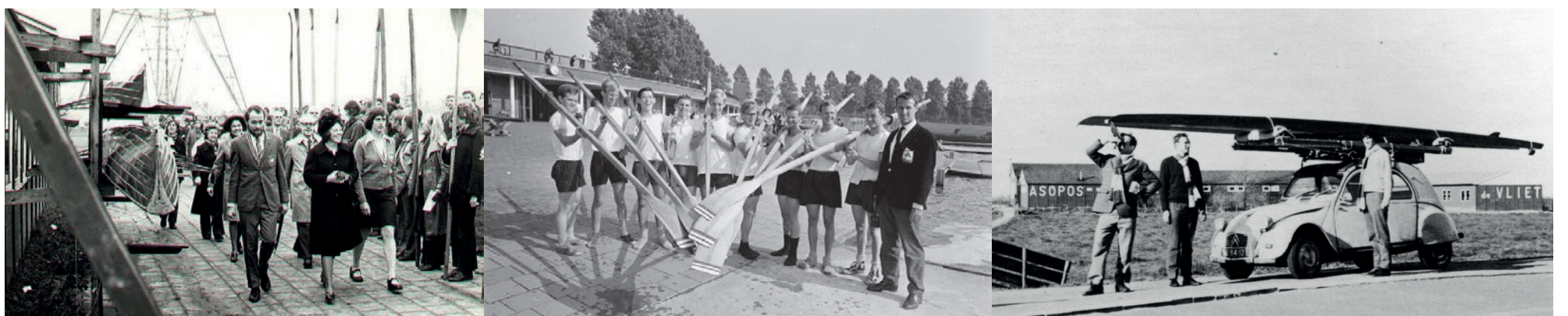
Van links naar rechts: prinses Beatrix opent Asopos de Vliet in 1974, de eerste nationale overwinning van de Lichte Acht in 1966 en Ed Maan met skiff in 1972.

Lustrumexpositie Asopos de Vliet, Oude UB, Rapenburg 70, t/m 26 januari