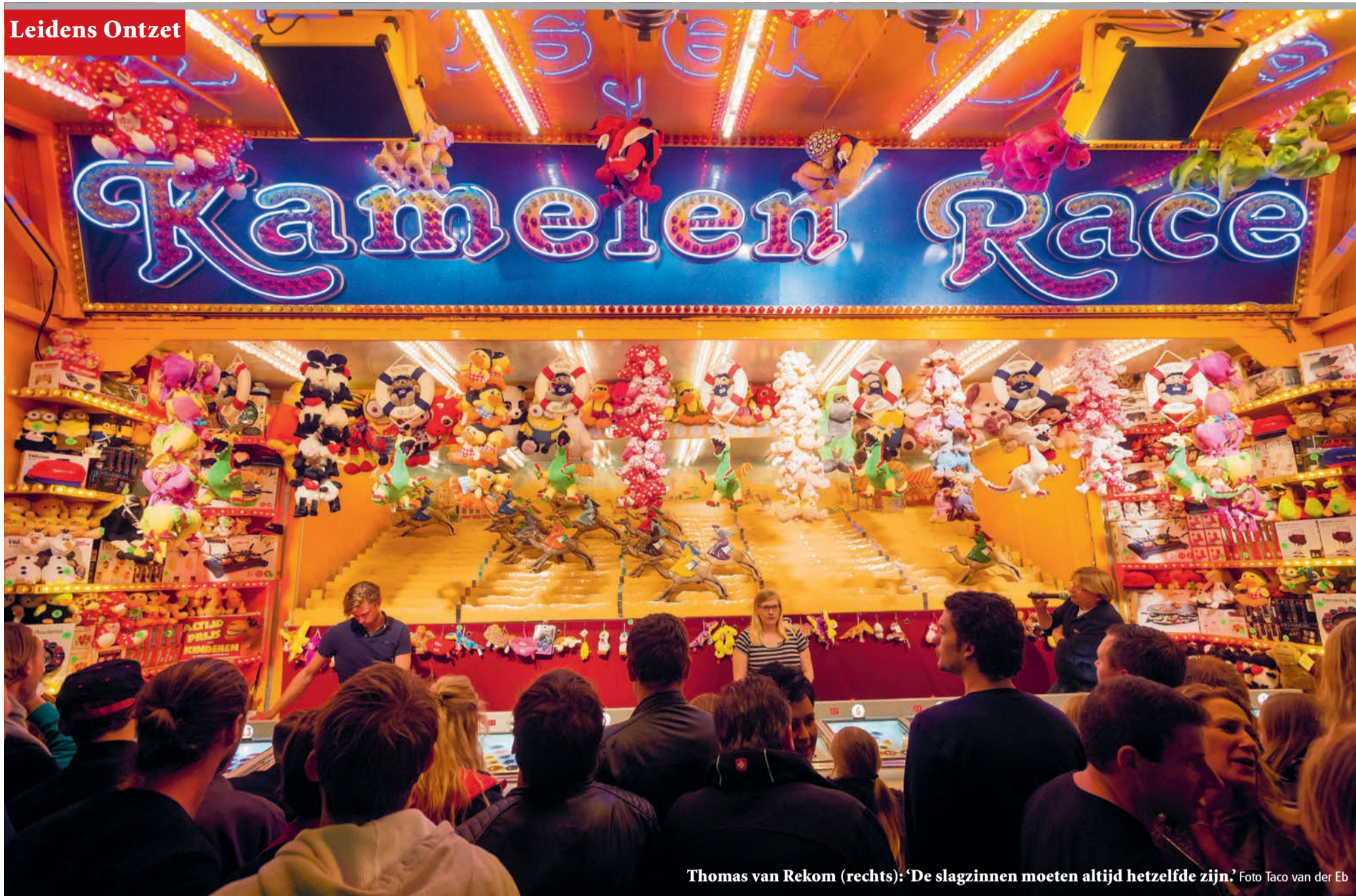
Thomas van Rekom (rechts): 'De slagzinnen moeten altijd hetzelfde zijn.'