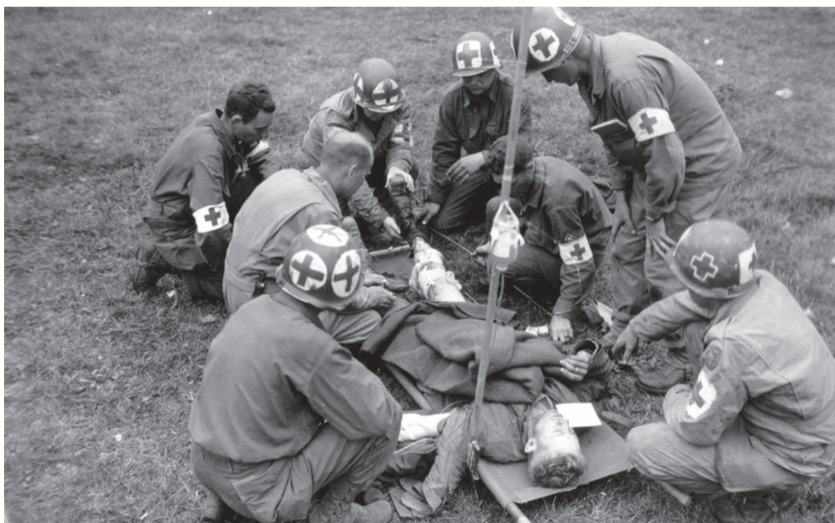
Geallieerde medics in Normandië, 1944.

'Tijdens de dekolonisatieoorlog hadden veel soldaten syfilis. Dat kwam zogenaamd omdat 80 tot 90 procent van de Indische vrou-