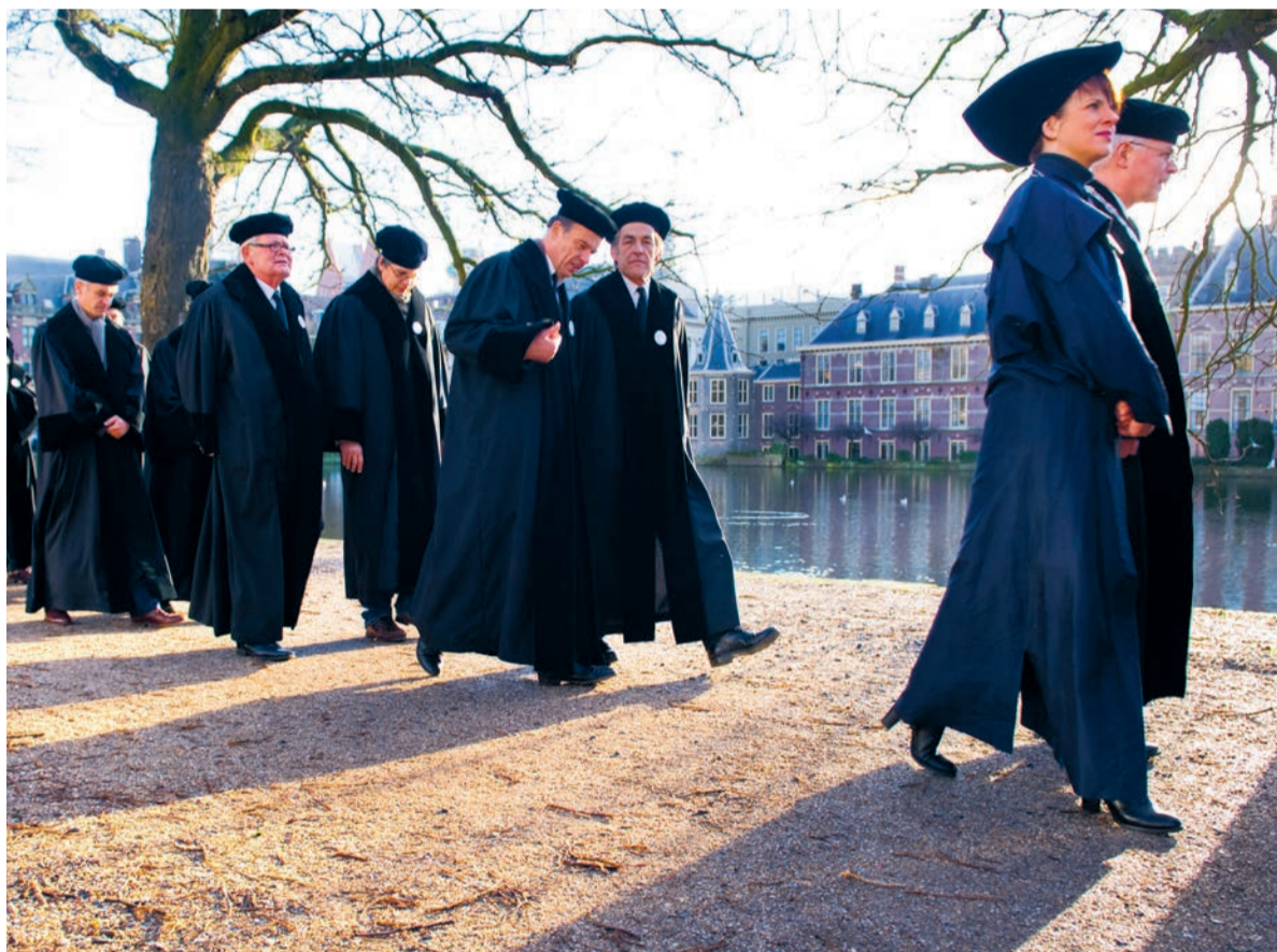
Landelijke protestmars van professoren in Den Haag, in 2011.