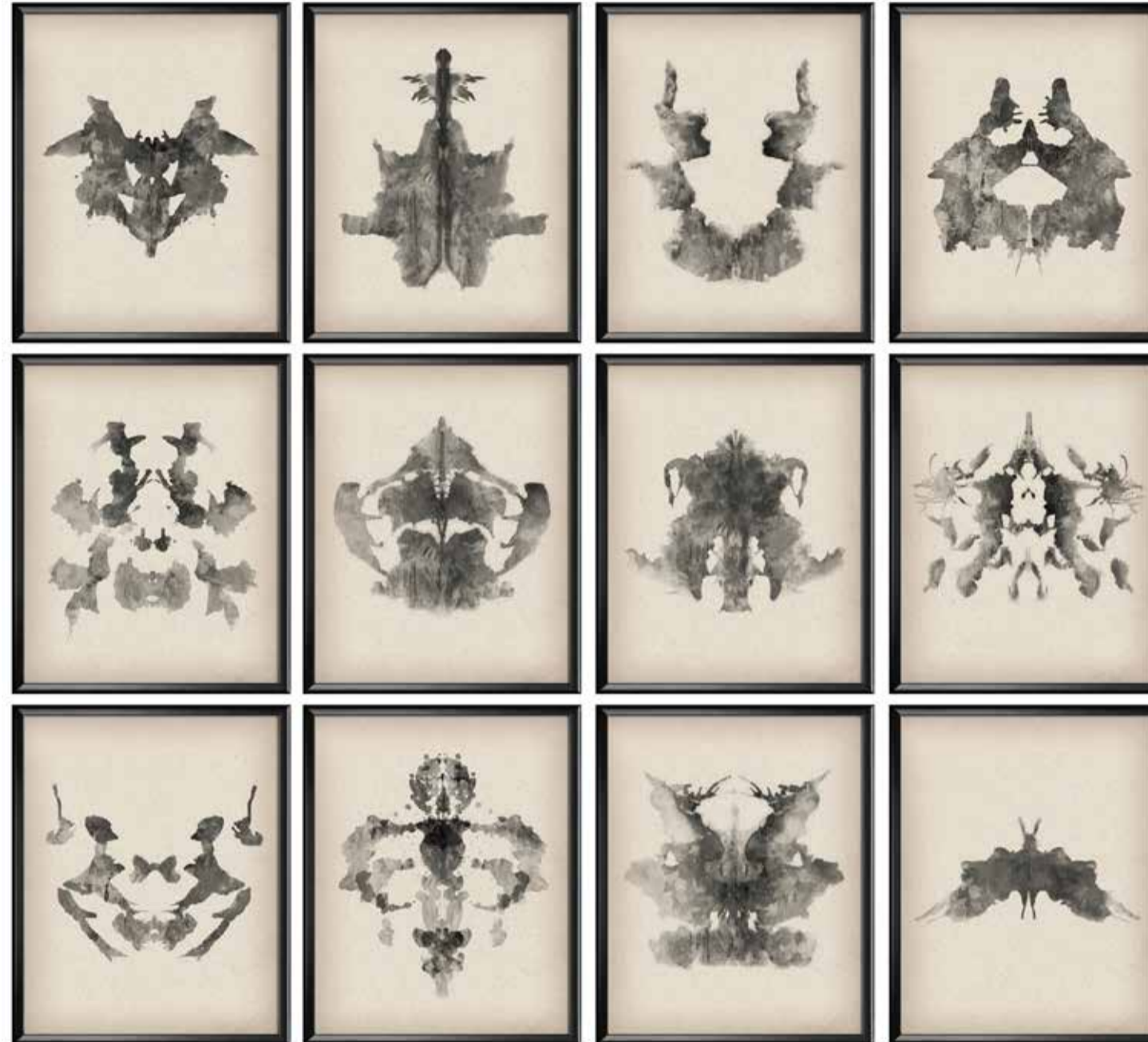
De inktvlektest van Hermann Rorschach (1884-1922), een van de behandelingen die tegenwoordig nog in afgeslakte vorm wordt ingezet

'Het zijn charismatische figuren die veel mensen achter zich weten te krijgen, met een groot formaat ego. Ze hebben een zucht naar erkenning, roem en soms ook geld. Maar ze wilden ook mensen helpen. Sommigen waren daarin onvermoeibaar.'