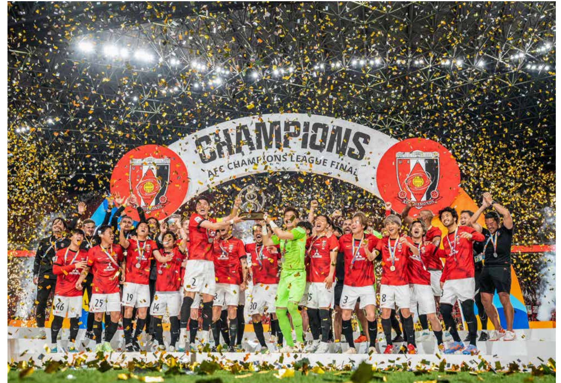
Twee kampioenswedstrijden in één week: Feyenoord wordt landskampioen (links) en Urawa Red Diamonds wint de Asian Champions League