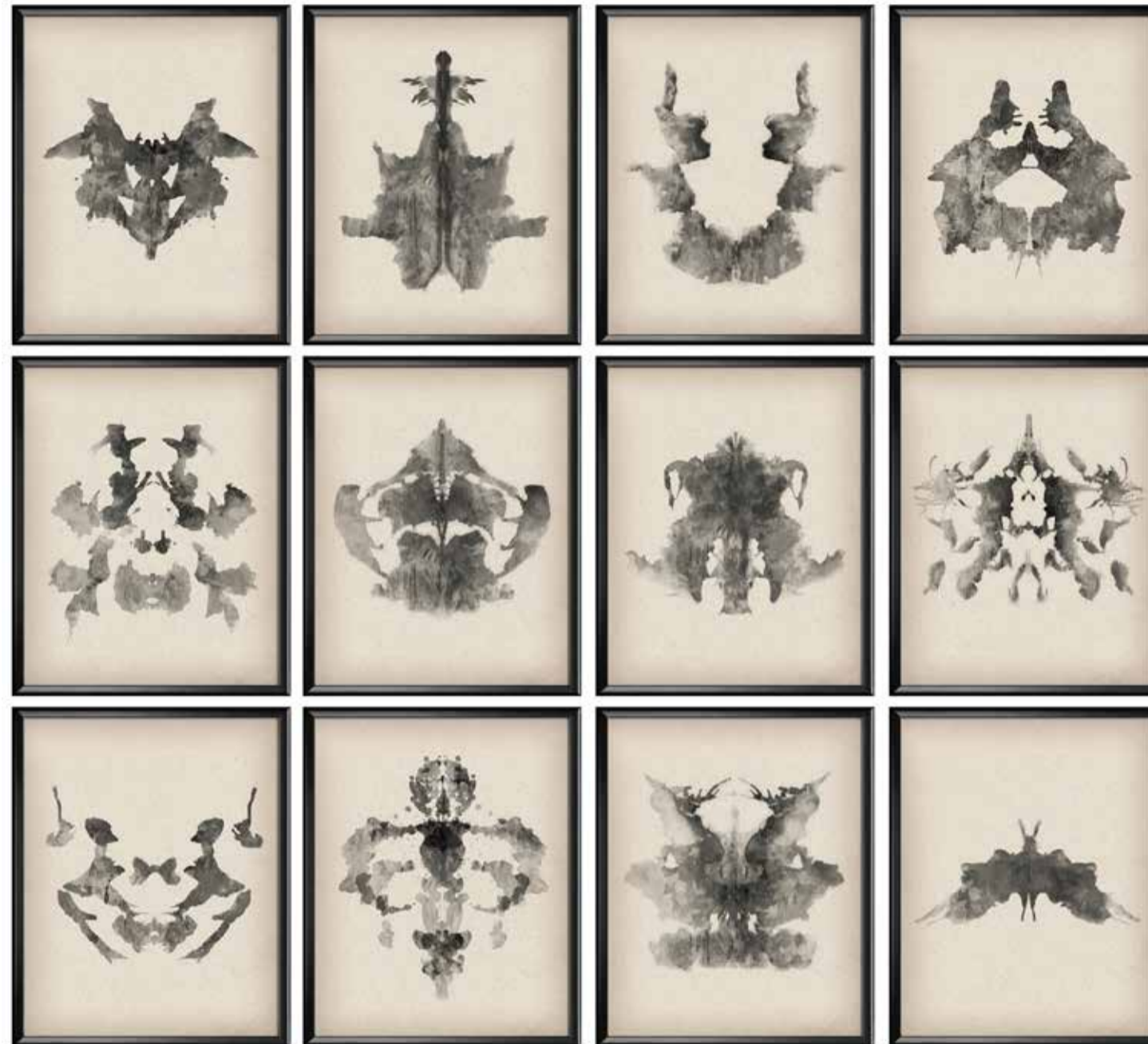
De inktvlektest van Hermann Rorschach (1884-1922), een van de behandelingen die tegenwoordig nog in afgeslakte vorm wordt ingezet

'Het zijn charismatische figuren die veel mensen achter zich weten te krijgen, met een groot formaat ego. Ze hebben een zucht naar erkenning, roem en soms ook geld. Maar ze wilden ook mensen helpen. Sommigen waren daarin onvermoeibaar.'