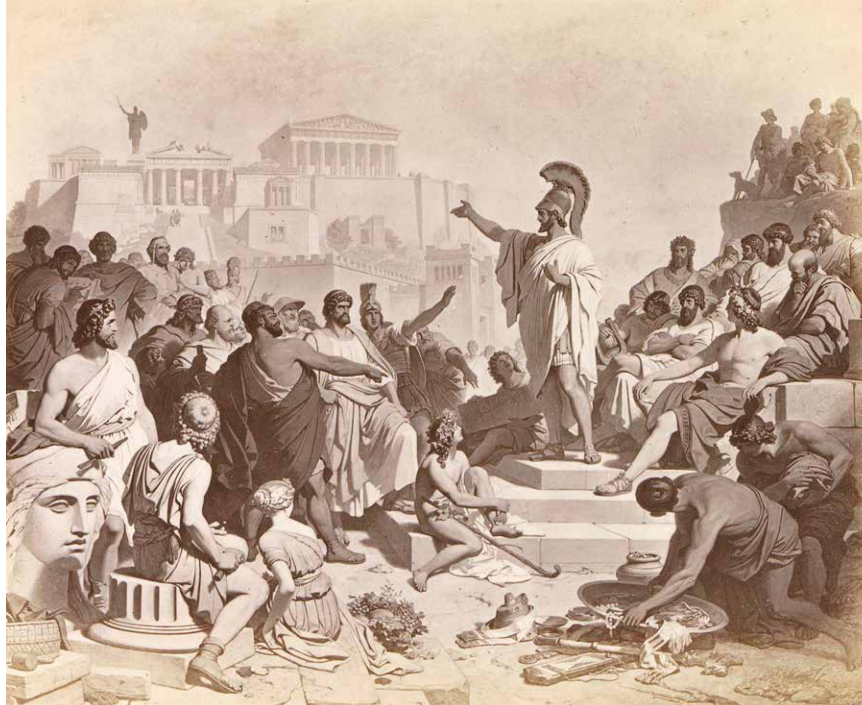
Fotoreproductie van een schilderij van Philipp Foltz, voorstellende Pericles die in Athene een grafrede voordraagt, anoniem. Collectie Rijkmuseum

universiteit zelf. 'Ik wijs onderwijsbestuurders op hun rol en wettelijke verantwoordelijkheid.' Het jaar daarop stelde minister Dijkgraaf in antwoord op Kamervragen dat versterking van de wettelijke rechten niet nodig is. Hij laat het aan de instellingen over om samen met de medezeggenschappers te bepalen hoe die het best kunnen worden geschoold en ondersteund. Of de campagne van Dijkgraaf is aangeslagen in Leiden is nog maar de vraag. Een sterke communicatie vanuit de universiteit ontbrak in ieder geval. Studenten ontvingen op maandagochtend in de verkiezingsweek een mail met korte uitleg over de verkiezingen. Als ze al een poging deden om zich verder in te lezen vonden ze op de website documenten met lange rijen aan namen van de kandidaten op wie ze konden stemmen. Engelstalige versies waren hiervan niet beschikbaar. Uitleg over op wie ze dan precies stemden, kwam in de vorm van een kleine, onopvallende link, die de student naar een interview met de partijen leidde, hetgeen een gehaaste student makkelijk over het hoofd ziet. Toch moeten studentenpartijen ook de hand in eigen boezem steken: raadsleden moeten zichtbaar zijn en zelf binding zoeken met de achterban. Tegelijkertijd horen we geluiden van raadsleden die aanklaarten ondersteuning in de werkzaamheden te missen en dit vaak tevergeefs hebben aangekaart bij hun faculteit of raad.