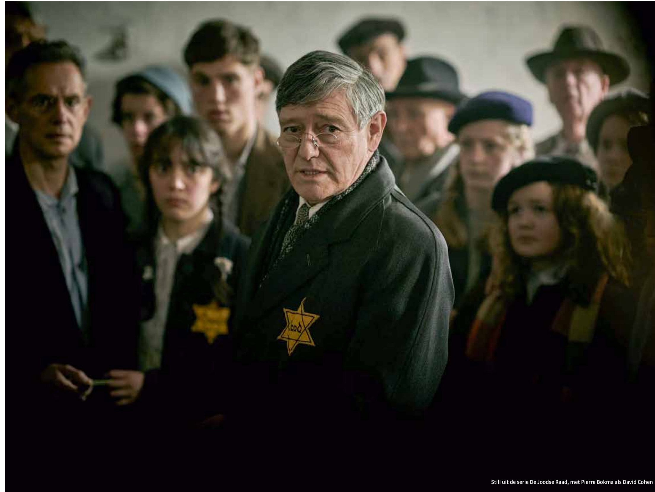
Still uit de serie De Joodse Raad , met Pierre Bokma als David Cohen

‘Natuurlijk gebeuren er dingen die wij niet kunnen weten, anders heb je geen serie’