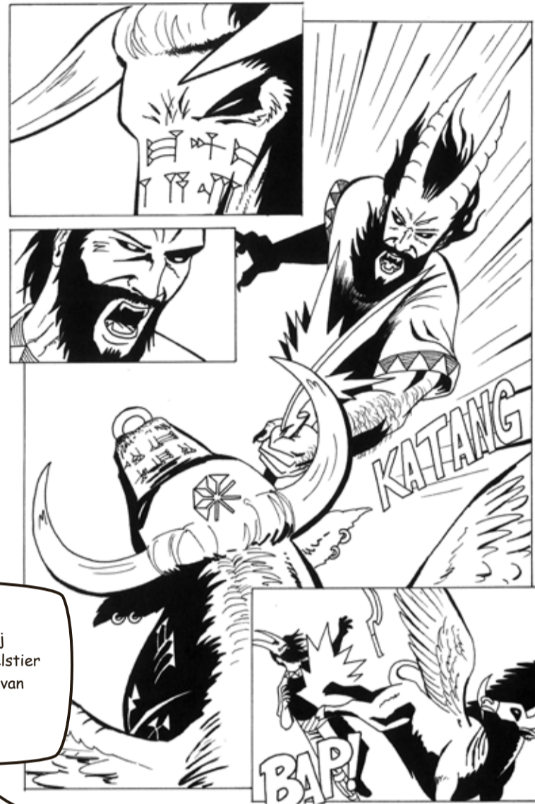
Enkidu en Gilgamesj bevechten de hemelstier in de interpretatie van Winegarner