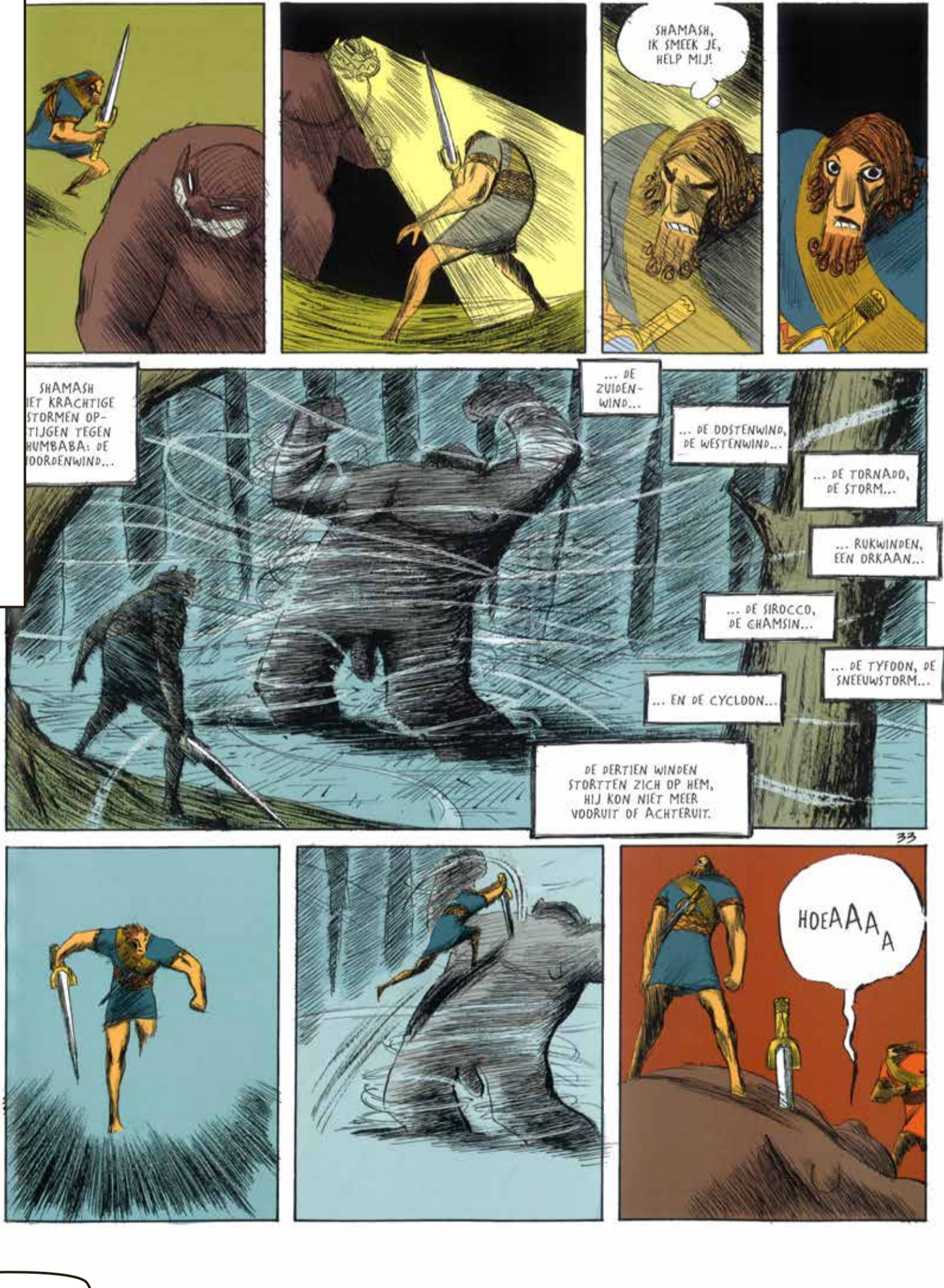
Hoembaba zoals verbeeld door Bonneval & Duchazeau