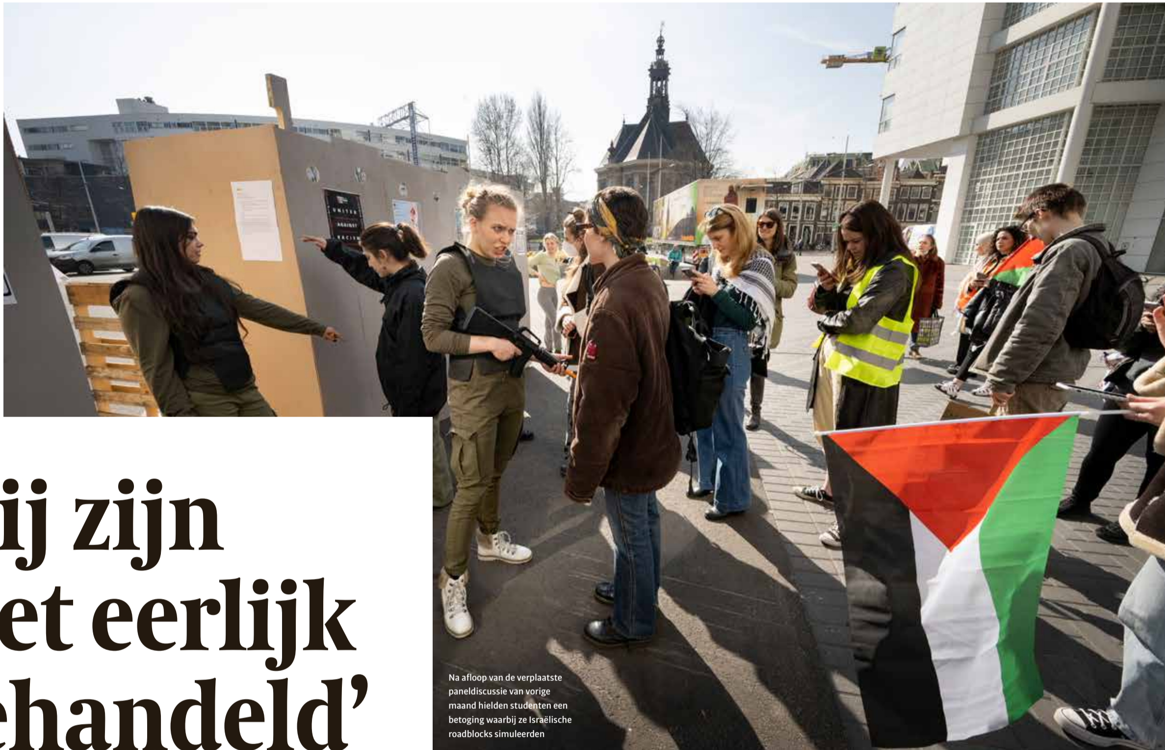
Na afloop van de verplaatste paneldiscussie van vorige maand hielden studenten een betoging waarbij ze Israëlische roadblocks simuleerden

Liefwaard zei ook nog dat alleen aandacht in het LLP voor mail-etiquette niet voldoende is. 'Dat moet later in de opleiding ook opvolging krijgen. We moeten er niet mee stoppen.'