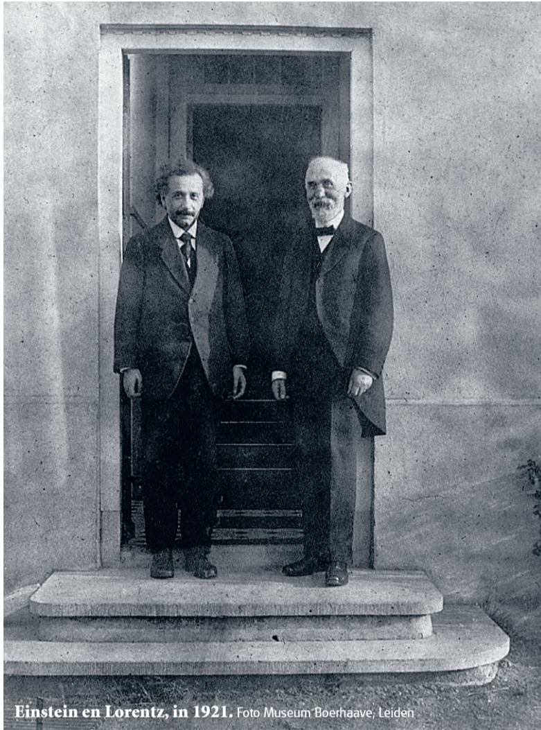
Einstein en Lorentz, in 1921.

De eerste aanwijzing voor het bestaan van die elektronen kwam van de eveneens Leidse natuurkundige Pieter Zeeman. Onder invloed van een sterke magneet splitst het licht-spectrum van een natriumvlam zich op, en dat klopte allemaal prachtig