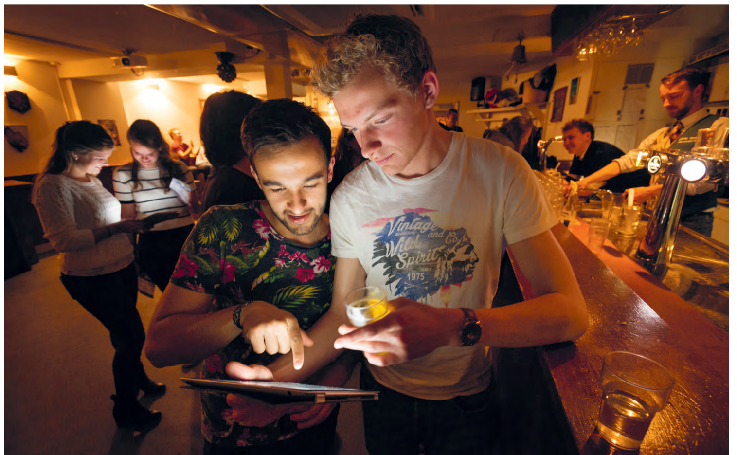
De Christelijke Studentenfractie Leiden werft dinsdagavond stemmen aan de bar van NSL. 'Iedereen zit thuis of in de UB.'

'De timing van deze verkiezingen is om het bot te zeggen: nogal ruk', vindt Schelte van