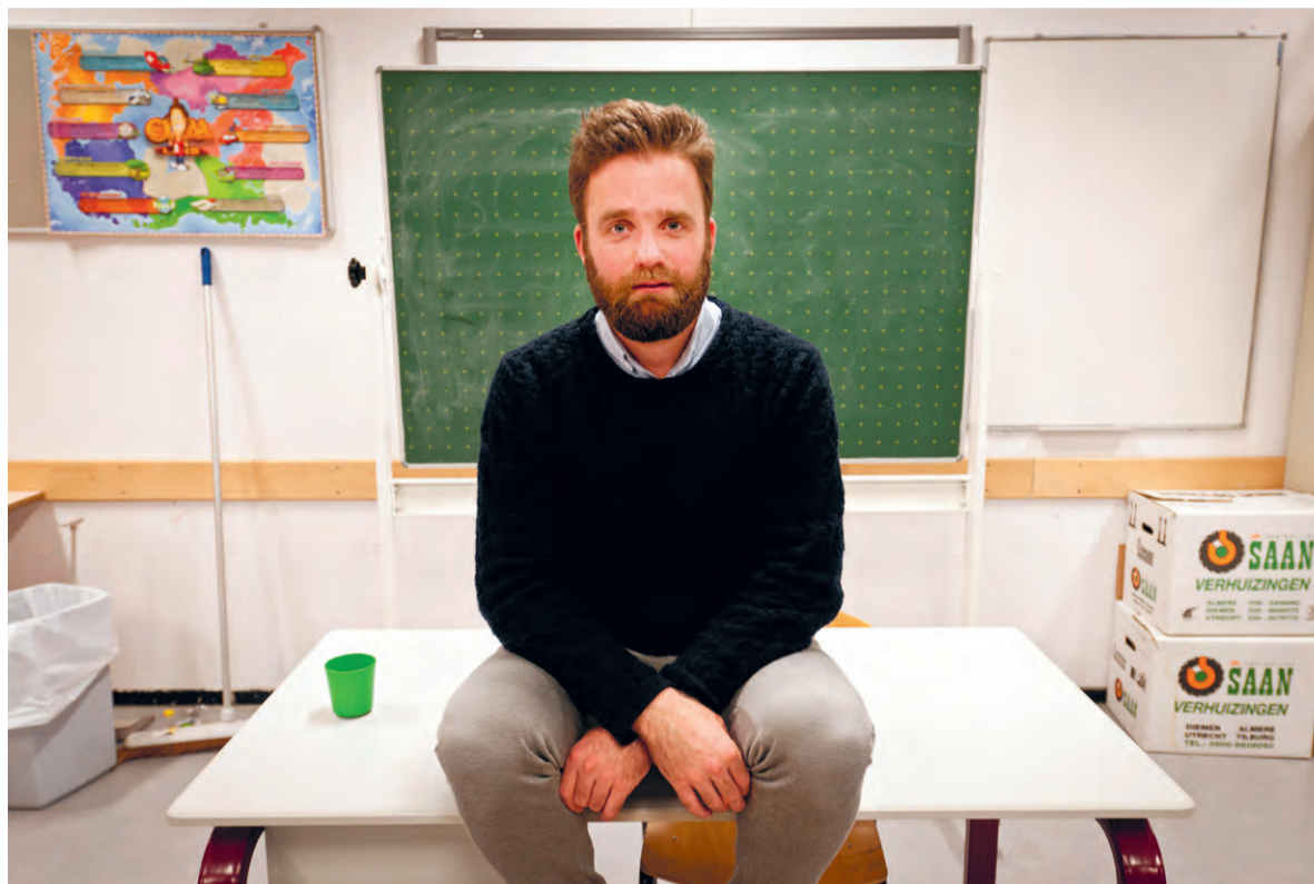
'Ik loop echt niet als een of andere beroemdheid door de gangen van de school.'

'Nee, hoor. Ik loop echt niet als een of andere beroemdheid door de gangen. Uiteraard kennen veel