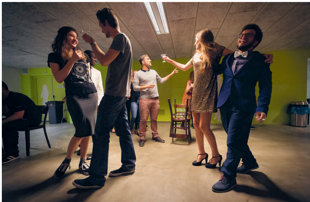
'Okay guys, maak nu met je heupen de minst aantrekkelijke cirkels ooit.'

'Okay guys, maak nu met je heupen de minst aantrekkelijke cirkels ooit.' Op instructie van Simons draaien de acteurs braaf grote rondjes. Als alle gewrichten los zijn, volgen er nog wat kapotte-broodrooster-achtige spelle-