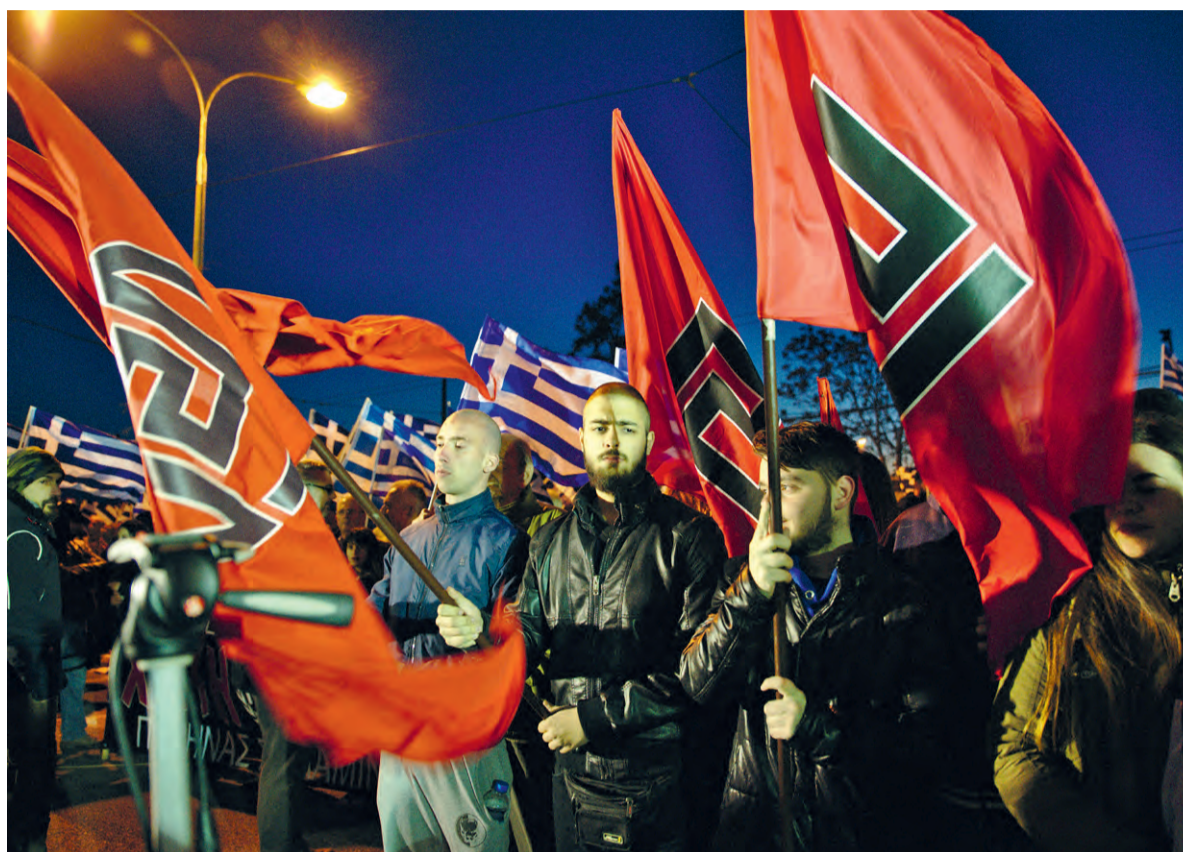
Demonstratie van Gouden Dageraad in Griekenland. De extreemrechtse partij schuwt geweld tegen migranten niet. Het symbool op de vlaggen is geen swastika, maar een oud-Grieks symbool, de meandros.