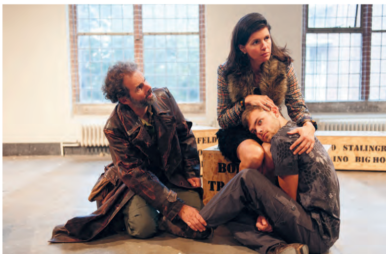
'List, bedrog en geweld zijn de wapens van Odysseus.'

'In deze bewerking stuit hij op een strandlooper die toevallig Athene heet, maar niets goddelijks heeft. Ze leeft van het juttan. En er spoelt van alles aan op het strand, vooral ook vluchtelingen. Het stuk is uit 2010,