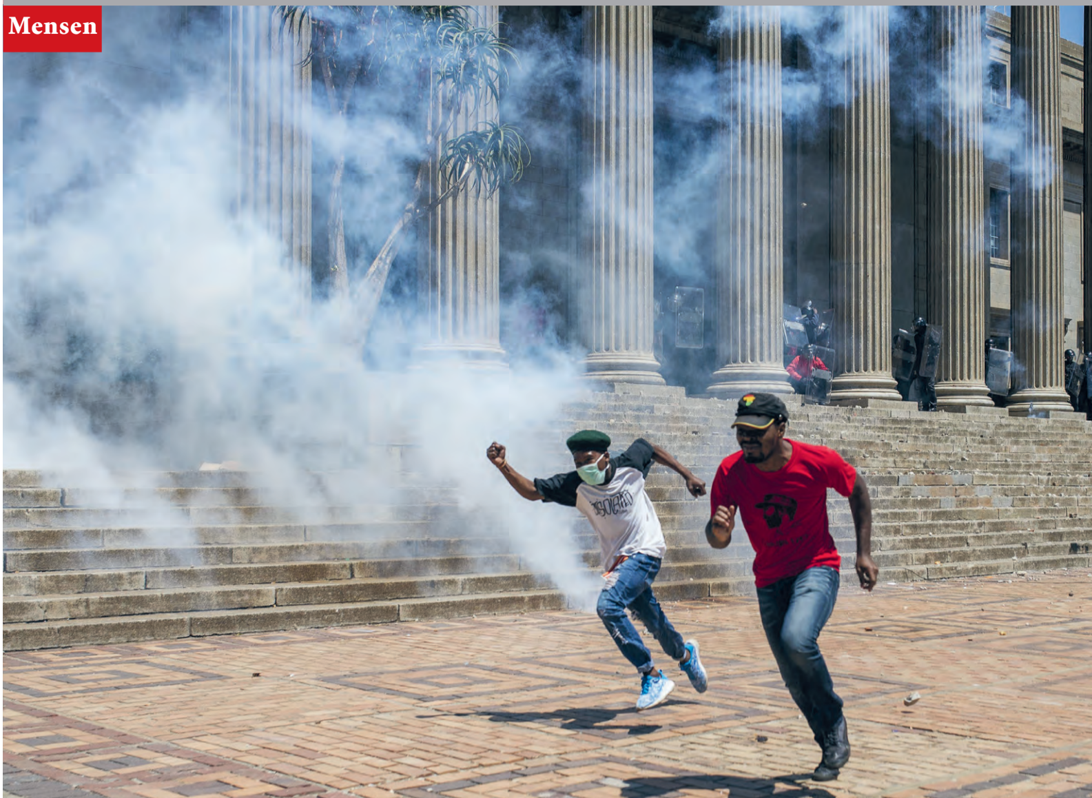
Studenten zoeken dekking tijdens protesten op de Universiteit van Witwatersrand.