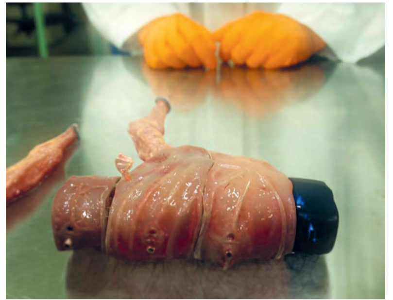
'Oscar bestaat geheel uit menselijke cellen, maar is 't ook een mens? Heeft hij rechten? Als de subsidie op is, mag je dan zijn leven beëindigen?'

De verleiding om van Oscar een nieuwe hoax te maken heeft hij weer-