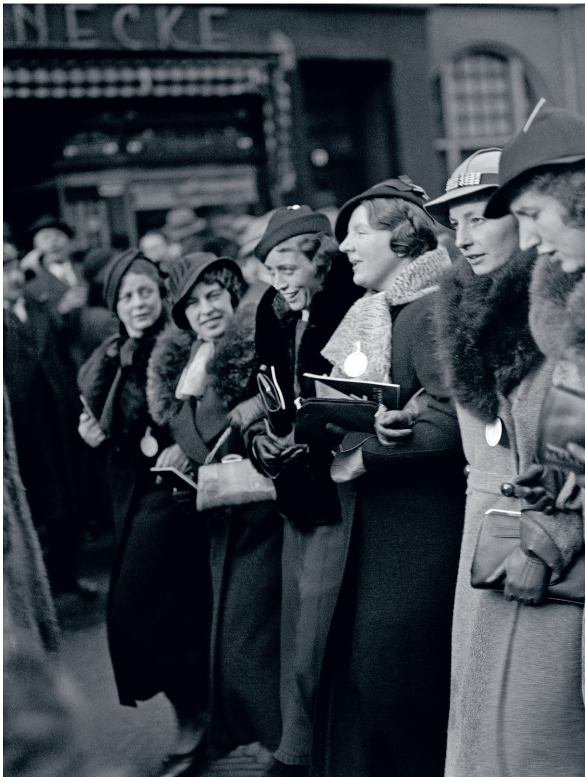
Prinses Juliana temidden van studiegenoten tijdens de intocht van de reünisten ter gelegenheid van het zevende lustrum van haar studentenvereniging VVSL

Hoewel het verenigingsleven nog gescheiden was – de VVSL zou pas in 1973 met het mannelijke Leids Studenten Corps opgaan in Minerva – kwam de 'wereldvreemde Juliana in aanraking met een seksuele werkelijkheid die haar tot dan toe on-