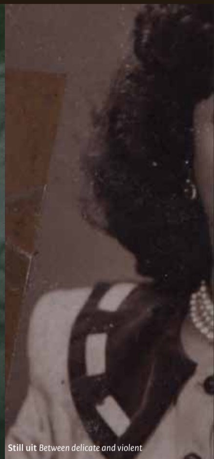
Still uit Between delicate and violent