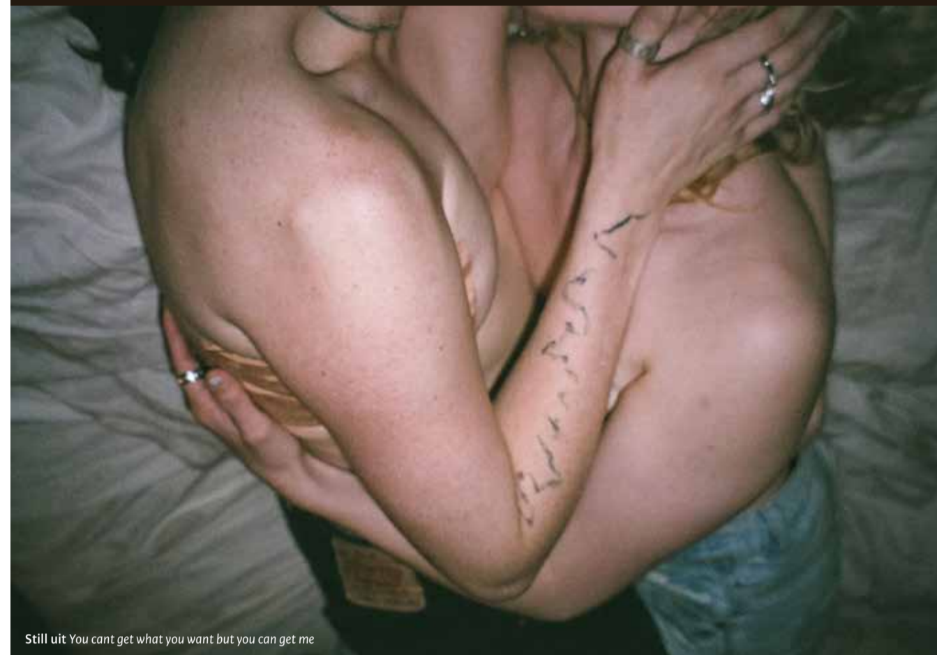
Still uit You cant get what you want but you can get me