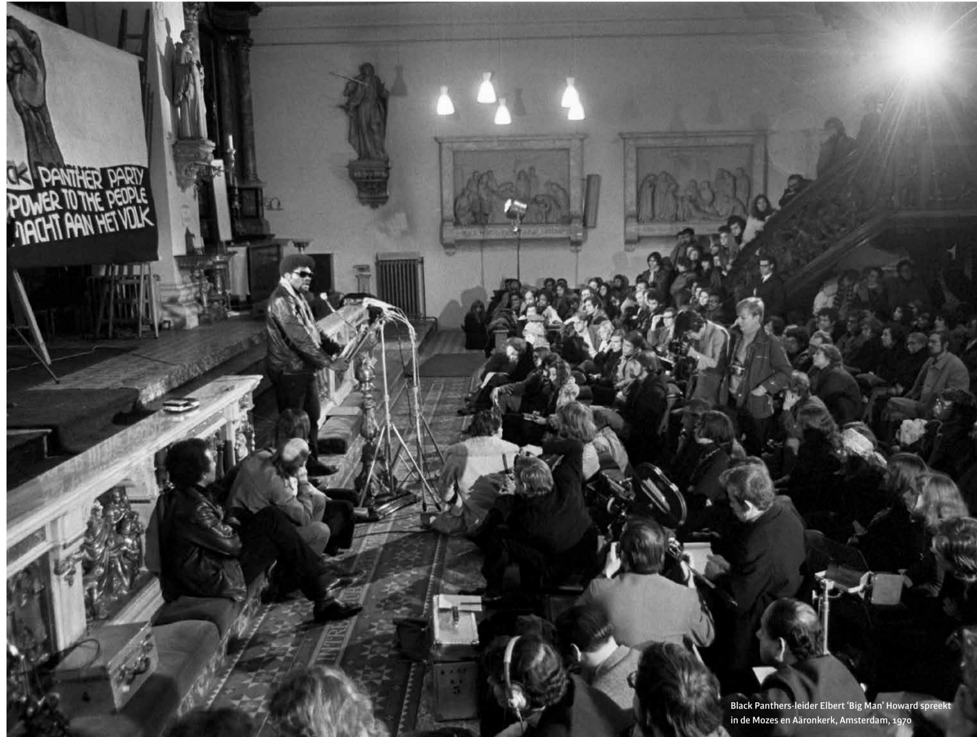
Black Panthers-leider Elbert 'Big Man' Howard spreekt in de Mozes en Aäronkerk, Amsterdam, 1970

Via de Antillen en Suriname bereikte de Amerikaanse Black Power-beweging in de jaren zestig ook Nederland. De missie van zelfbeschikking, zelfbescherming en trots leek eenduidig, maar gaandeweg groeiden de verschillen. 'Sommigen wilden meteen revolutie.'