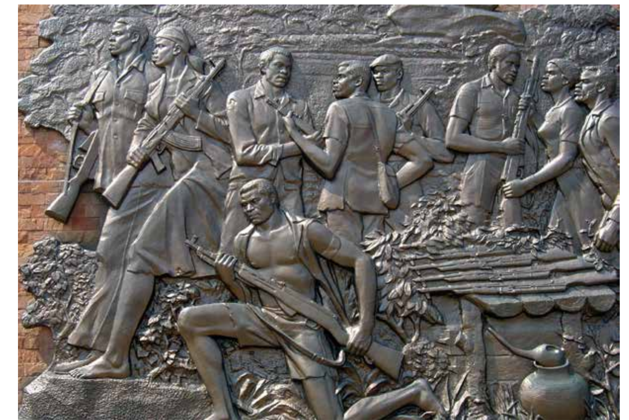
Boven: Kim Il Sung tussen de Afrikaanse leiders (boven). Daaronder: het African Renaissance Monument in Dakar, Senegal (links) en het National Heroes Acre in Harare, Zimbabwe (rechts)