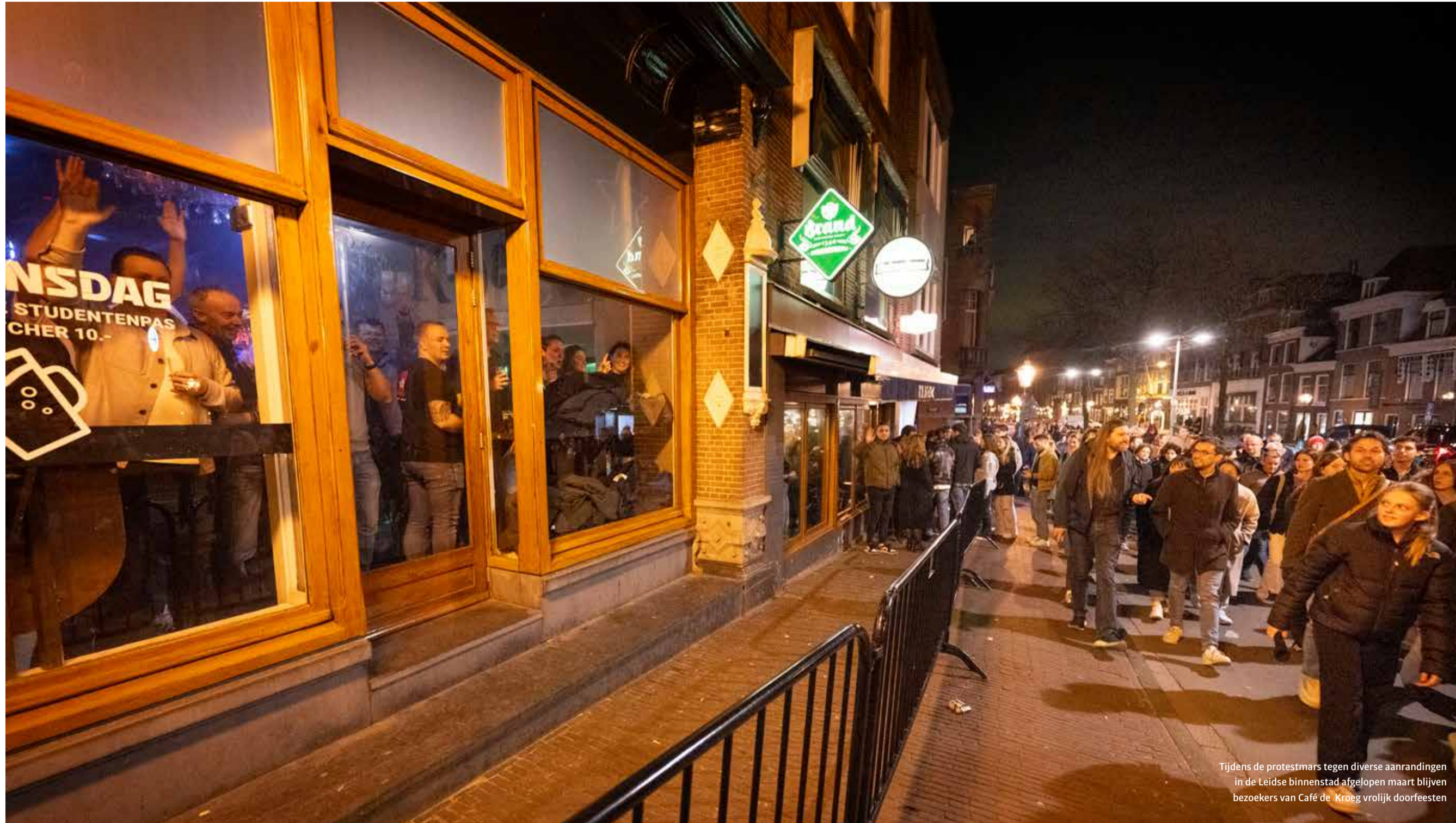
Tijdens de protestmars tegen diverse aanrandingen in de Leidse binnenstad afgelopen maart blijven bezoekers van Café de Kroeg vrolijk doorfeesten

Café de Kroeg geeft al jaren dansfeesten, maar heeft daar volgens de gemeente niet de juiste vergunningen voor. Buurtbewoners zijn er klaar mee en dienen een handhavingsverzoek in. 'Wij kunnen moeilijk alleen klassieke muziek draaien om te zorgen dat mensen blijven zitten.'