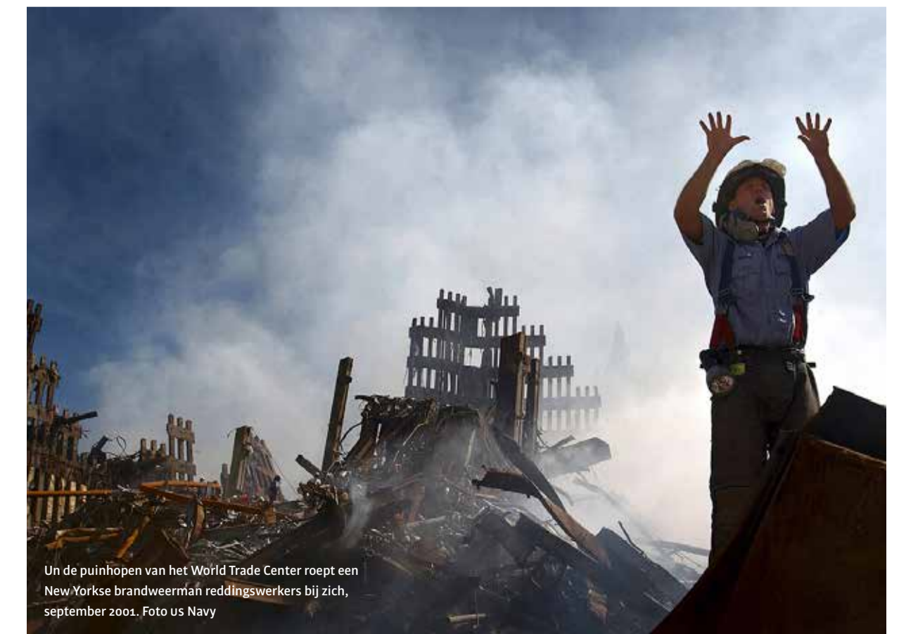
Un de puinhopen van het World Trade Center roept een New Yorkse brandweerman reddingswerkers bij zich, september 2001.