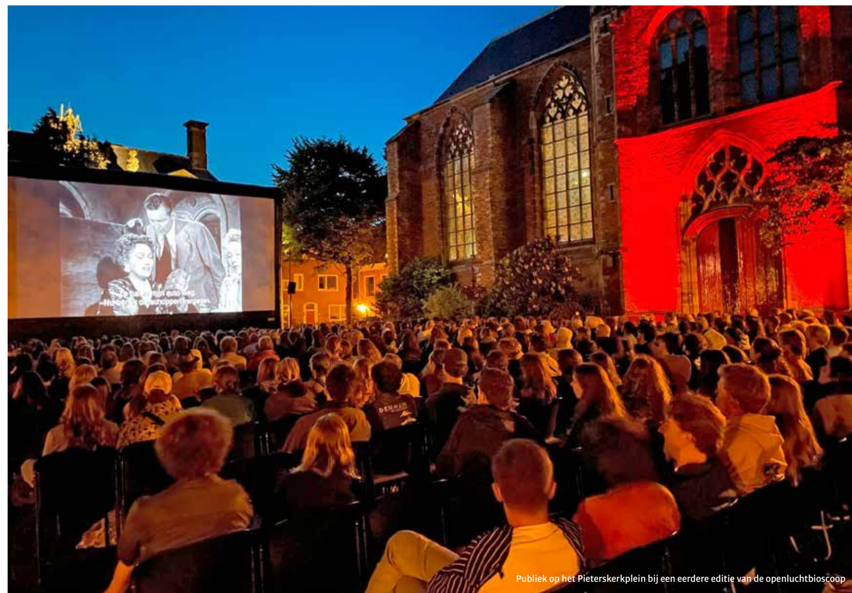
Publiek op het Pieterskerkplein bij een eerdere editie van de openluchtbioscoop

Deze column is korter dan normaal. Dat leek me wel zo efficiënt