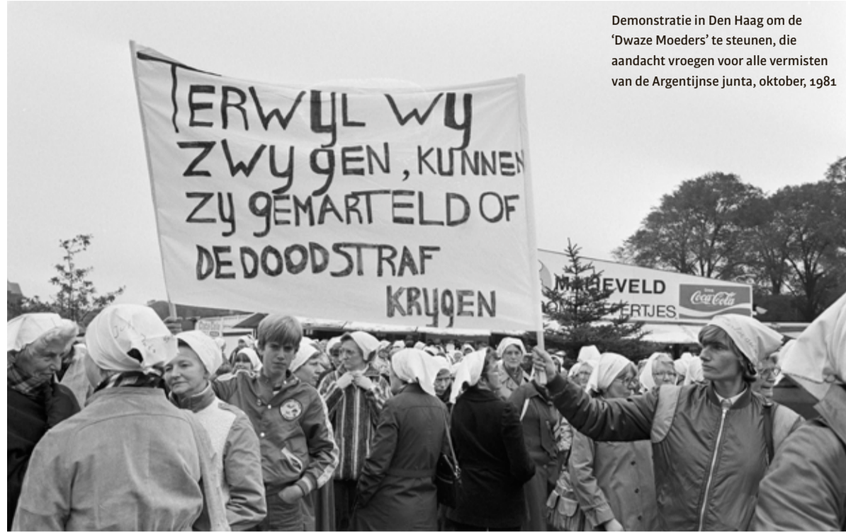
Demonstratie in Den Haag om de 'Dwaze Moeders' te steunen, die aandacht vroegen voor alle vermisten van de Argentijnse junta, oktober, 1981