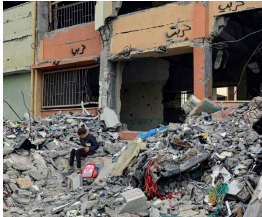
Verwoeste school in Gaza, uit de tentoonstelling Picturing Scholasticism: The Future of Higher Education in Palestine

Aangezien aanvullende vragen onbeantwoord bleven, wil de universiteitsraad geen advies geven over het verbreken en opschorten van banden met Israëlische instellingen. 'We kunnen onze mening geven maar op basis waarvan doen we dat dan?'