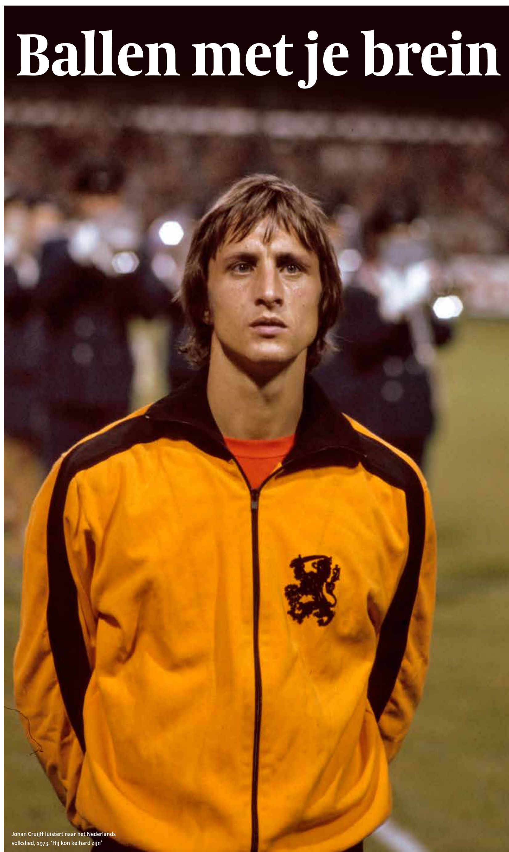
Johan Cruyff luistert naar het Nederlands volkslied, 1973. 'Hij kon keihard zijn'