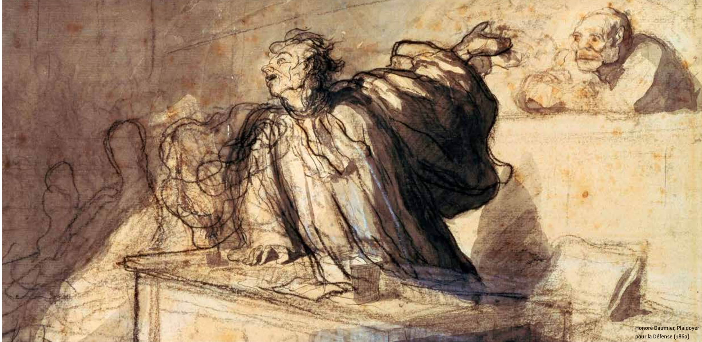
Honoré Daumier, Plaidoyer pour la Défense (1860)

De sfeer binnen studievereniging BASIS is zo verziekt dat pesterijen door de penningmeester zelfs na de afronding van het onderzoek door de ombudsfunctionaris nog bleven aanhouden. ‘Dit heeft mijn mentale welzijn enorm verstoord.’