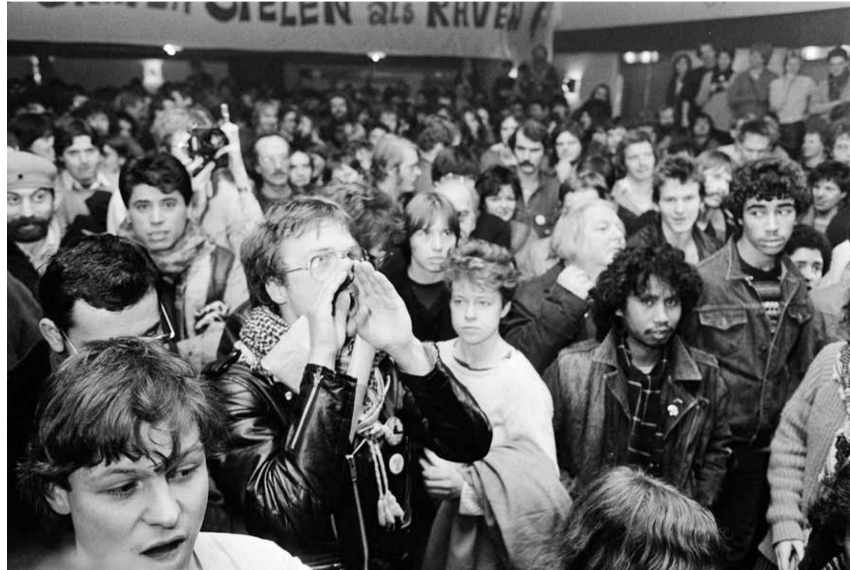
Fusiecongres van de KWJ en de NVV-JC in Nijmegen op 18 december 1982. Jongeren juichen tijdens een toespraak van FNV-voorzitter Wim Kok