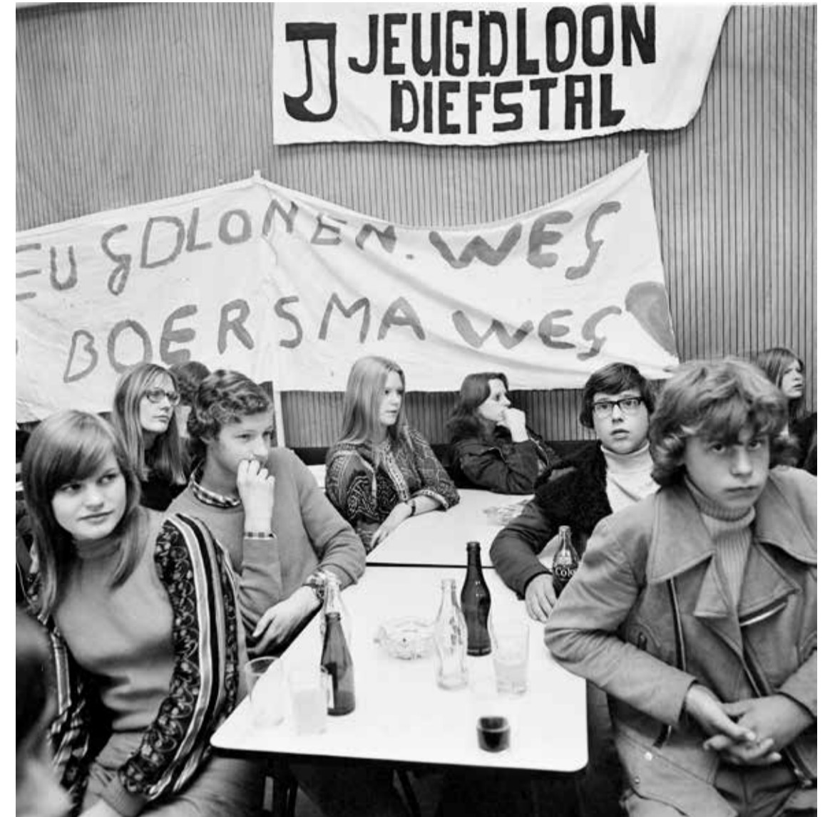
Jongeren luisteren naar minister van Sociale Zaken Boersma tijdens de NVV-JC-vergadering op zaterdag 27 oktober 1973

Stakingen, boycots en bezettingen: historicus Rosa Kösters onderzocht hoe opstandige werknemers zich organiseerden om hun arbeidsomstandigheden te verbeteren. 'Collega's moeten elkaar overhalen om mee te doen.'