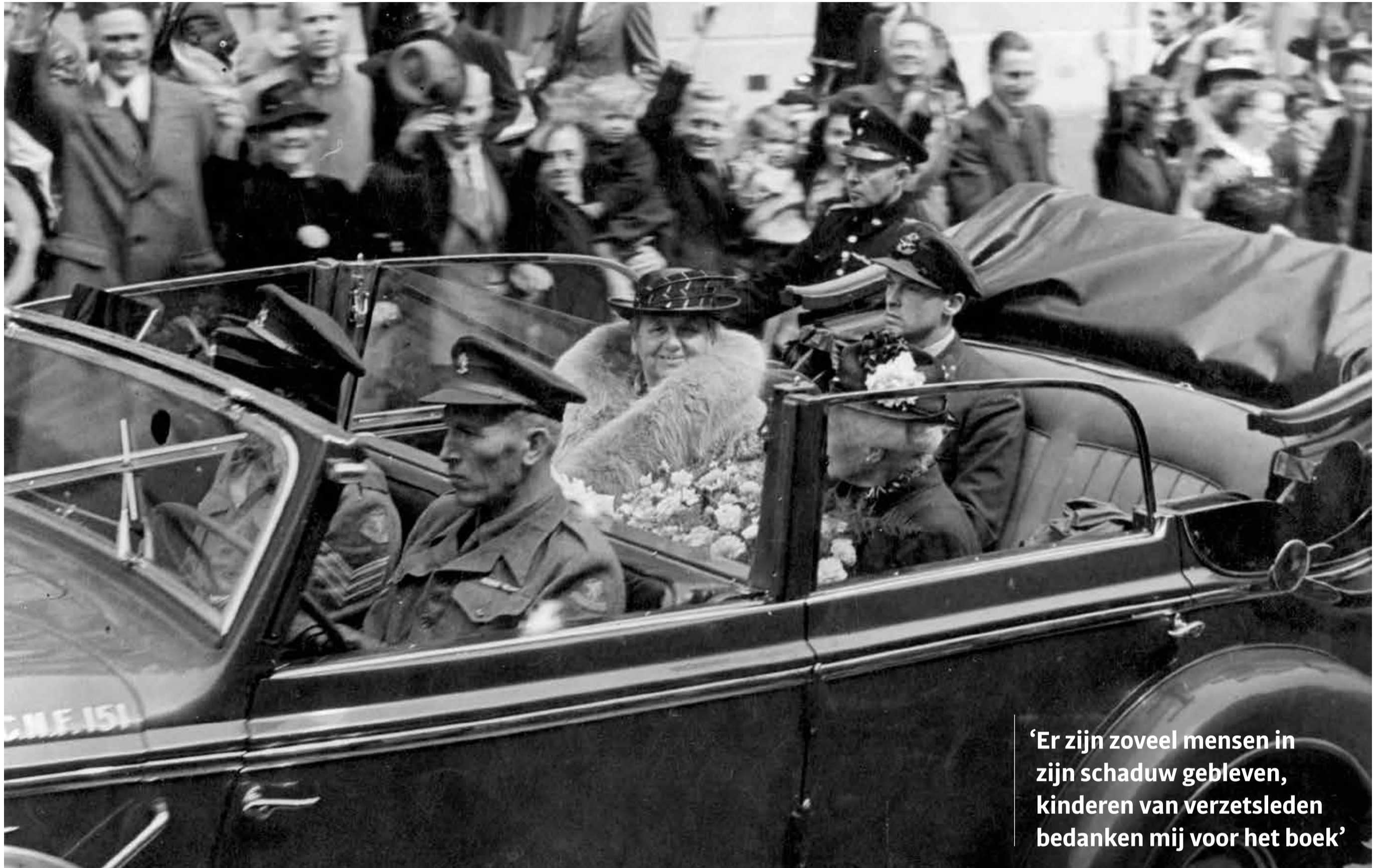
Intocht van koningin Wilhelmina in Den Haag op 6 juli 1945. Erik Hazelhoff Roelfzema zit op de achterbank