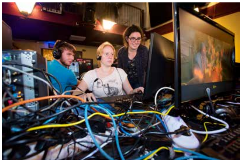
'Het is veel leuker om te vloeken en tieren tegen vrienden.'