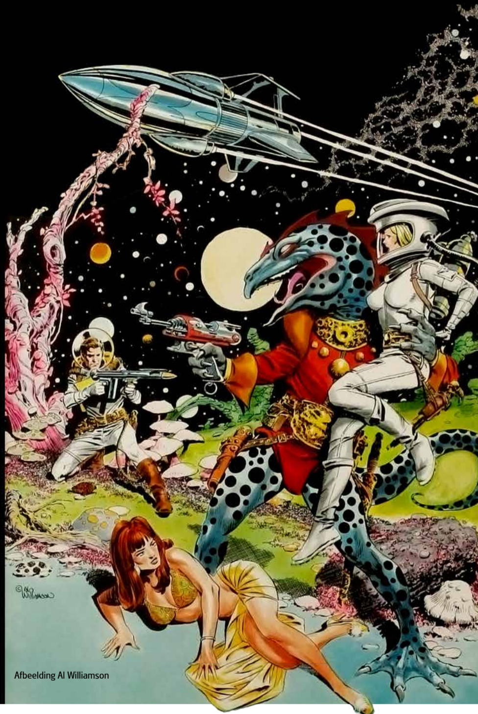
Afbeelding Al Williamson

Vincent Icke, Reisbureau Einstein . Uitgeverij Prometheus, 256 blz. € 19,95