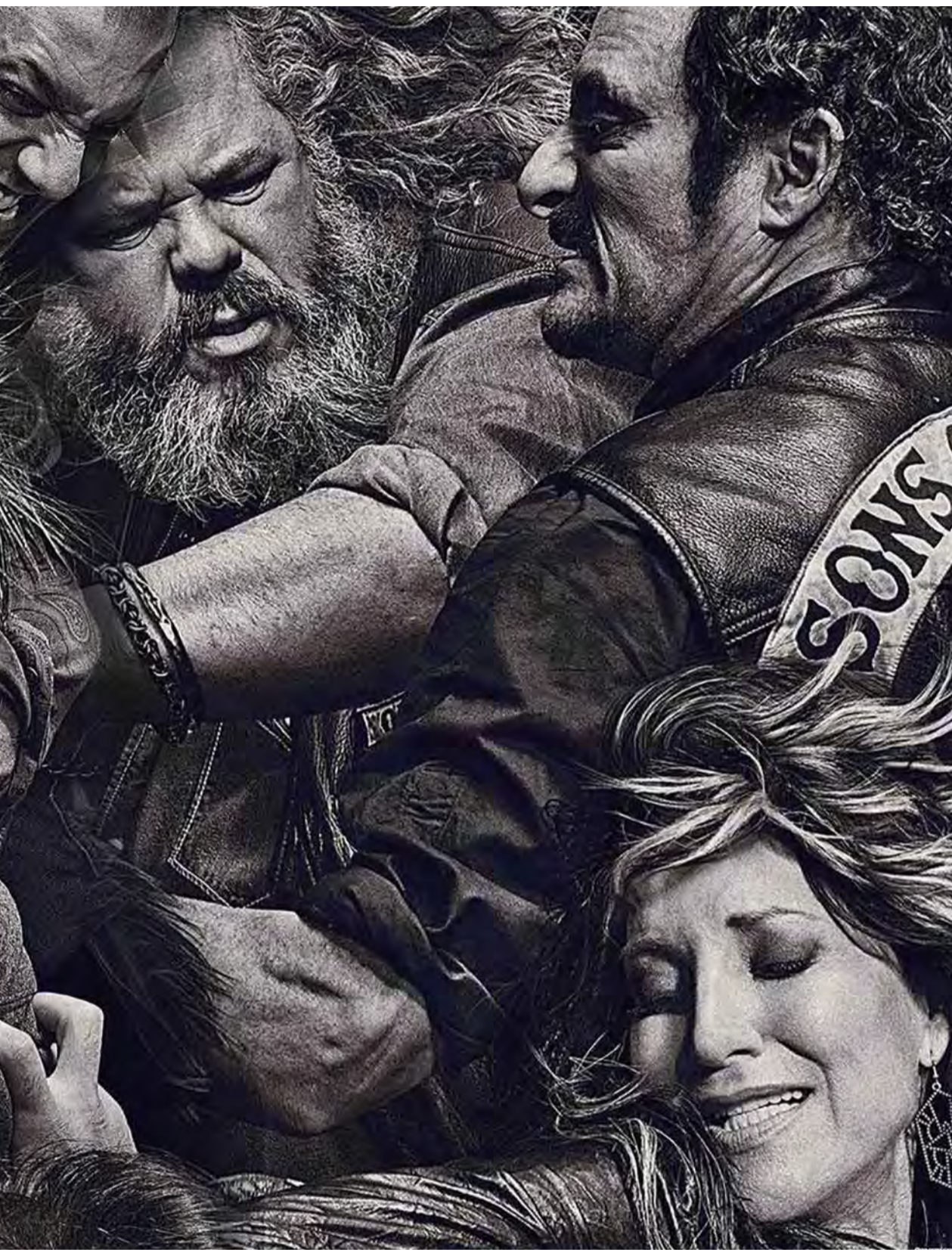
(nooit bekend als Peggy Bundy) won in 2011 een Golden Globe voor haar vertolking van bikerqueen Gemma Teller.