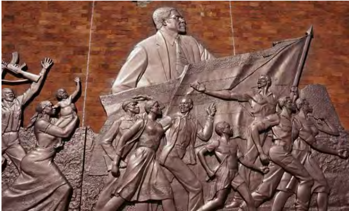
Gebouw in Zimbabwe waarop de onafhankelijkheidsstrijd is afgebeeld, met bovenaan Robert Mugabe.

Dat betaalt zich volgens Van der Hoog nu uit. 'Die landen, inmiddels onafhankelijk, nemen nu grote infrastructurele projecten af, waar-