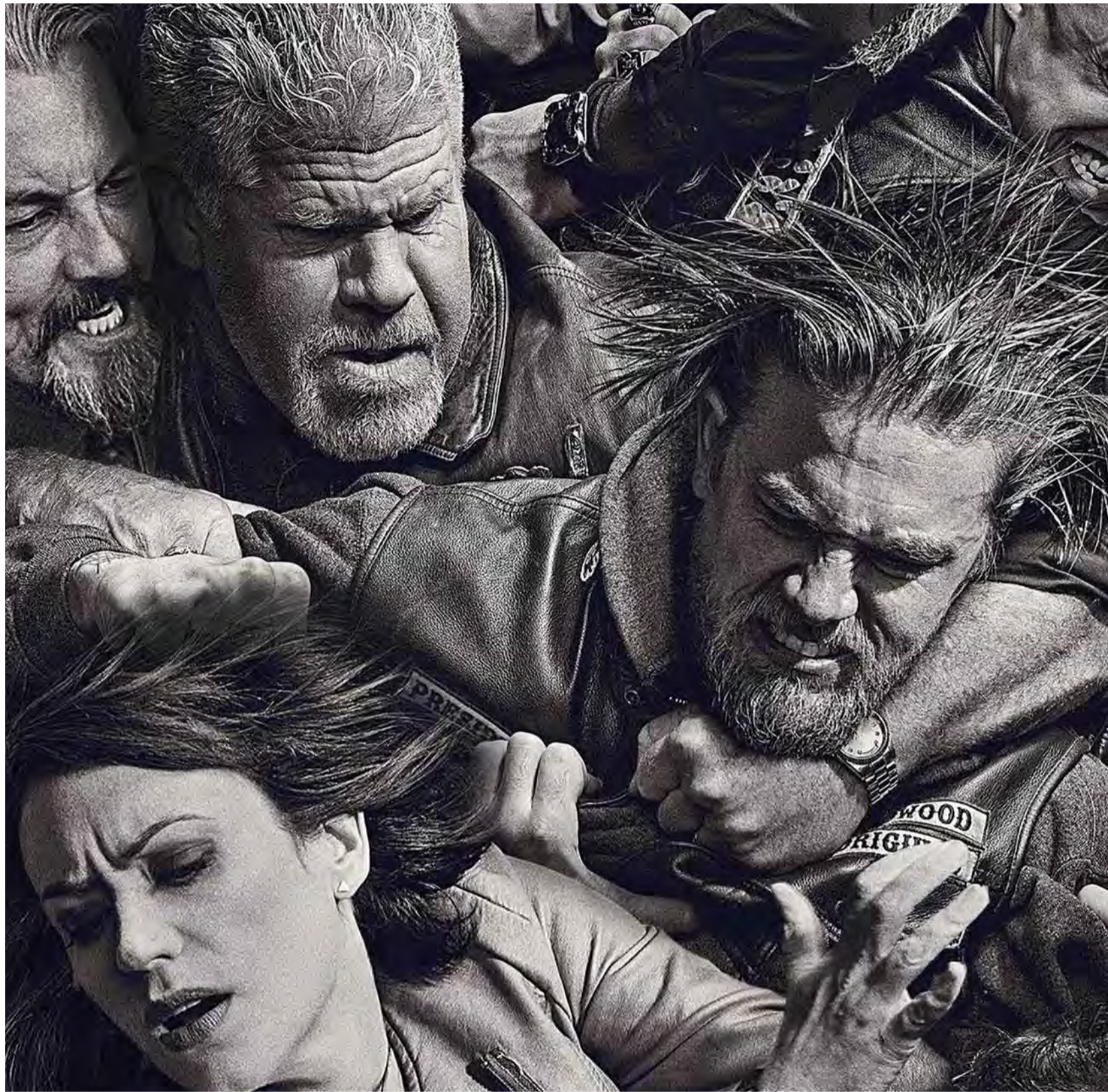
Beeld uit de Amerikaanse motorbendeserie Sons of Anarchy . Actrice Katey Sagal (rechtsonder)

'We weten niet precies hoeveel mensen er lid zijn van een motorclub. We weten ook niet of onze steekproef een vertekening geeft. De mannen kunnen in het politie-