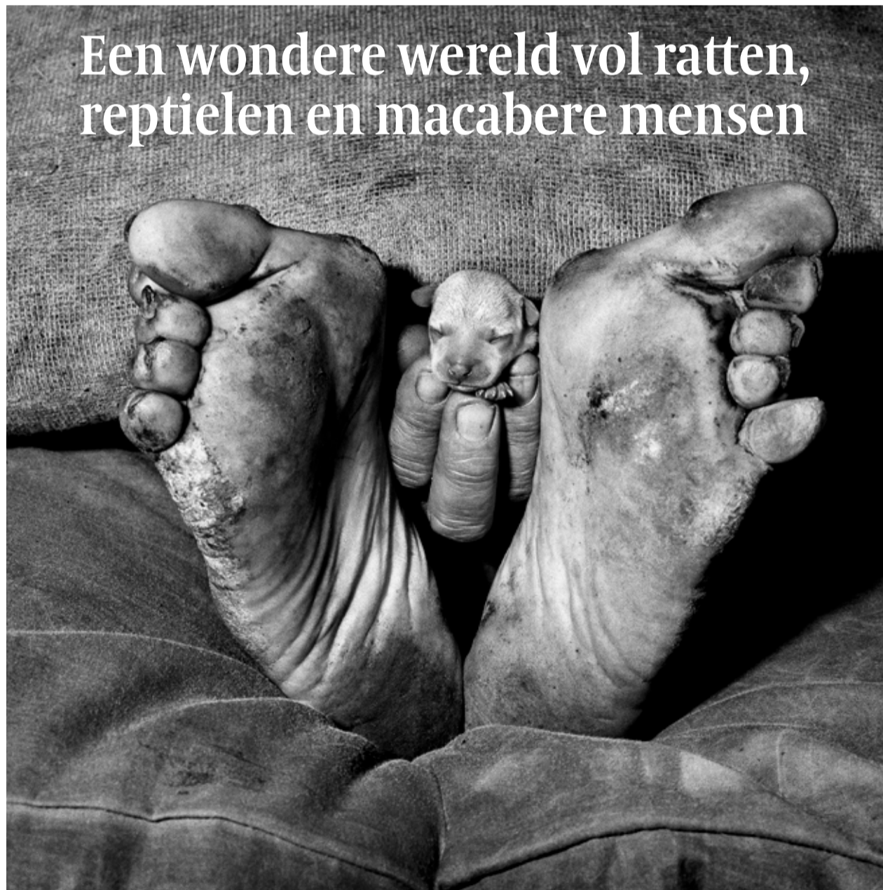
Een wondere wereld vol ratten, reptielen en macabere mensen

Een half-onthoofde vrouwenpasop besmeurd met bloed voor een reeks grillige portrettekeningen of een levenloos poppenlichaam midden in een zaal vol zwart-witfoto’s. In het fotomuseum Den Haag kunnen bezoekers in het hoofd kijken van Roger Ballen. De Amerikaan, die sinds 1982 in Zuid-Afrika woont, begon zijn carrière als ecoloog, vergaarde internationale bekendheid na zijn fotoserie Platteland waarin hij het bittere bestaan van arme