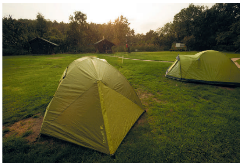
Tenten in de regen op camping Stochemhoeve.

DOOR SUSAN WICHGERS Vorige week ging Mare op bezoek bij studenten die noodgedwongen kamperen op camping Stochemhoeve. Hoe gaat het een week later met hen en de zoektocht naar een kamer?