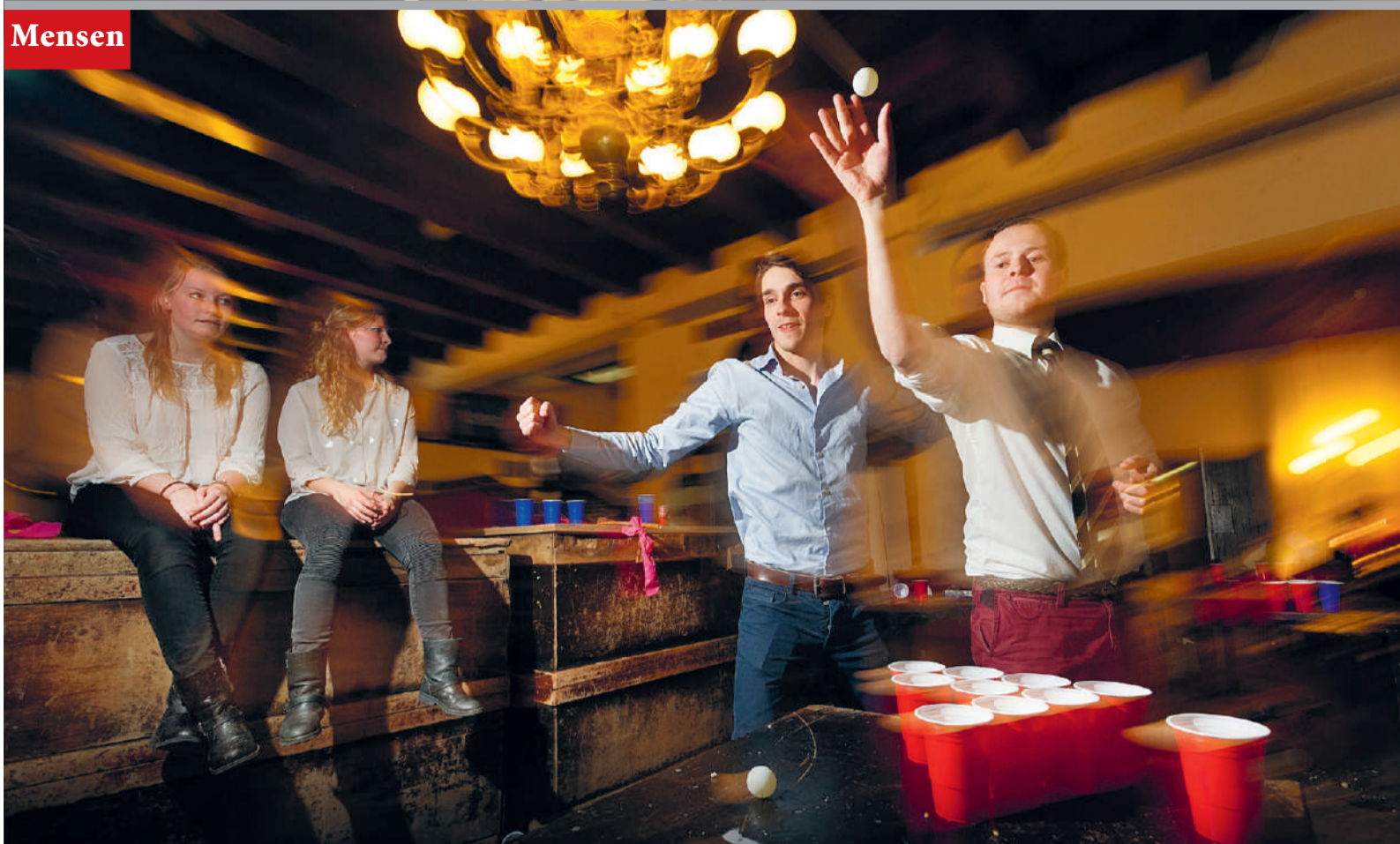
Een onschuldig potje bierpong bij Minerva, in 2015.