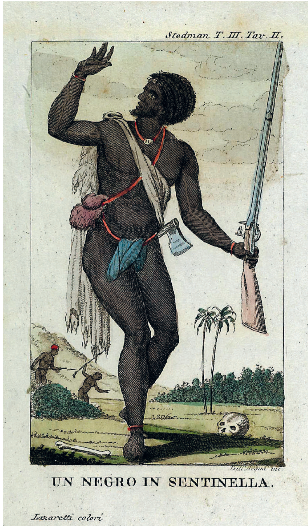
Een opstandeling wordt verrast door twee Redi Musu's. De naam voor deze slaafsoldaten is een verwijzing naar de rode mutsen die ze droegen.

Karwan Fatah-Black , Eigendomsstrijd, de geschiedenis van slavernij en emancipatie in Suriname . Ambo|Anthos, 224 pgs, € 20