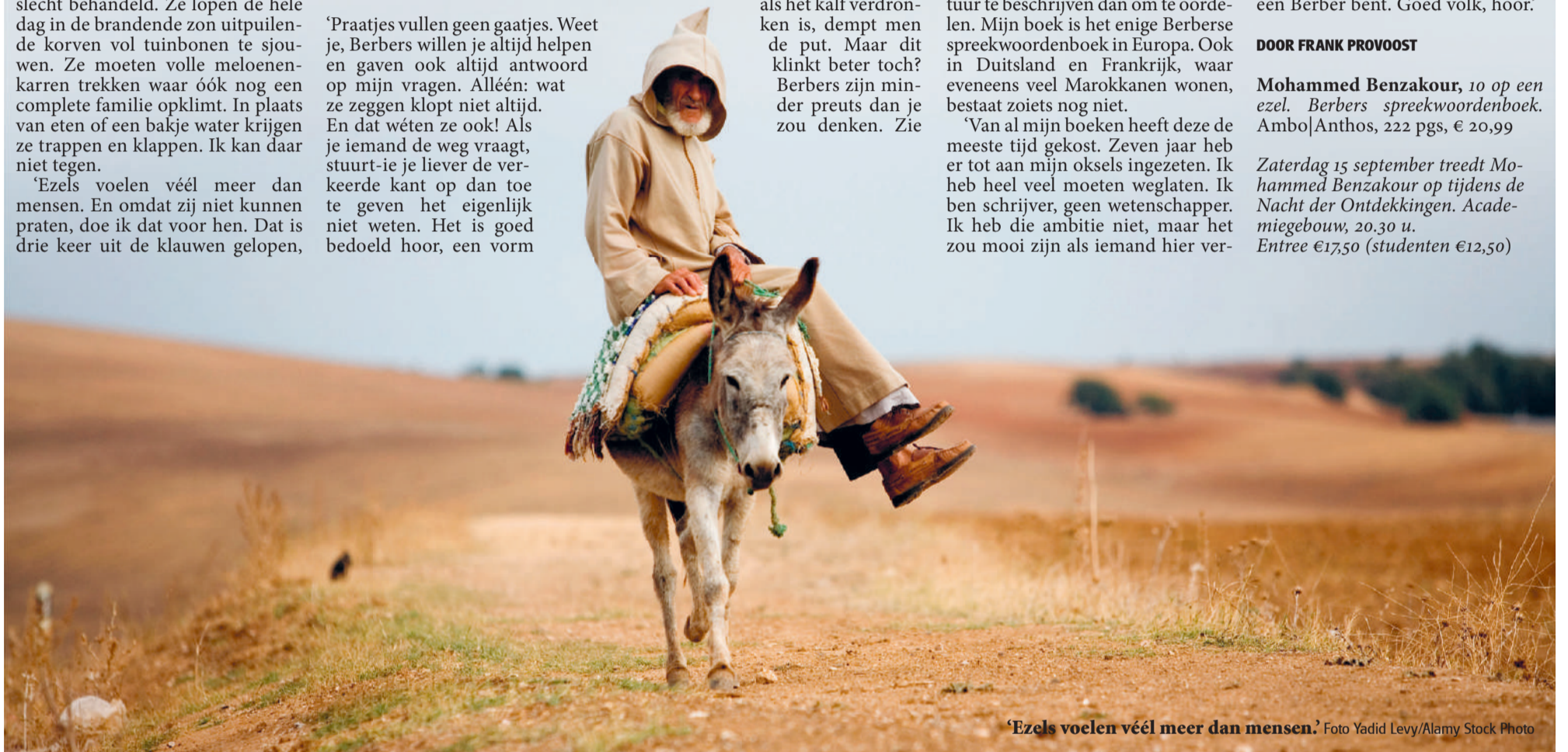
‘Ezels voelen véél meer dan mensen.’

Zaterdag 15 september treedt Mohammed Benzakour op tijdens de Nacht der Ontdekkingen . Academieggebouw , 20.30 u. Entree €17,50 (studenten €12,50)