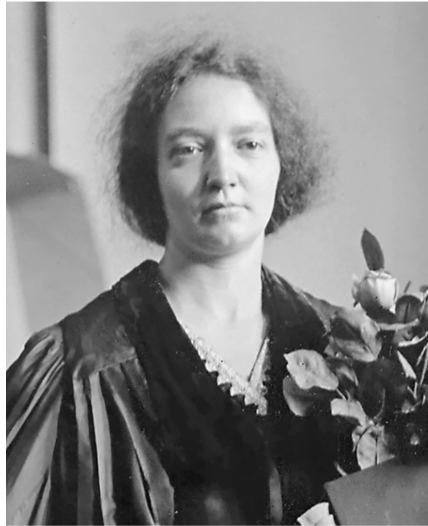
Van links naar recht: Wiskundige Grace Chisholm Young, natuurkundige Hendrika Johanna van Leeuwen en scheikundige Irène Joliot-Curie