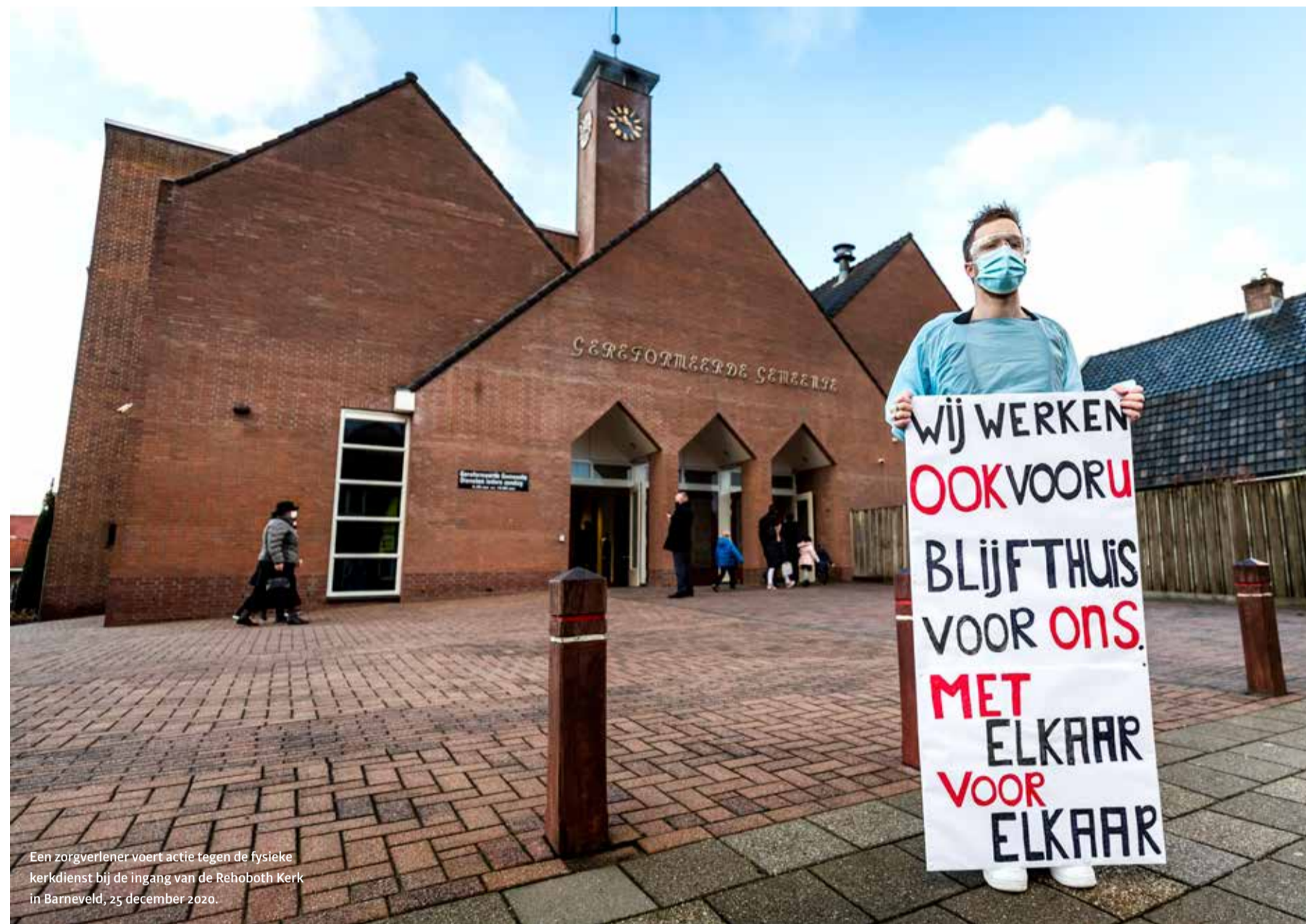
Een zorgverlener voert actie tegen de fysieke kerkdienst bij de ingang van de Rehoboth Kerk in Barneveld, 25 december 2020.