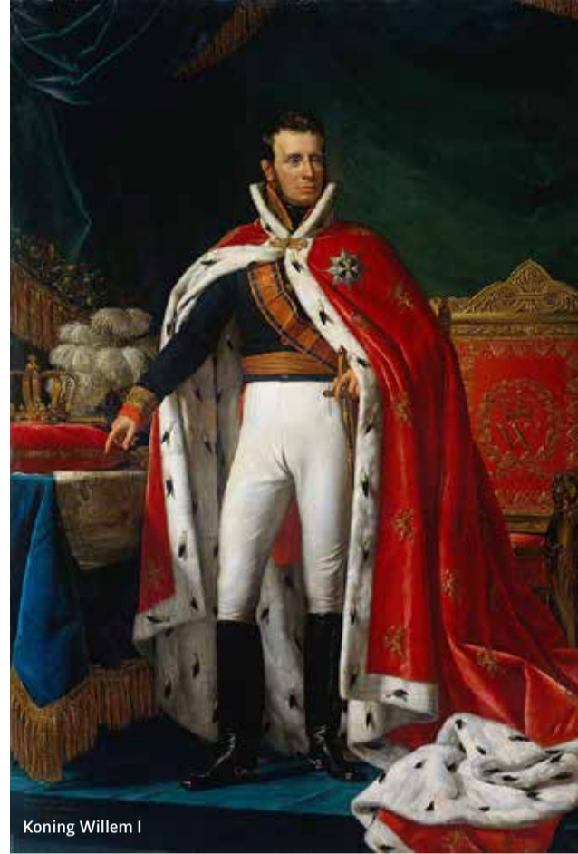
Koning Willem I