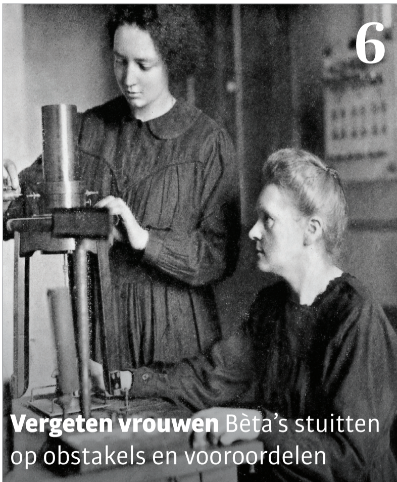
Vergeeten vrouwen Bèta's stuiten op obstakels en vooroordelen