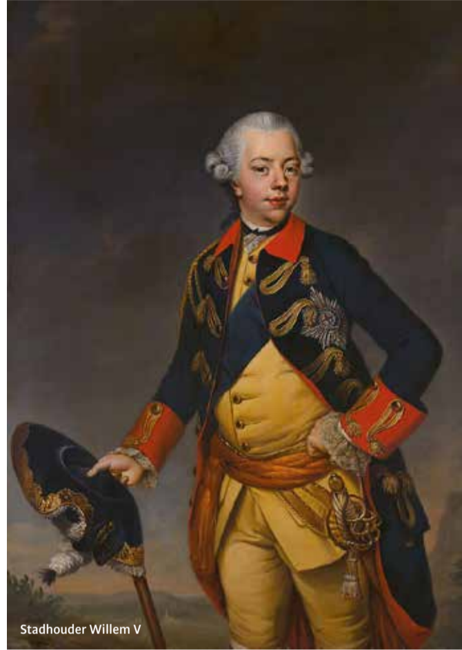
Stadhouder Willem V