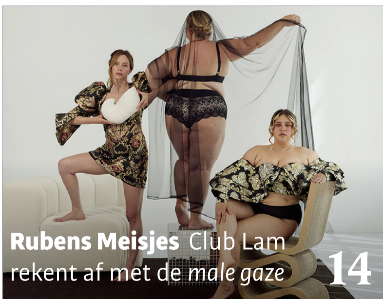
Rubens Meisjes Club Lam rekt af met de male gaze 14