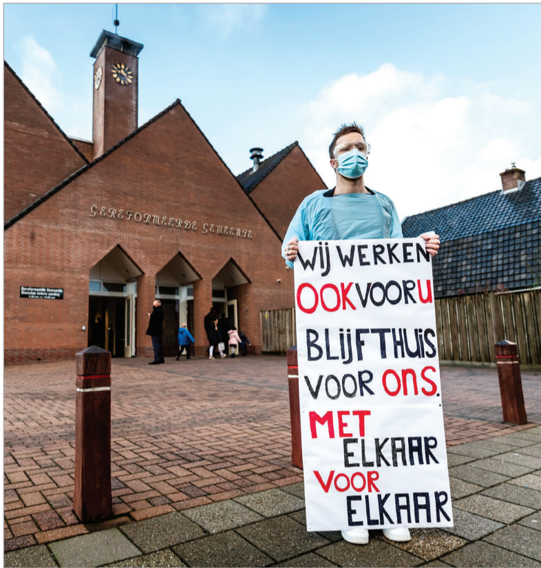
Corona en de kerk 'Het ongenueanceerde beeld van brute figuren die tijdens een pandemie samenkwamen klopt niet' 12