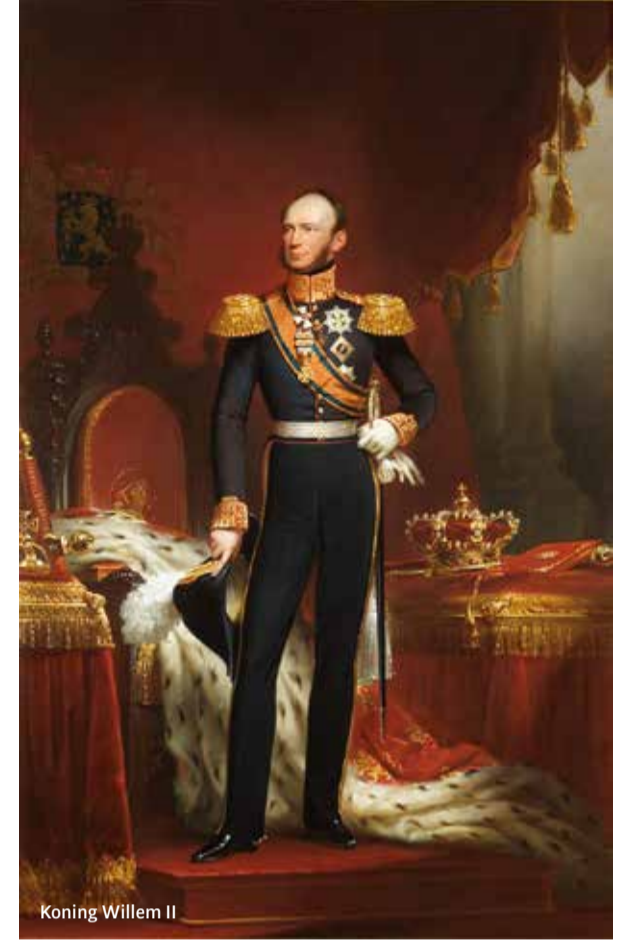
Koning Willem II