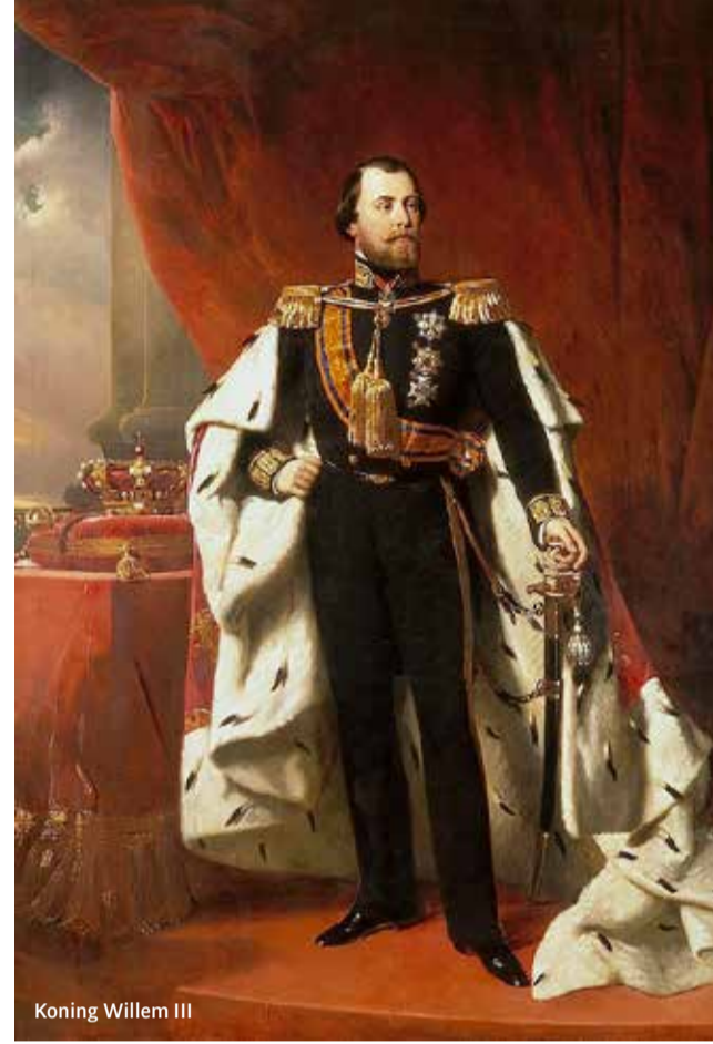
Koning Willem III