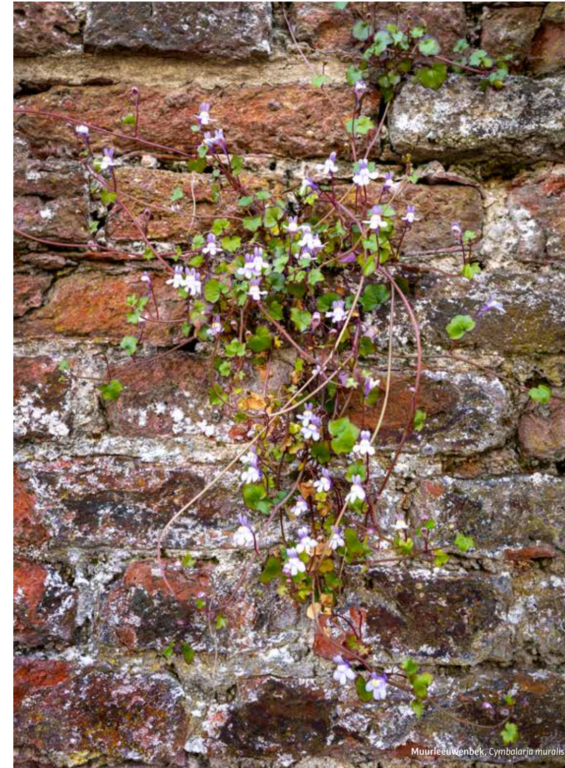
Muurleeuwenbek, Cymbalaria muralis