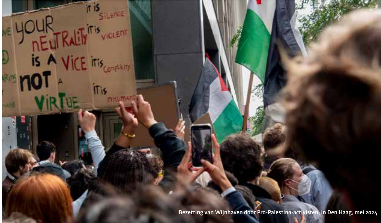
Bezetting van Wijnhaven door Pro-Palestina-activisten, in Den Haag, mei 2024