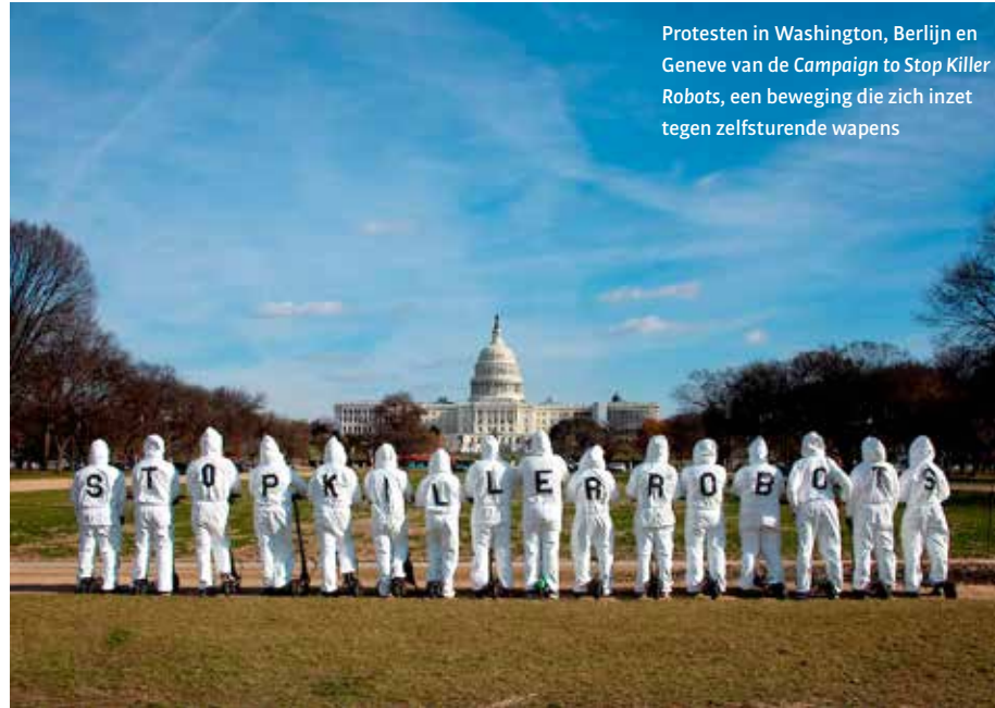
Protesten in Washington, Berlijn en Geneve van de Campaign to Stop Killer Robots, een beweging die zich inzet tegen zelfsturende wapens