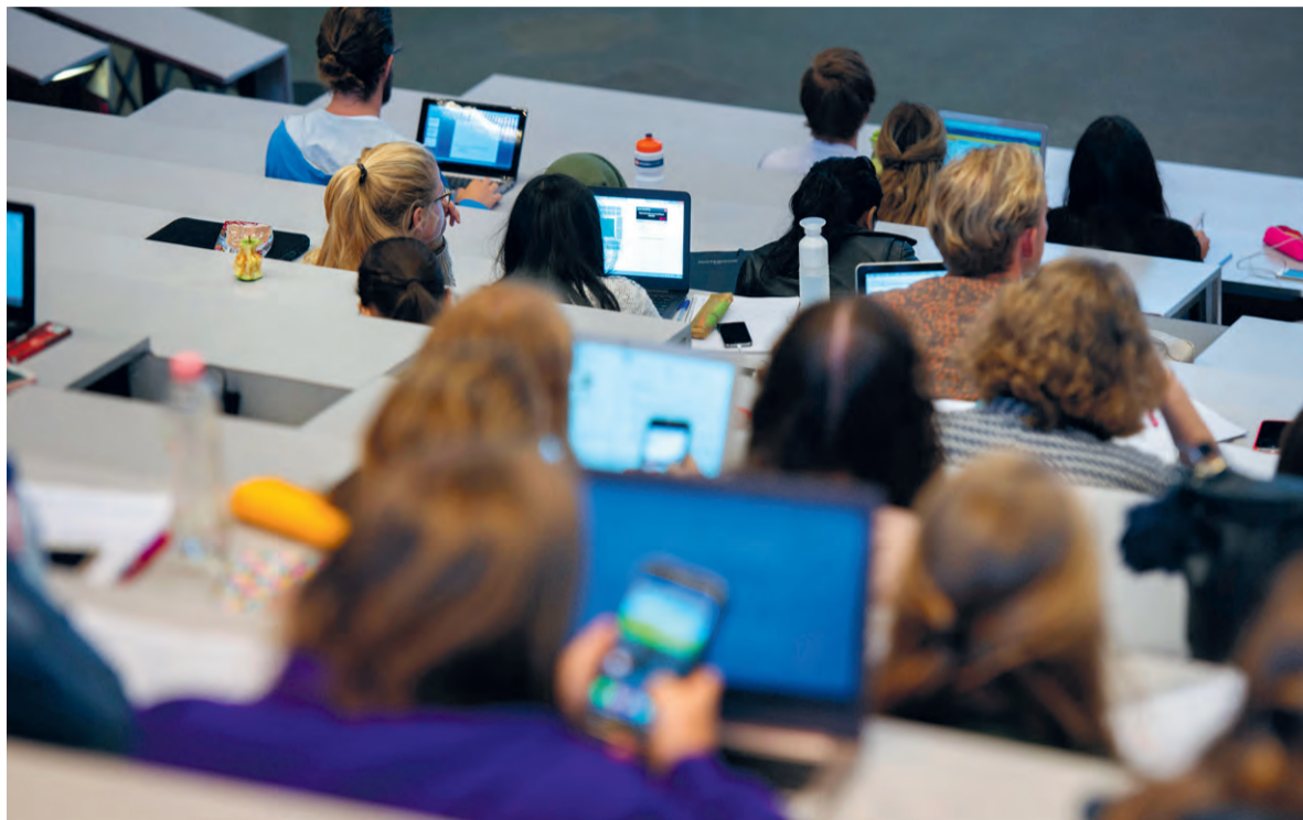
‘They’re not even aware that they shouldn’t do it, and that it’s downright rude.’

At Psychometrics on Tuesday afternoon in the Gorlaeus Building, almost half the benches in the lecture hall have open laptops on them. Party photos and pictures of intricately plaited hairdos pop up and down on Facebook while other people use chat and email services. One student is actually viewing a Leiden University page, but is clearly working on an assignment for another course. Nonetheless, most