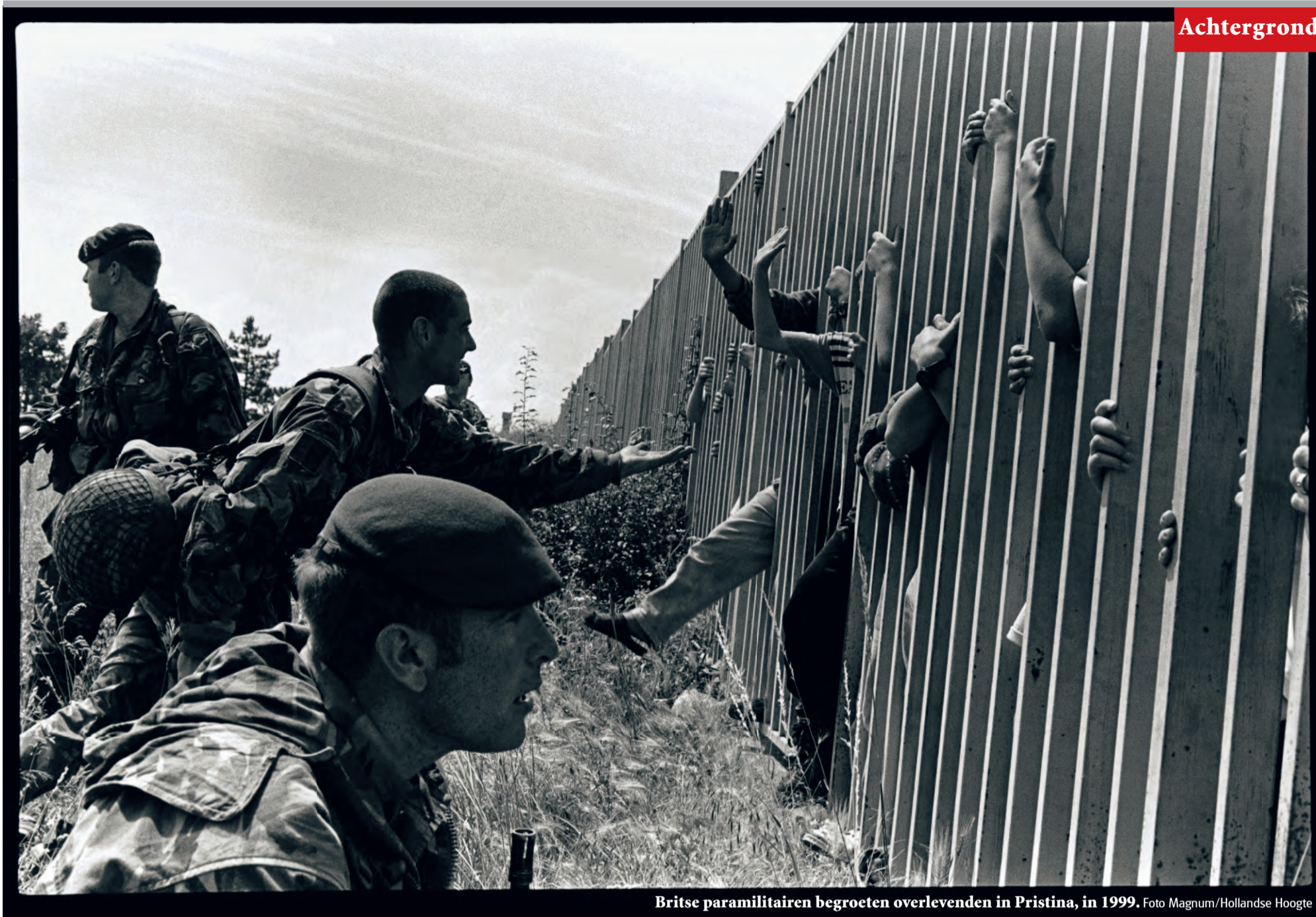
Britse paramilitairen begroeten overlevenden in Pristina, in 1999.