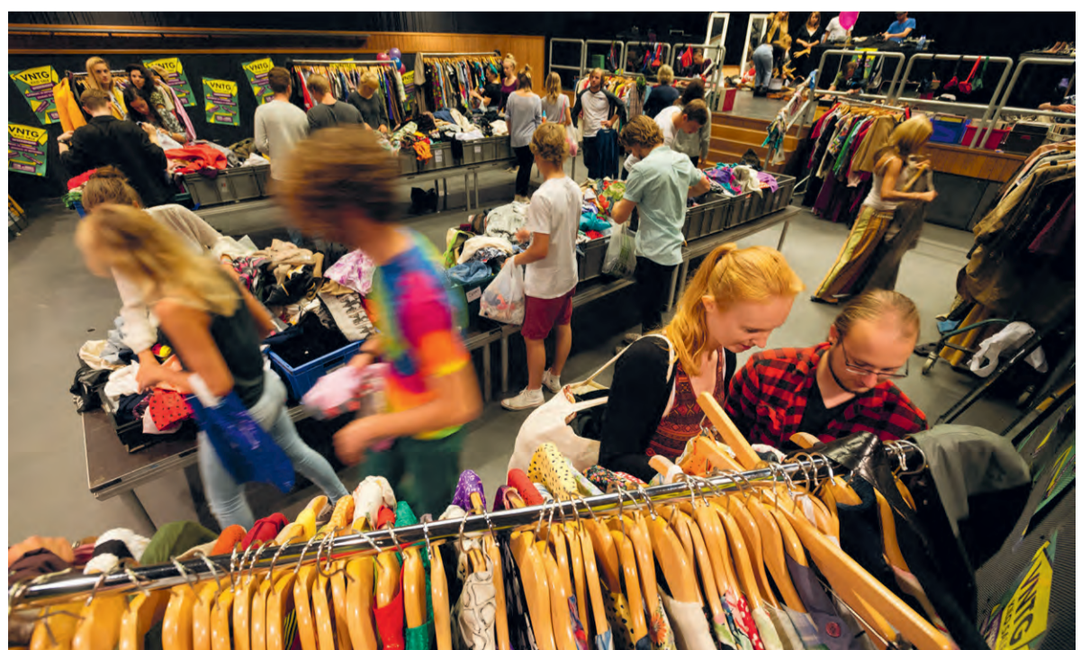
'Wat we overhouden, doneren we; we proberen niets te verspillen.'

'Er wordt zoveel weggegooid. De mode-industrie is de op een na vervuilste industrie ter wereld,' zegt Schrijnen. 'Alleen de olie-industrie is erger'. De student Entrepreneurial Leadership & Innovation begon de winkel, samen met Hoek, als een 'tegenbeweging'. 'Het is zoveel beter voor het milieu om vintage kleding te kopen, maar vaak is het wel