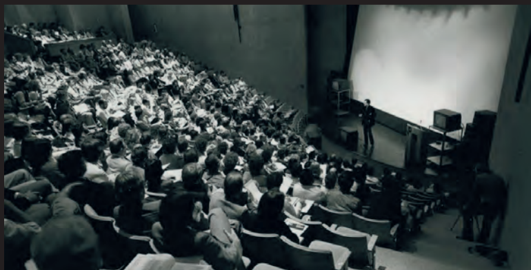
Less is more: research suggests that distractions distract people.

If you get bad marks, there is probably more to the problem than can be solved simply by leaving the computer at home. Do you get good marks with your laptop? Then keep up the good work – unless, of course, the lecturer bans it.