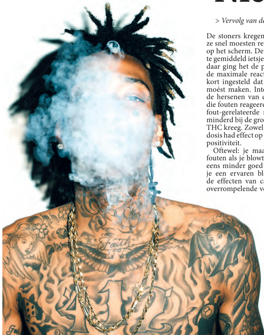
Rapper Wiz Khalifa, op de cover van zijn album Blacc Hollywood (2014). Het wijdverbreide geloof dat je van blowen creatiever wordt, lijkt te zijn ontzenuwd.