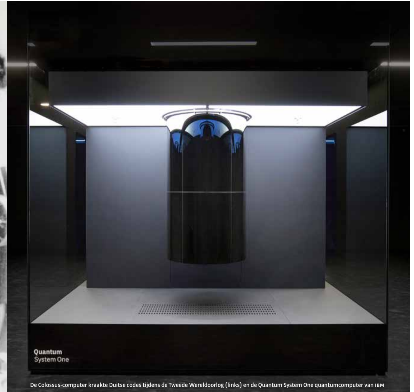
De Colossus-computer kraakte Duitse codes tijdens de Tweede Wereldoorlog (links) en de Quantum System One quantumcomputer van IBM

Hoe veilig is onze digitale infrastructuur als de eerste quantumcomputer straks een feit is? 'Als bedrijven nu de overstap niet maken, zijn we over een aantal jaar heel kwetsbaar voor online aanvallen.'