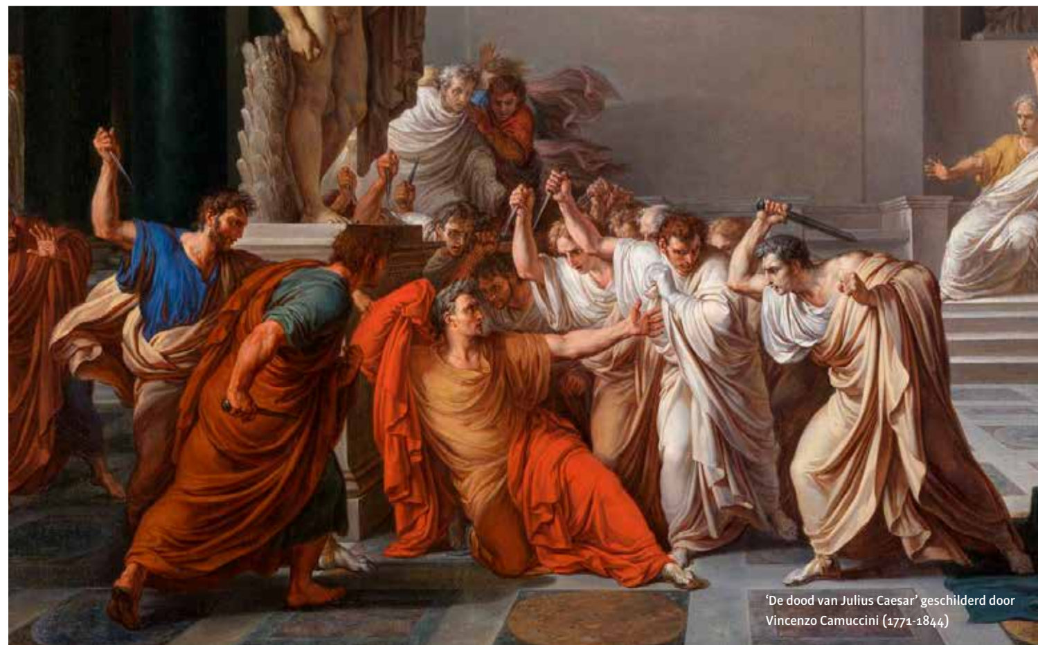
'De dood van Julius Caesar' geschilderd door Vincenzo Camuccini (1771-1844)

De studentenpartijen ONS en DSP lieten desgevraagd aan Mare weten een fusie met LVS helemaal niet te zien zitten.