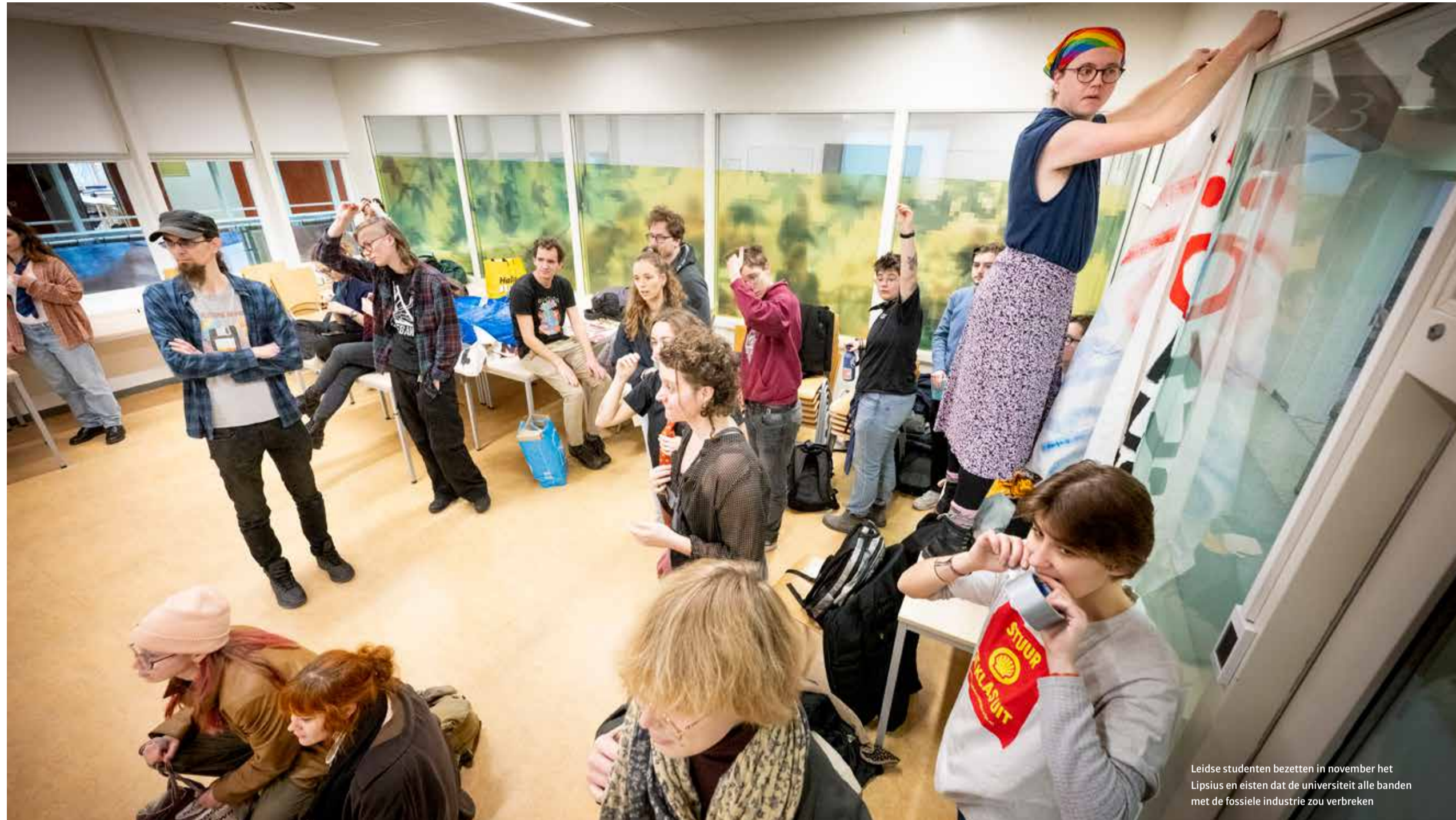
Leidse studenten bezetten in november het Lipsius en eisten dat de universiteit alle banden met de fossiele industrie zou verbreken

Mocht de numerus fixus inderdaad worden ingevoerd, is dat niet per definitie voor altijd. Van der Heijden: 'We blijven flexibel.'