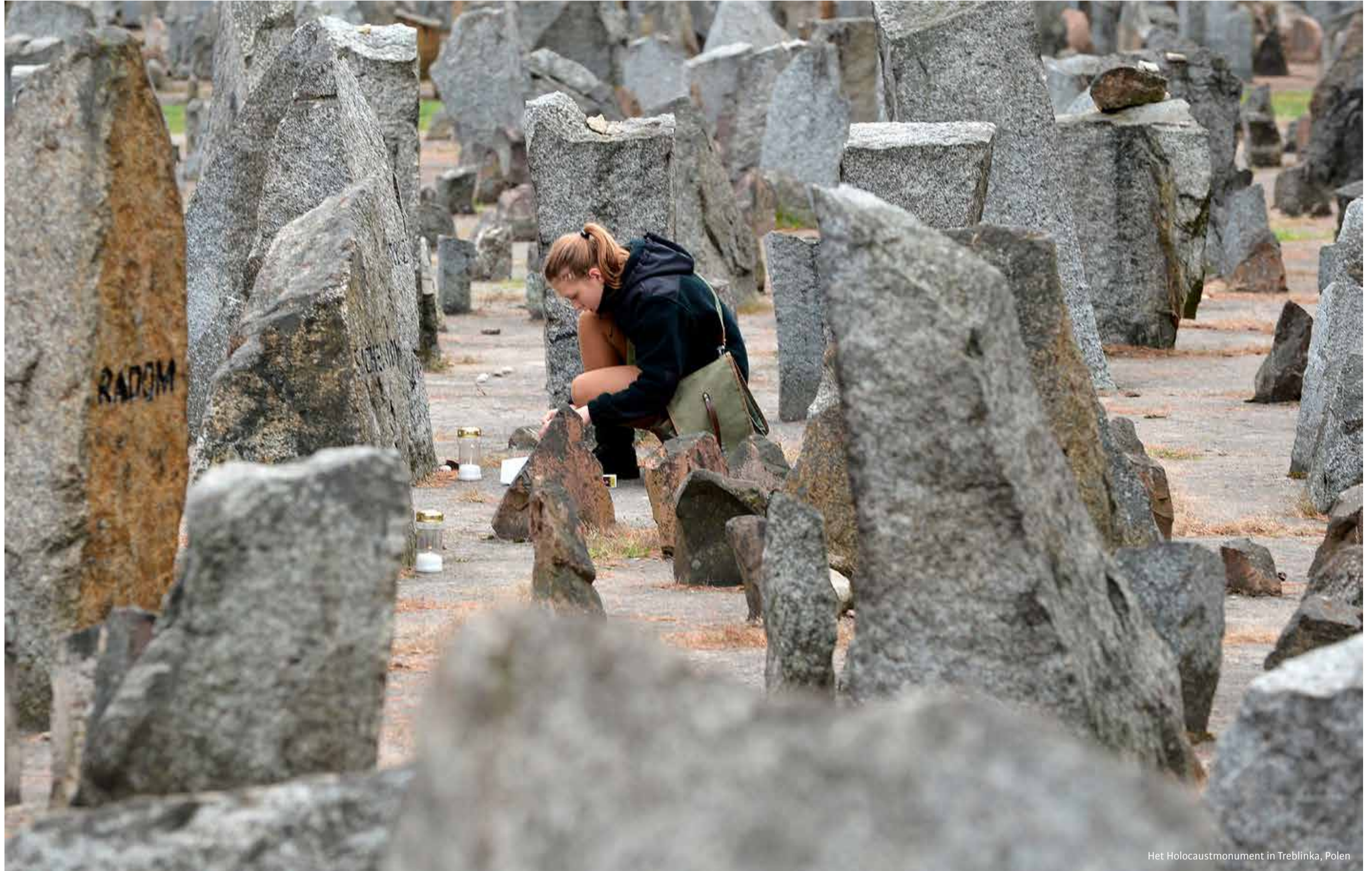
Het Holocaustmonument in Treblinka, Polen

'Soms werden we op grove wijze tegengewerkt. Teamleden zijn beschuldigd van het schenden van de wetenschappelijke integriteit. De dag voor de presentatie stonden we nog in de rechtszaal omdat we ons niet aan de opdracht zouden hebben gehouden en te eenzijdige conclusies zouden hebben getrokken. De rechter ging daar uiteraard niet in mee.