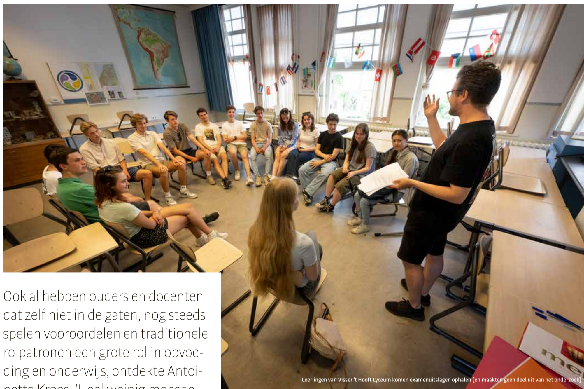
Leerlingen van Visser 't Hoofd Lyceum komen examenuitslagen ophalen (en maakten geen deel uit van het onderzoek)

Ook al hebben ouders en docenten dat zelf niet in de gaten, nog steeds spelen vooroordelen en traditionele rolpatronen een grote rol in opvoeding en onderwijs, ontdekte Antoinette Kroes. 'Heel weinig mensen maken expres onderscheid, maar onbewust gebeurt het wel.'