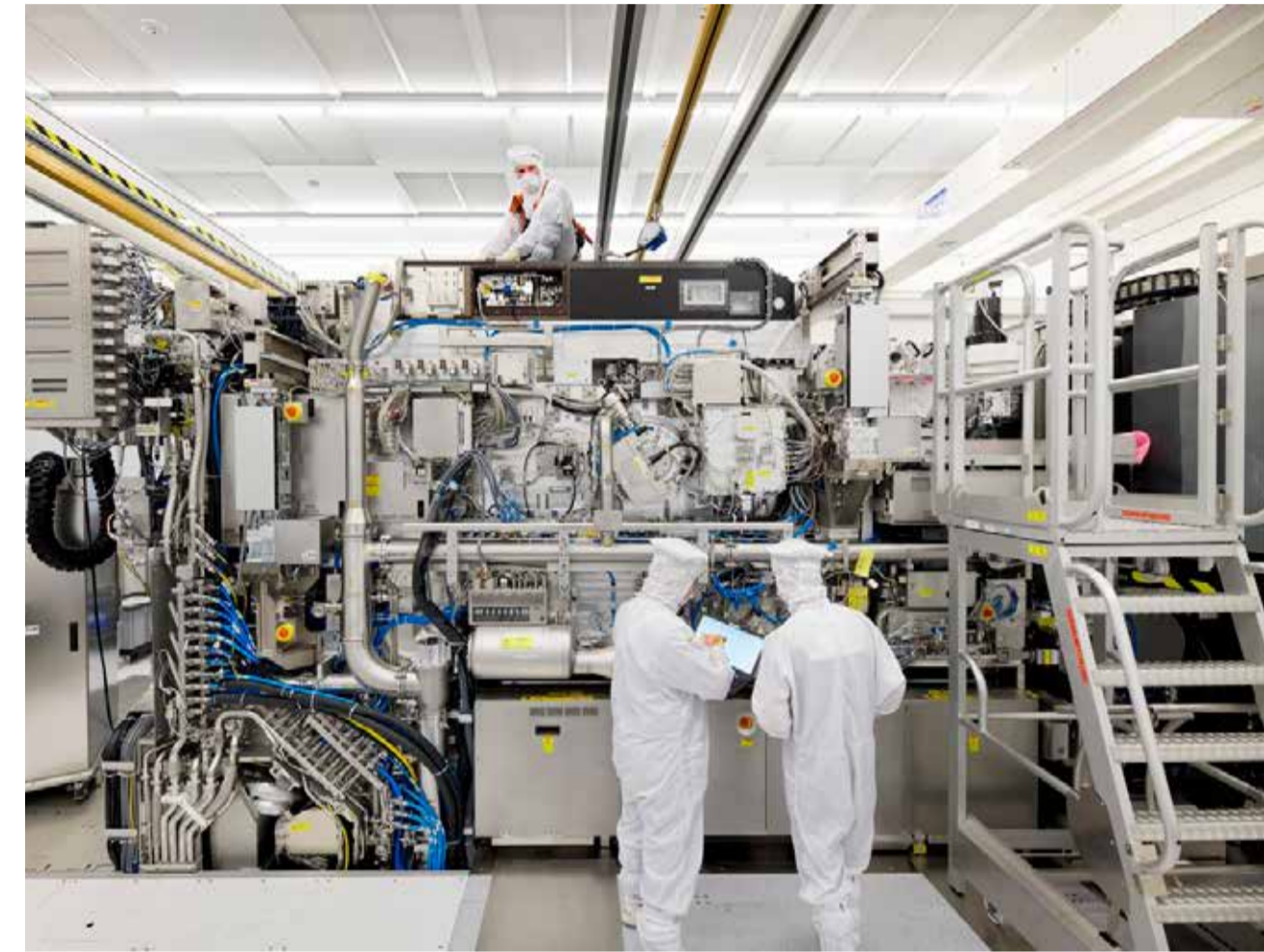
Is het toeval dat chipfabrikant ASML - onder zware druk van de Amerikaanse overheid - voor dezelfde landen exportbeperkingen kreeg opgelegd?