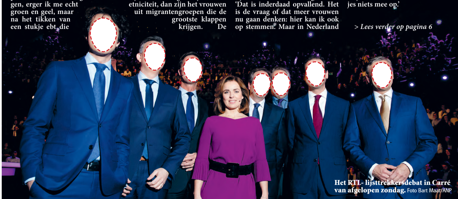
Het RTL-lijsttrekkersdebat in Carré van afgelopen zondag.

Het bestuur van Quintus is deze week op vakantie en was niet bereikbaar voor commentaar.