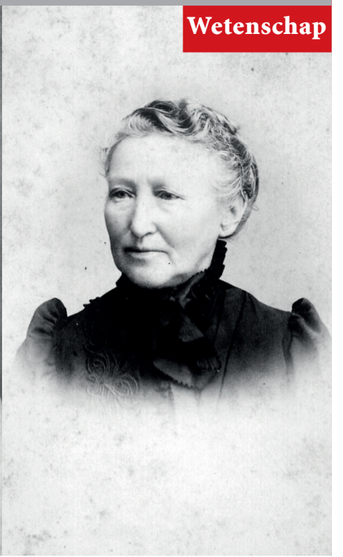
Mary Lua Adelia Davis Treat,