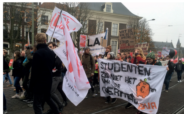
'Leiden is niet echt een activistische stad.'

alle studenten, niets in. 'Ja, ik weet dat je lang mag doen over het terugbetalen. Maar het blijft wel een schuld.'