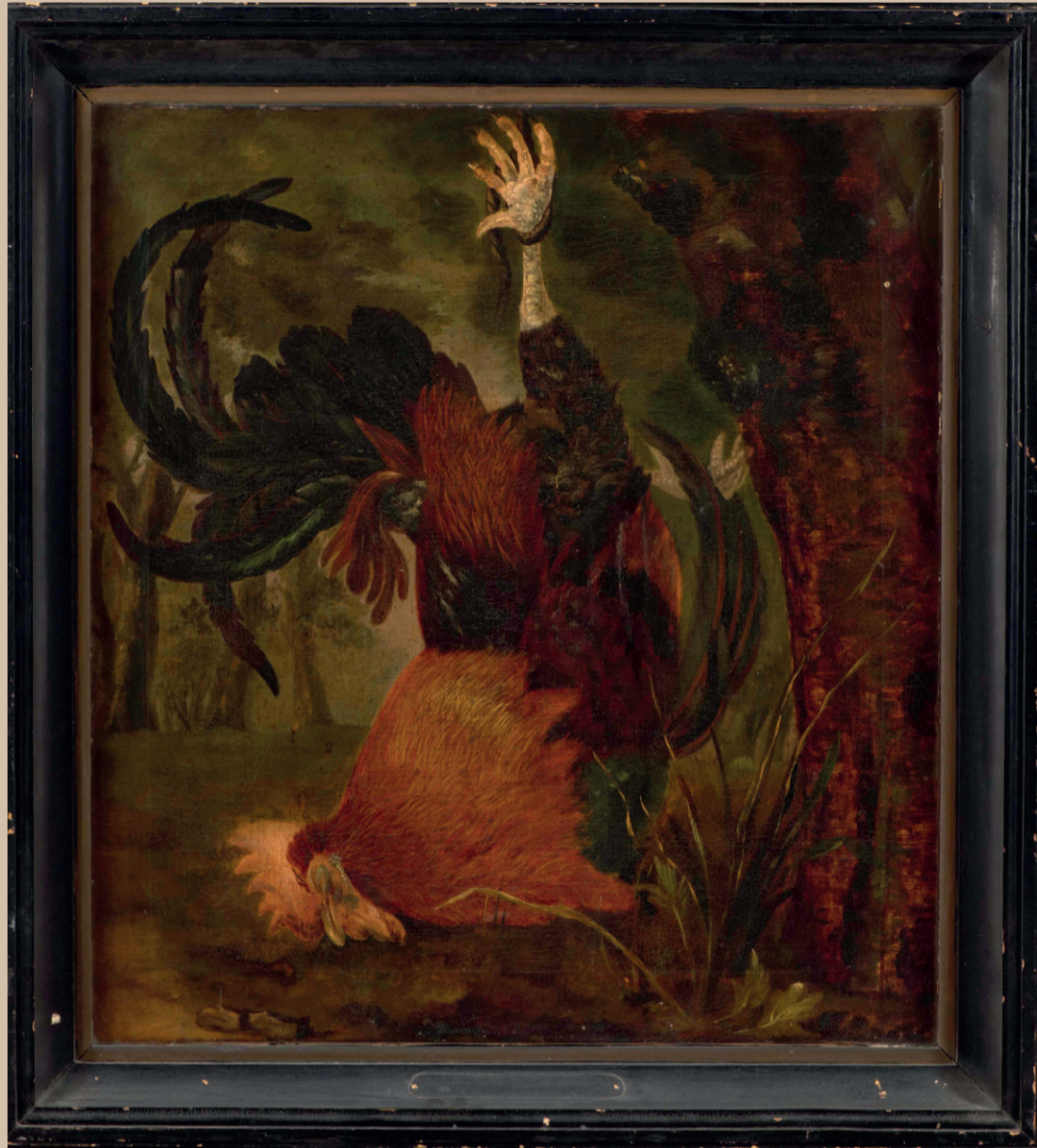
Stilleven van een dode haan , ca. 1700, maker: Anoniem.