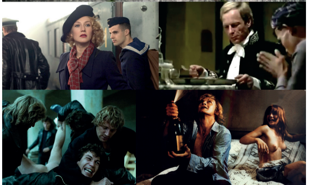
Boven: Gerard Soeteman kreeg in 2017 zijn tweede Gouden Kalf. Filmstills met de klok mee: Zwartboek (2006), Max Havelaar (1976), Turks Fruit (1973) en Spetters (1980).

vucht is dat ding door het luchtdrukverschil ontploft: al onze mooie kleren onder die troep. Dus als ik denk aan die Oscar dan zie ik die geëxplodeerde fles voor me.'