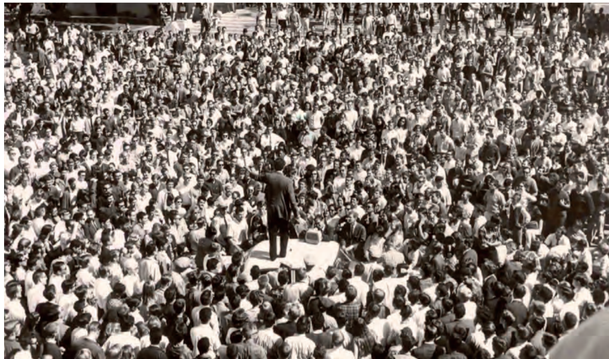
Studentenprotest (de zogeheten Free Speech Movement) aan UC Berkeley, 1964.

Want neutraal blijven is een illusie, betoogt criminoloog uit Berkeley