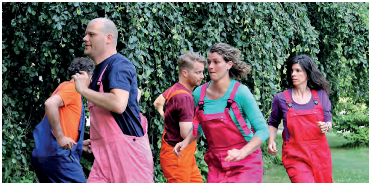
Volksverhalen en sprookjes, onderbroken door moppen of een kabouterquiz.

Spookhazen & ander gespuis biedt een mooie kans om de begraafplaats eens in de schemering te bezoeken. De graven en ook de reusachtige beukenboom langs het grindpad