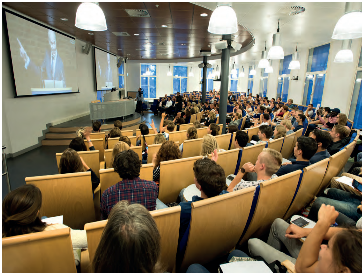
Studenten van de nieuwe opleiding security studies volgen vanuit een Haagse collegezaal de opening van het academisch jaar.

De Gratama-Wetenschapsprijs werd uitgereikt aan arabist Ahmad Al-Jallad, voor zijn onderzoek naar het pre-islamitische Arabië.