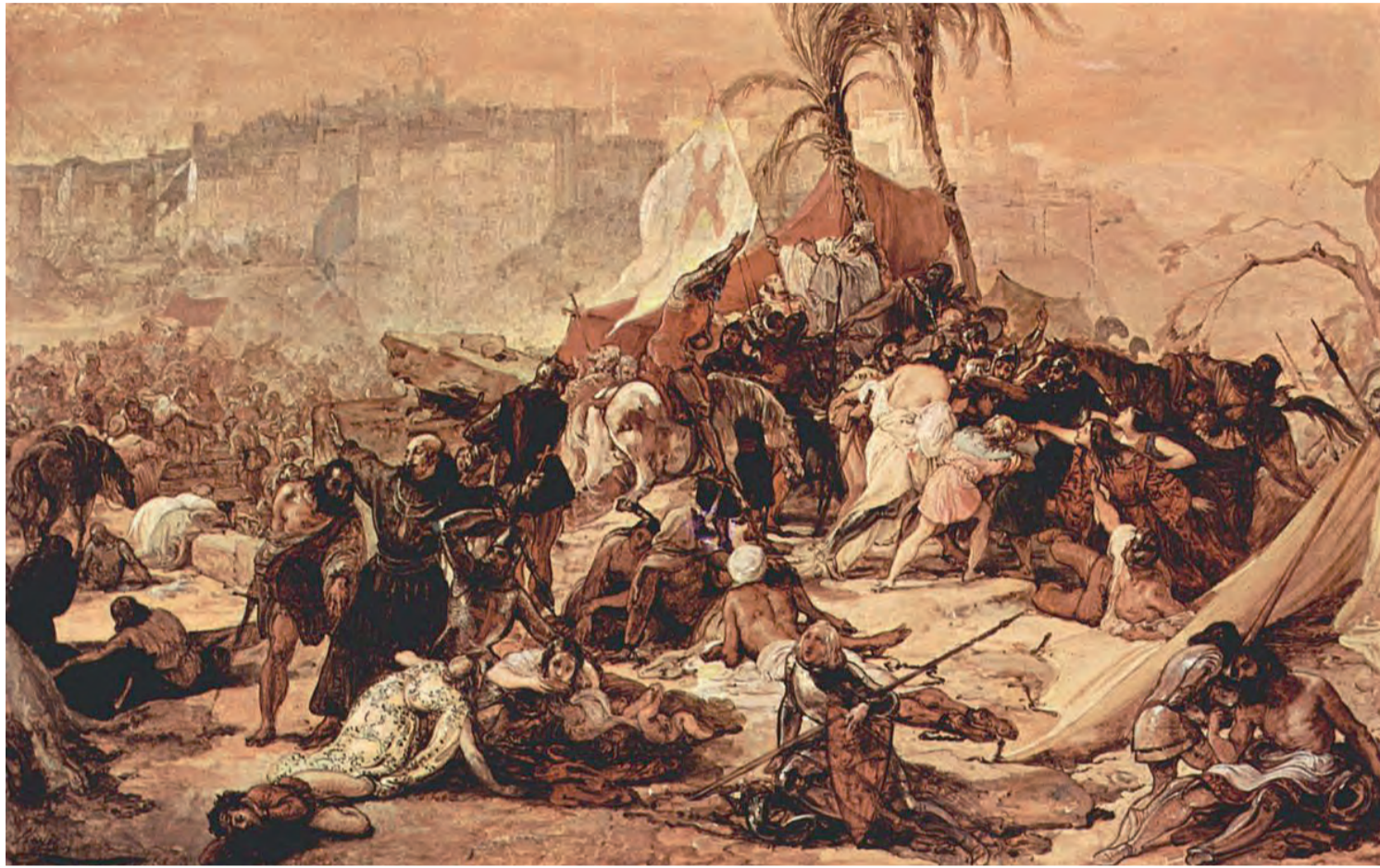
De zevende kruistocht tegen Jeruzalem, geschilderd door Francesco Hayez (1791–1882).

Als dit het hele verhaal zou zijn, als Duisenberg als persoon het enige probleem was, dan hadden we eenvoudigweg te maken met één bestuurder en één legitimatieprobleem. Dat probleem is er aantoonbaar: de studentenraad van de UvA riep haar universiteit op om uit de VSNU te stappen als Duisenberg voorzitter wordt. Een petitie die om het aftreden van Duisenberg vraagt, was bij het ter