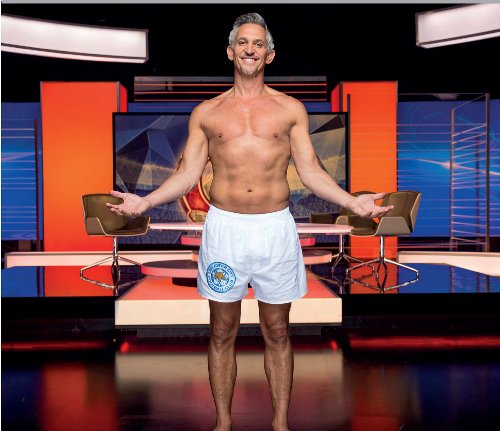
Oud-voetballer Gary Lineker beloofde vorig jaar Match of the Day in zijn onderbroek te presenteren als Leicester City kampioen werd. Hoewel voetbalcommentatoren volgens stijlgidsen geen correct Engels zouden spreken, blijkt het publiek er geen moeite mee te hebben.