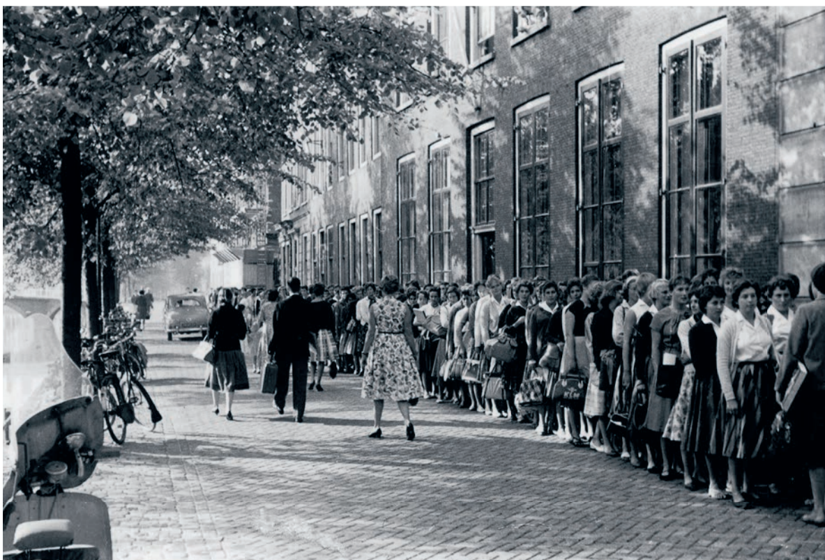
Aspirant VVSL-leden melden zich aan, augustus 1959. Foto's uit besproken boek