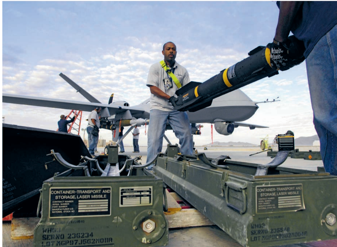
In Afghanistan wordt een Amerikaanse drone bewapend met Hellfire-raketten.

Wat hem betreft, zou er zeker bij dodelijke operaties altijd ergens in de