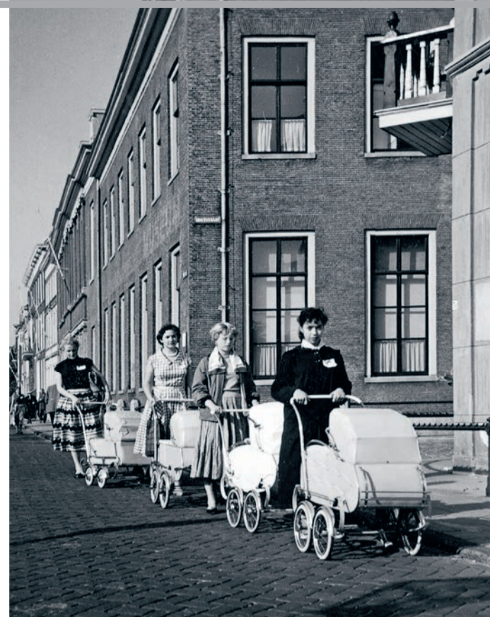
Eerstejaars van VVSL in 1955. Links tijdens de zogeheten 'novietenrevue' in de Leidse Schouwburg; rechts bij de verplichte optocht over het Rapenburg met geleende kinderwagens.