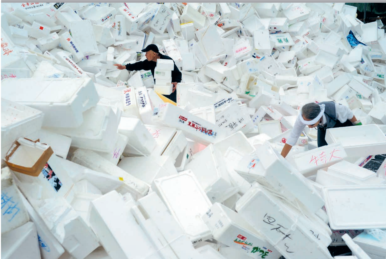
Werknemers van de grootste vismarkt ter wereld, in Tsukiji, sorteren de piepschuimen bakken voor recycling.