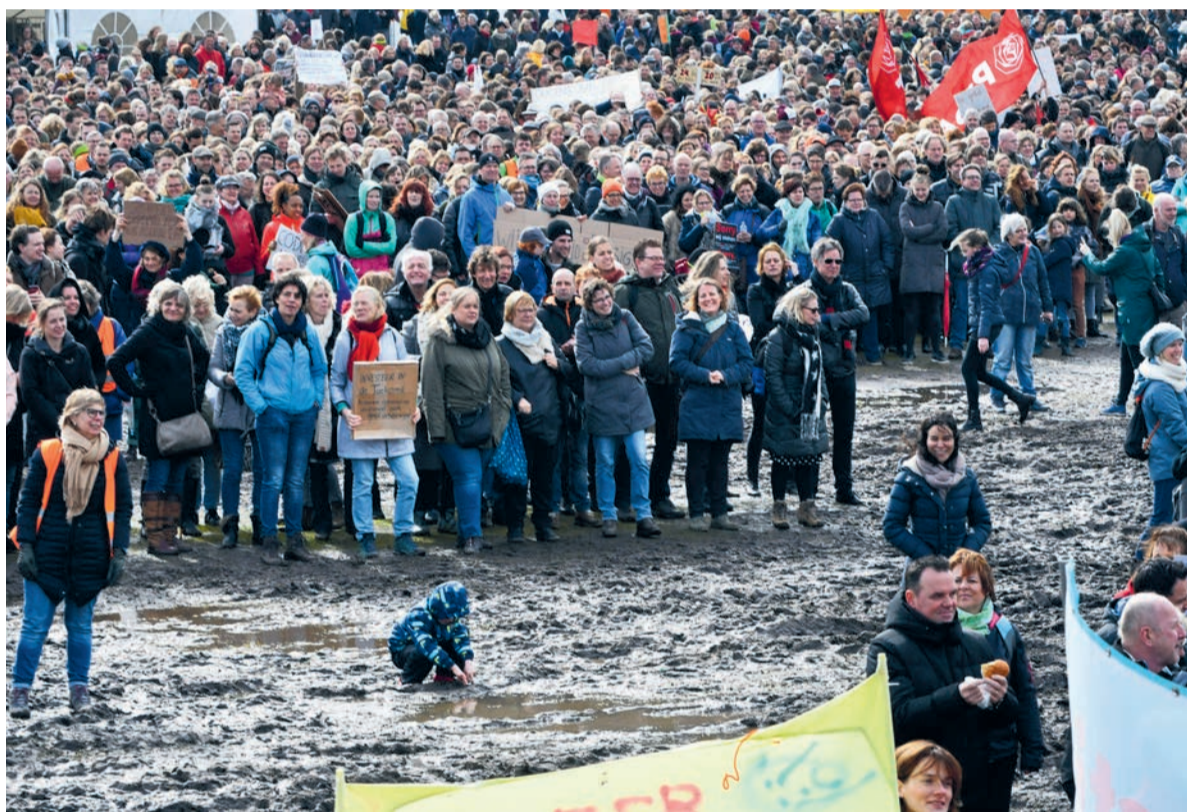
'Het is fijn dat het vandaag zo vol is, maar het is erg dat het moet.'

Ook vertelt de brief van LVS bijvoorbeeld niet hoeveel mensen ze hebben gesproken. 'Het doel is prima, ga vooral zo door. Maar onderbouw het wel goed.'