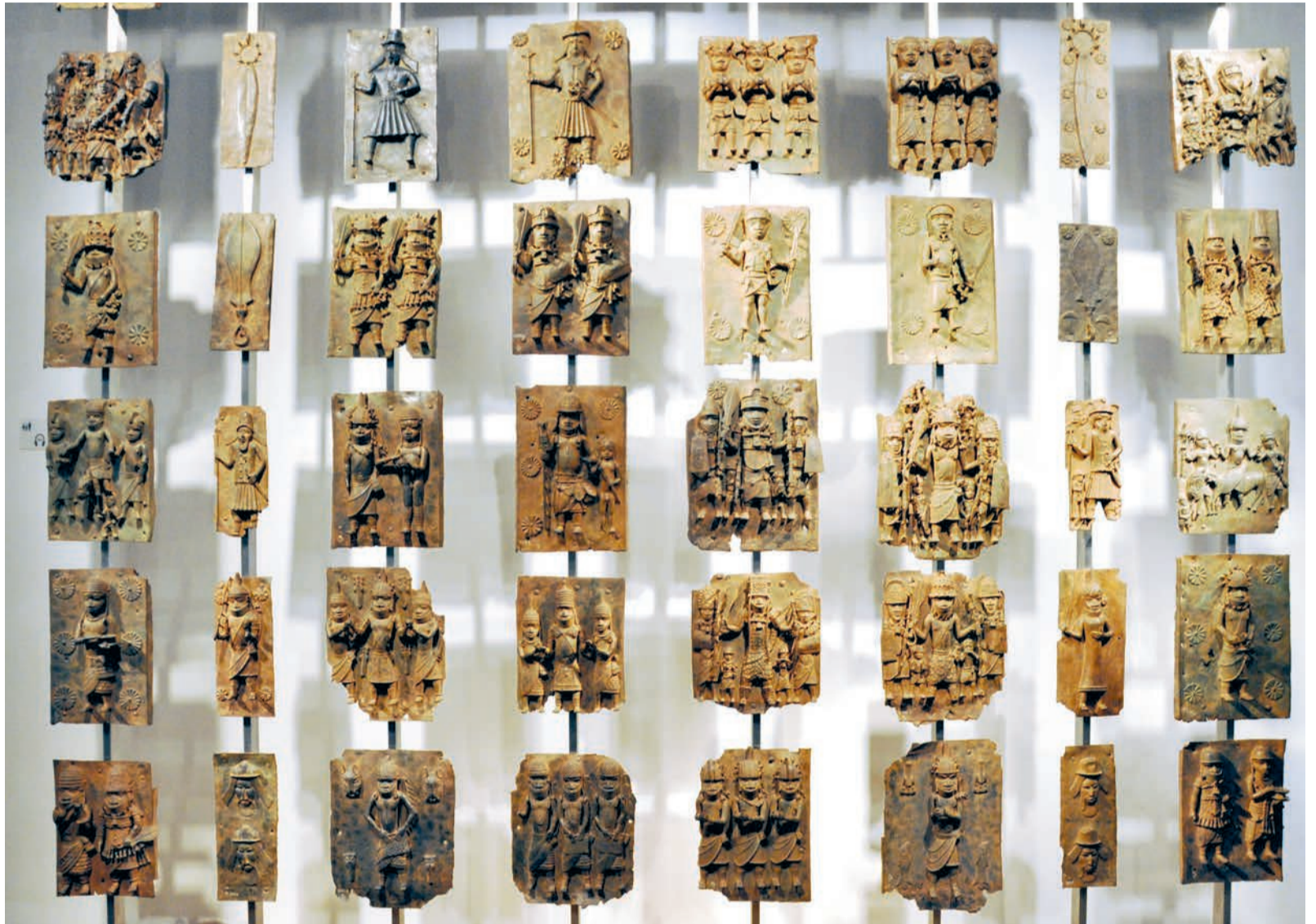
Brass plaques from Benin, displayed in the British Museum.

Ghanaian King Badu Bonsu II had to wait a long time for his funeral. He was hung by the Dutch occupying forces in 1838 for killing two Dutch envoys and dangling their heads on