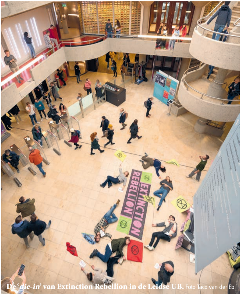
De 'die-in' van Extinction Rebellion in de Leidse UB.