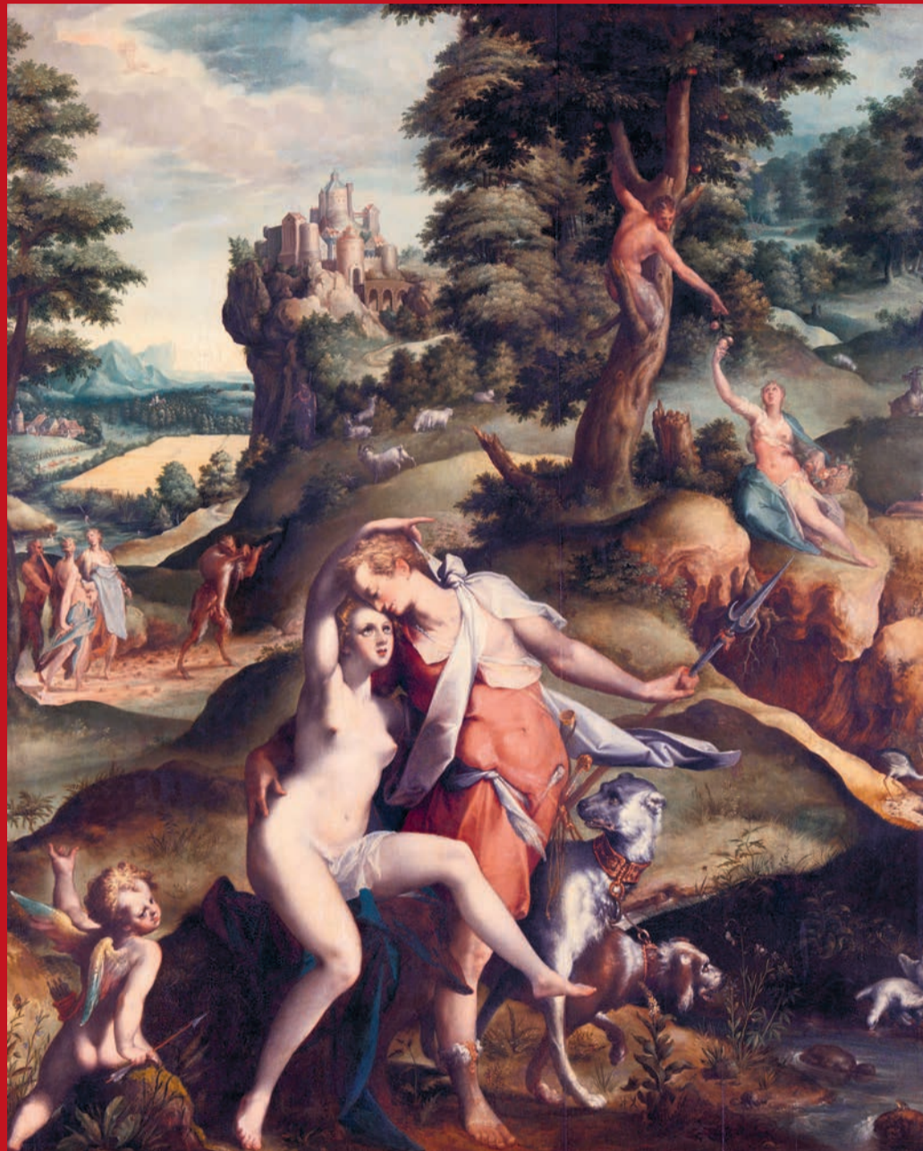
Bartholomeus Spranger, Venus en Adonis, ca. 1585-ca. 1590, olieverf op paneel.

'De jongens hadden er meteen al vertrouwen in, ik niet zo. We hebben dit jaar allemaal onze studie even gepauzeerd. Uiteindelijk willen we wel afstuderen, maar de prioriteit ligt nu hier. We verdienen nu nog niet genoeg, maar in de toekomst kunnen we onszelf hopelijk wel gaan uitbetalen.'