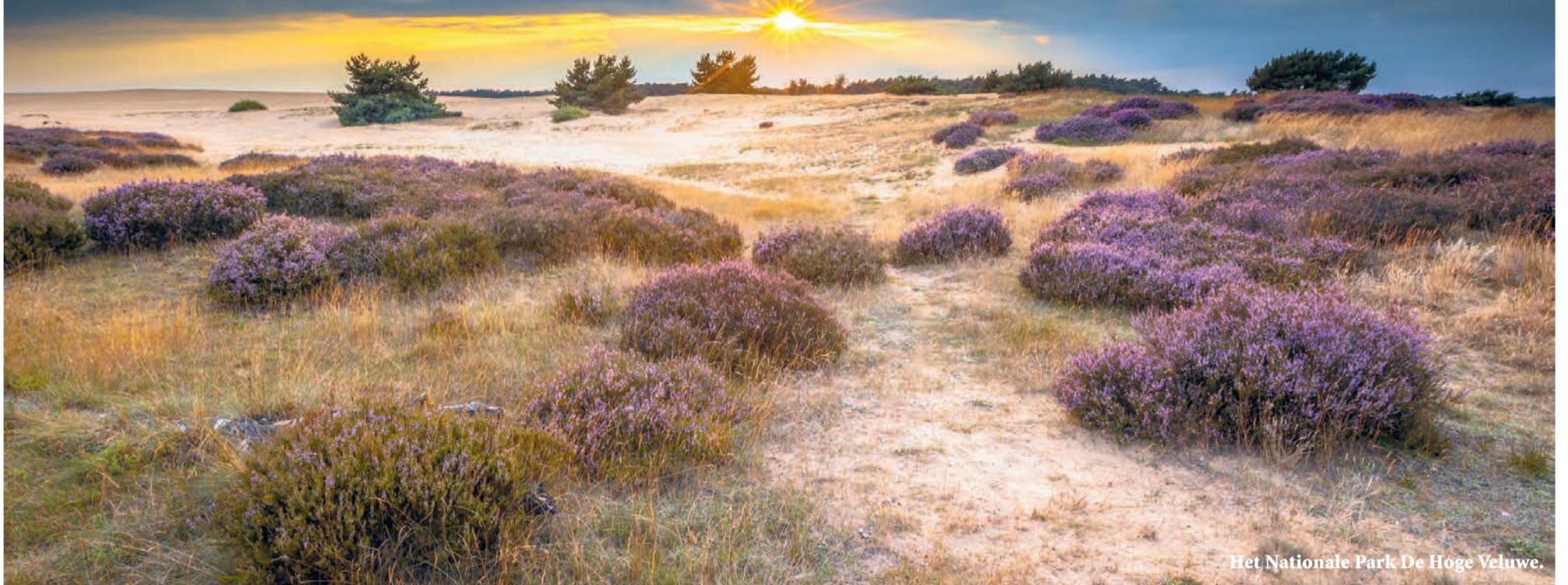
Het Nationale Park De Hoge Veluwe.

Maar hoogleraar natuurlijk kapitaal bespeurt bereidheid tot verandering