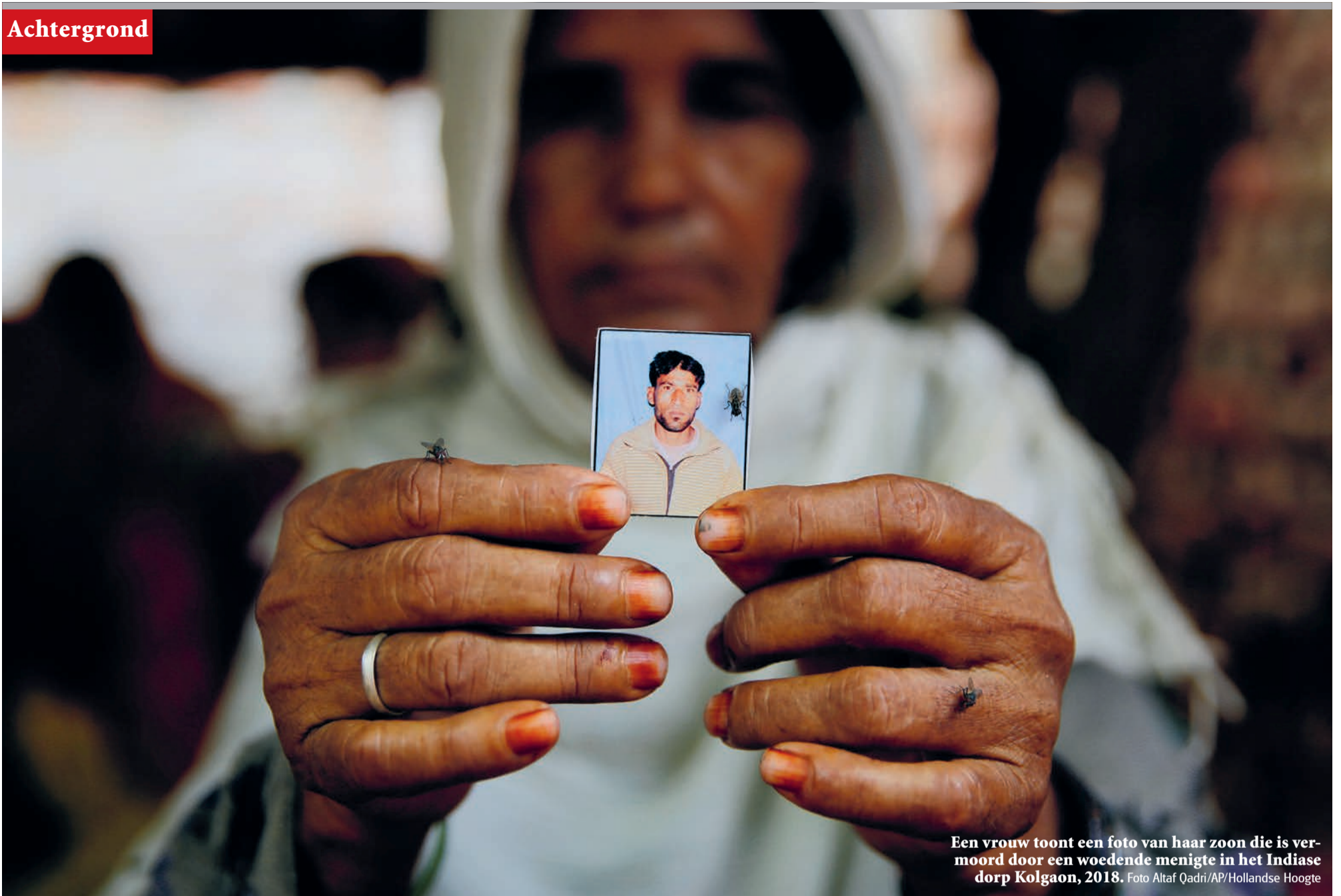
Een vrouw toont een foto van haar zoon die is vermoord door een woedende menigte in het Indiase dorp Kolgaon, 2018.