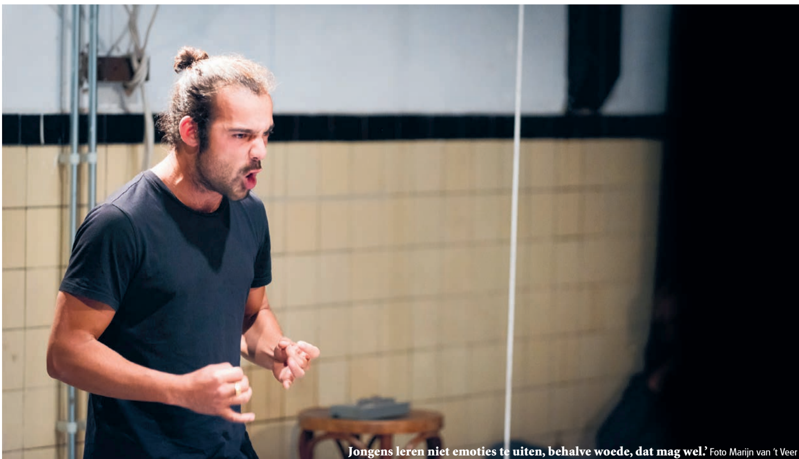
Jongens leren niet emoties te uiten, behalve woede, dat mag wel.'

Waarom Mannen Slaan Theater de Generator 21 februari, 20.00, €10