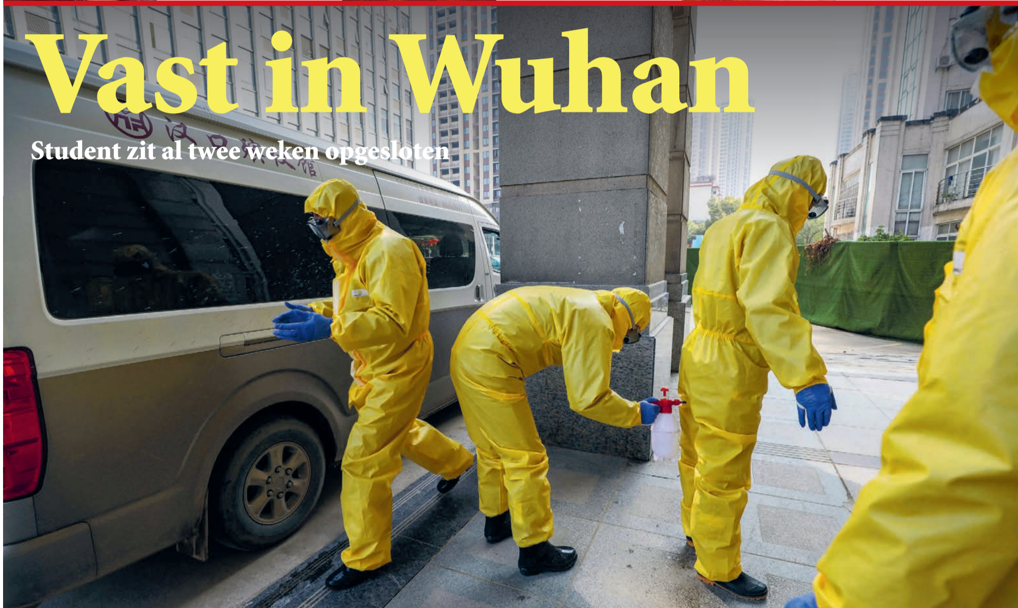
Wuhan, lijkbezorgers desinfecteren zichzelf nadat ze een slachtoffer van het coronavirus hebben afgevoerd.