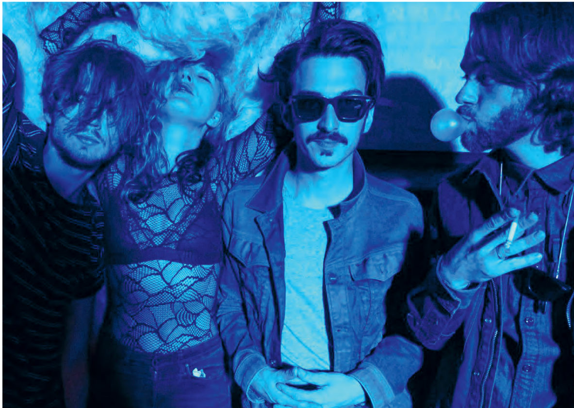
'We hebben een behoorlijk afwijkend geluid. Ik geloof niet dat er in Nederland bands zijn die klinken zoals wij.'

Indian Askin, Sea of Ethanol Paard van Troje, za 12 november, €10 Gebr. De Nobel, vrij 9 december, € 8