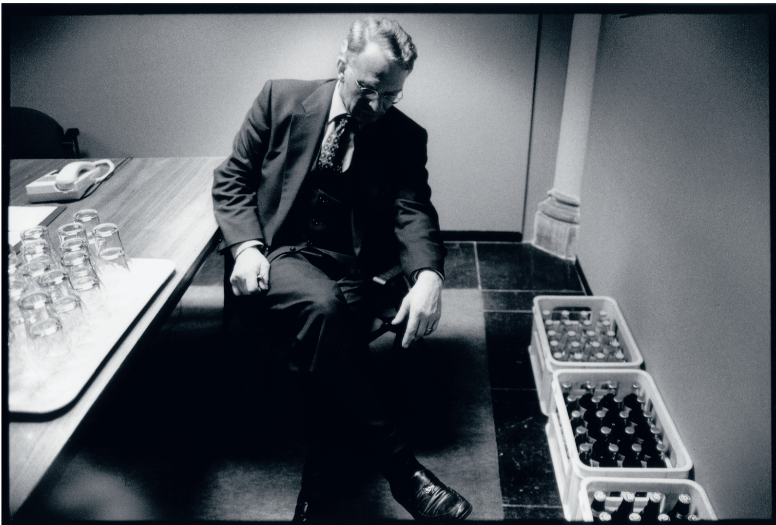
Verkiezingen 1998: Hans Janmaat heeft net gehoord dat de Centrumdemocraten niet terugkeren in de Tweede Kamer.