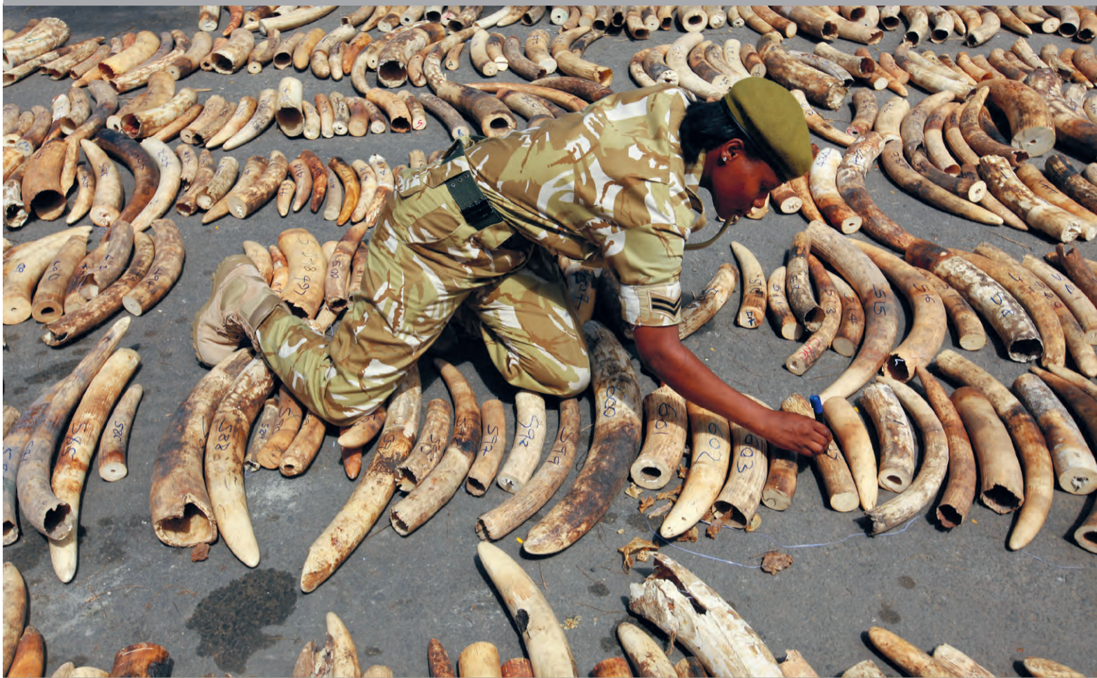
Een wildlife ranger in Kenia markeert onderschepte slachttanden van olifanten, die door stropers zijn buitgemaakt.