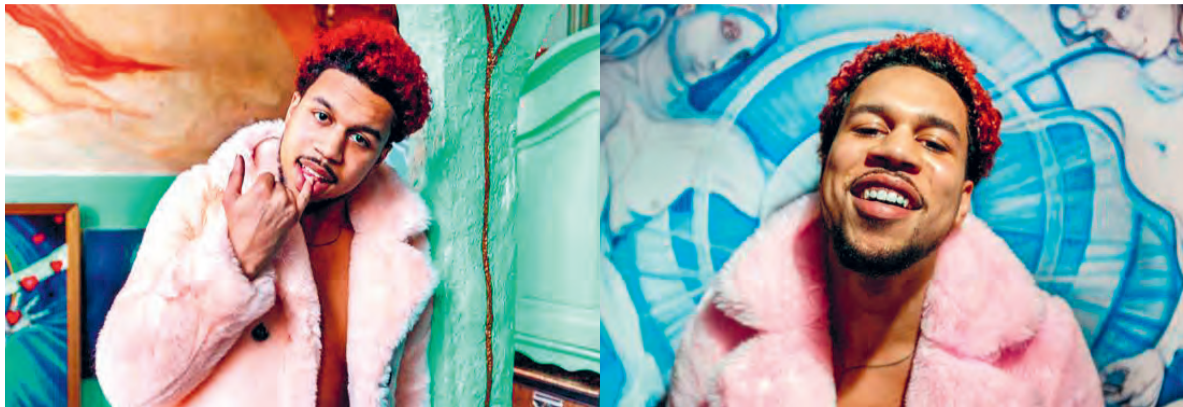
Rapper Bokoeram: 'Alles klopt als een djembé, onze liefde is caliente.'

Twee weken geleden, aan de vooravond van zijn nieuwe tour, werd de clip van gelanceerd. Een grauw filmpje, grotendeels gesitueerd in een ga-