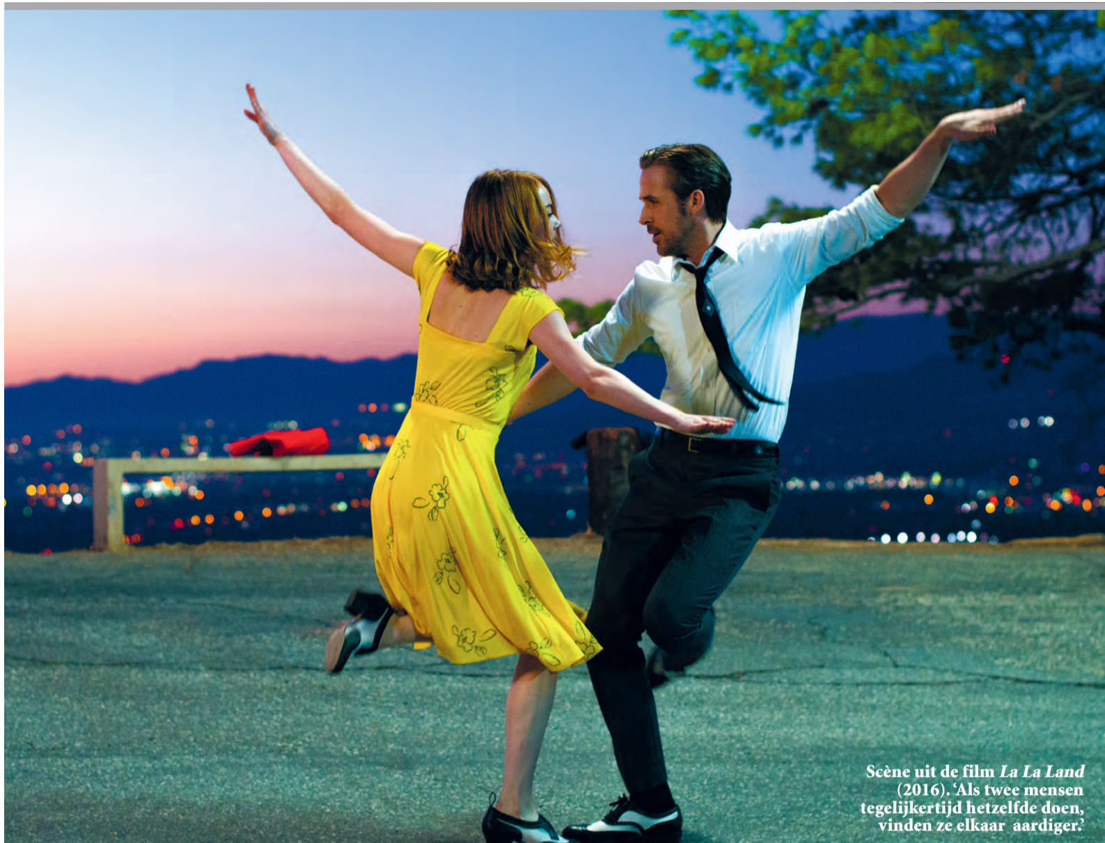
Scène uit de film La La Land (2016). 'Als twee mensen tegelijkertijd hetzelfde doen, vinden ze elkaar aardiger.'

Het werkt ook in mensen, lijkt het: de onderzoekers zetten wat proefpersonen in de kou, en bij een gedeelte ging de HDL-cholesterol beter werken. Bij welk gedeelte? De dunne mensen, bij vetzuchtige proefpersonen werkt het niet. Toch hopen de onderzoekers dat het stimuleren van bruin vet mensen kan beschermen tegen hart- en vaatziekten.