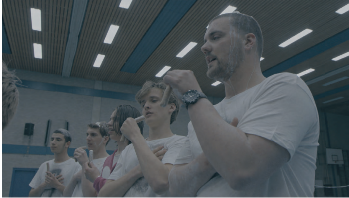
'Er ontstond een soort verbroedering. Dat had ik niet zien aankomen.' Still uit film van Guus Voorham

De geheimzinnigheid die om ontgroeningen hangt, maakt het tot een veelbesproken onderwerp. Om een goed ontgroeningsdraaiboek te schrijven, heeft Voorham een stuk of tien interviews gehouden met leden van verschillende studentenverenigingen. 'Zij hebben mij, tegen