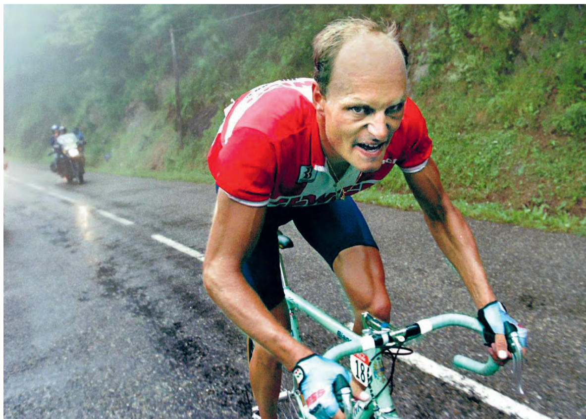
De Deense wielrenner Bjarne Riis won in 1996 de Tour de France met een flinke lading epo in zijn lijf.

In het profpeloton werd het toedienen van epo razend populair. Het middel kwam op de dopinglijst te staan en kreeg haast magische kwaliteiten toegedicht. Knechten die normaal gesproken al snel losten, vlogen ineens de cols op. Althans, dat was het verhaal. 'Er zijn allerlei anekdotes over de werking van epo, maar het ontbrak aan goed wetenschappelijk onderzoek. Daar wilden wij verandering in brengen.'