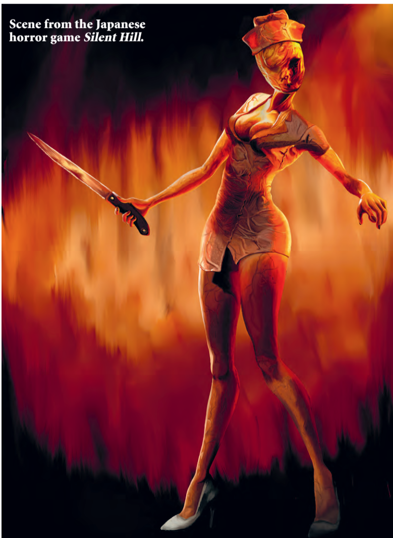
Scene from the Japanese horror game Silent Hill .

According to Slingerland, Robben Island, where Nelson Mandela was imprisoned, represents the situation of CADASIL patients. "They lock themselves in their heads by thinking only of the impossibilities and waiting around for a solution. What they should be doing is seeing how they can progress in the meantime."