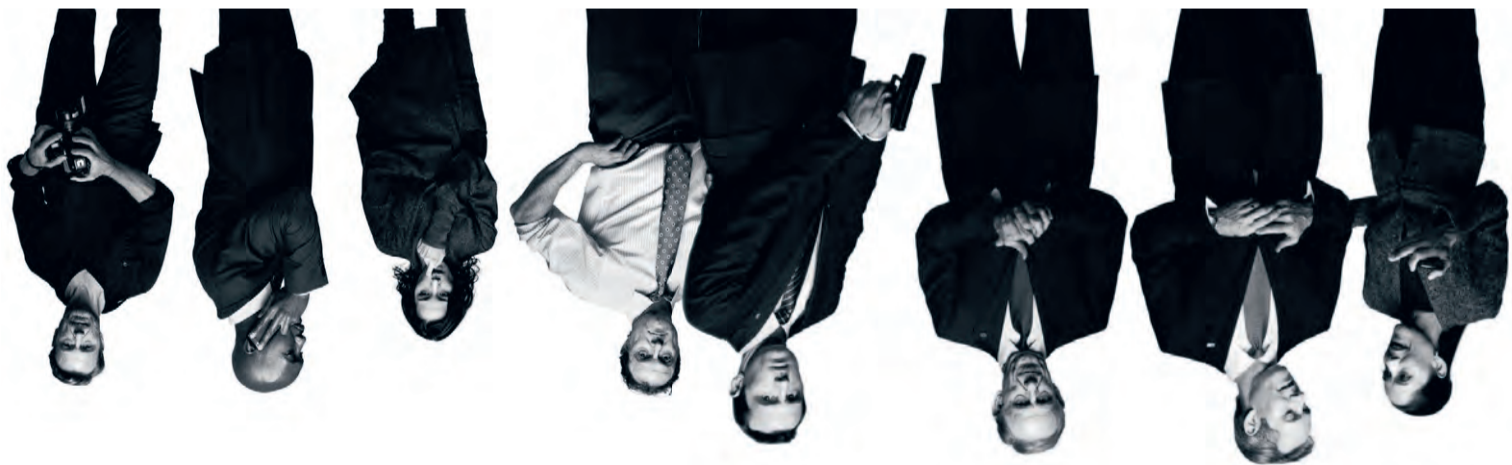
Personages uit de serie House of Cards .

Welke lessen leerden politici in de universitaire medezeggenschap?