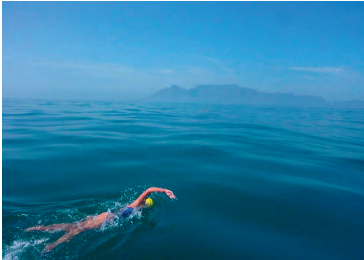
"I like it when there are seals swimming along. It means there aren't any sharks around."

Then someone mentioned CADASIL, a hereditary brain-vasculature disorder: patients suffer strokes and dementia from an early age because