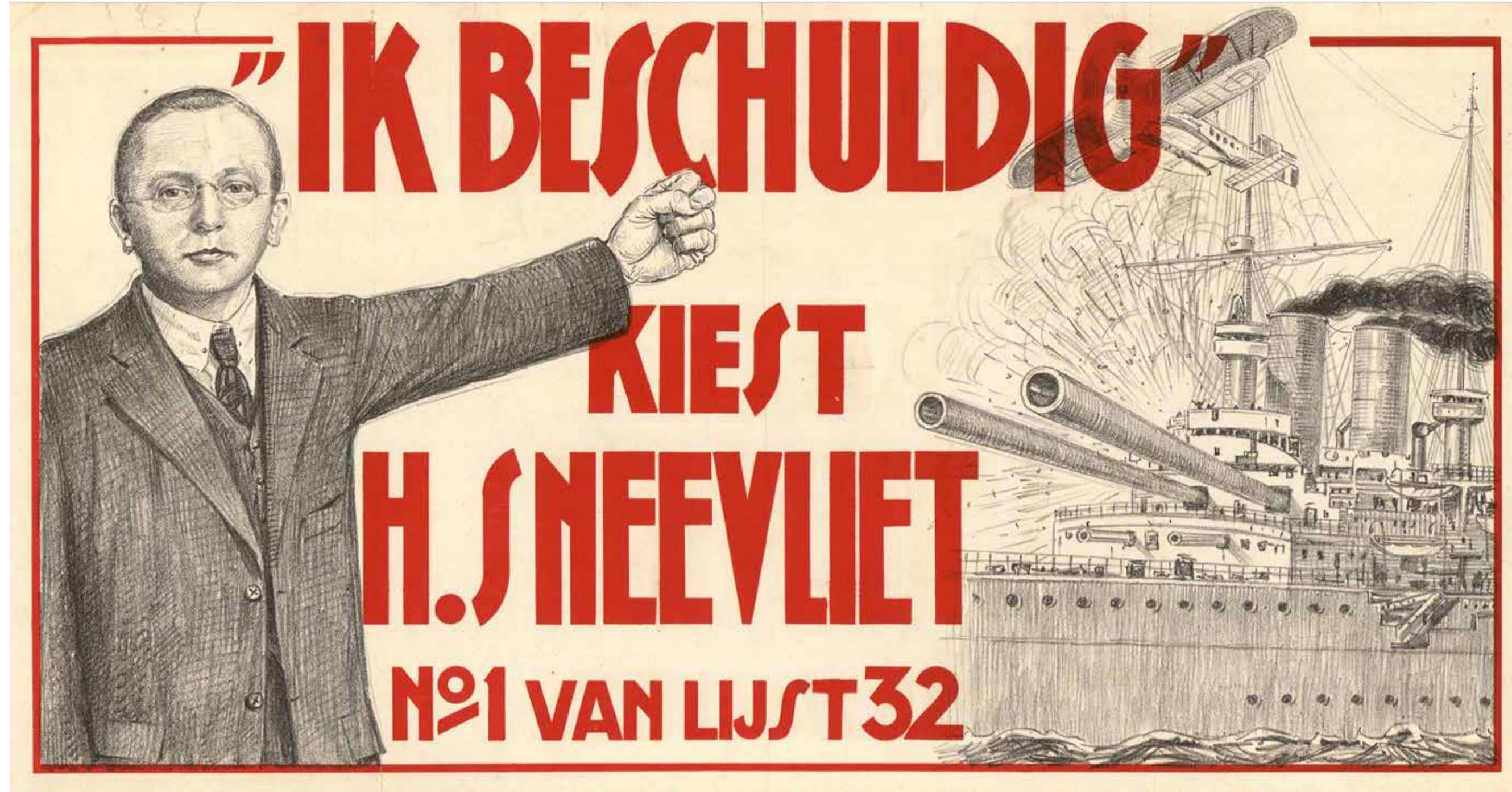
Affiche van de RSP met daarop een verwijzing naar het bombardement op het oorlogsschip De Zeven Provinciën