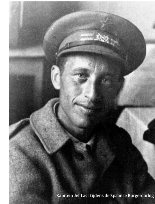
Kapitein Jef Last tijdens de Spaanse Burgeroorlog