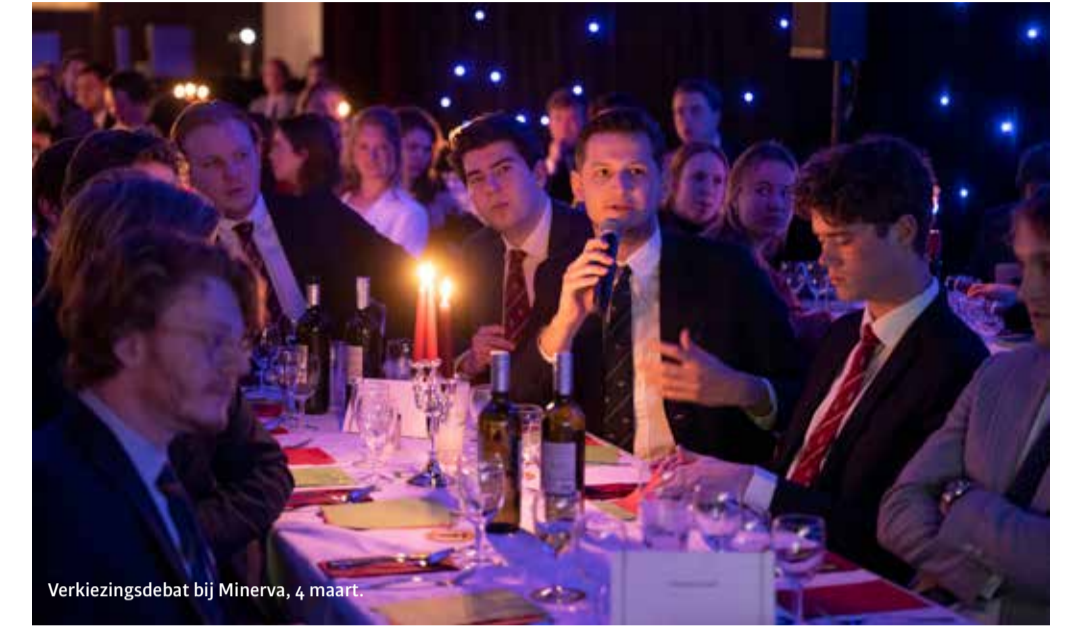
Verkiezingsdebat bij Minerva, 4 maart.

'We kunnen nu geen Oekraïense studenten aannemen omdat de universiteit het collegegeld niet wil schrappen'