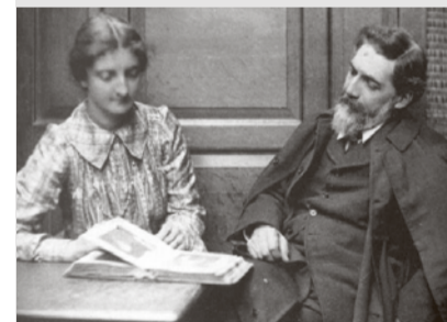
Hilda en William Flinders Petrie.

moment een melding dat iemand anders wat heeft veranderd aan je artikel. Eerst denk je: "Wat? Is er aan mijn artikel gerommeld?" Maar dan blijkt diegene een categorie te hebben toegevoegd, en dat is toch wel handig. De volgende keer voeg je zelf de categorie toe.'