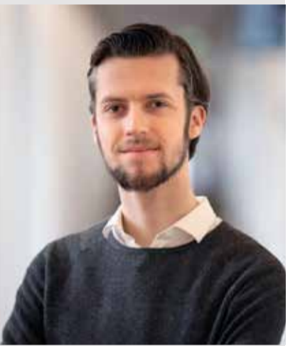
Promovendus politieke filosofie en internationaal recht