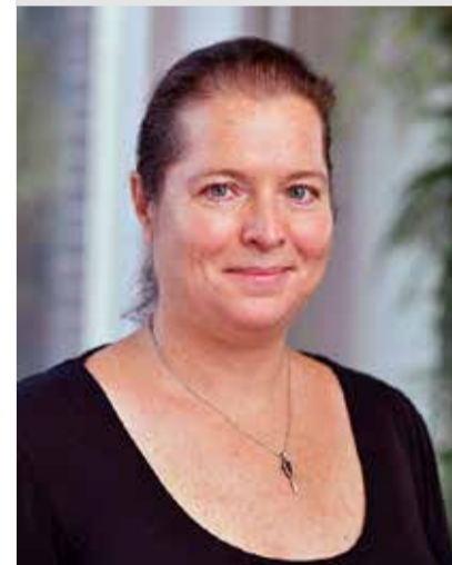
Secretaris/redacteur Nederlands Instituut voor het Nabije Oosten (NINO)