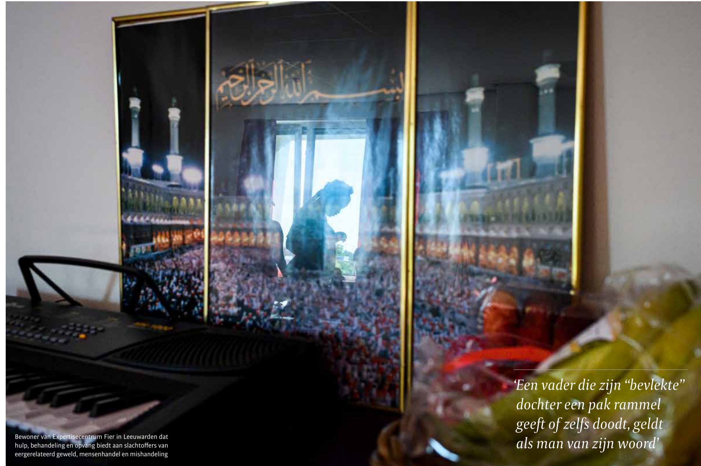
Bewoner van Expertisecentrum Fier in Leeuwarden dat hulp, behandeling en opvang biedt aan slachtoffers van eergelateerd geweld, mensenhandel en mishandeling

'Een vader die zijn "bevleete" dochter een pak rammel geeft of zelfs doodt, geldt als man van zijn woord'