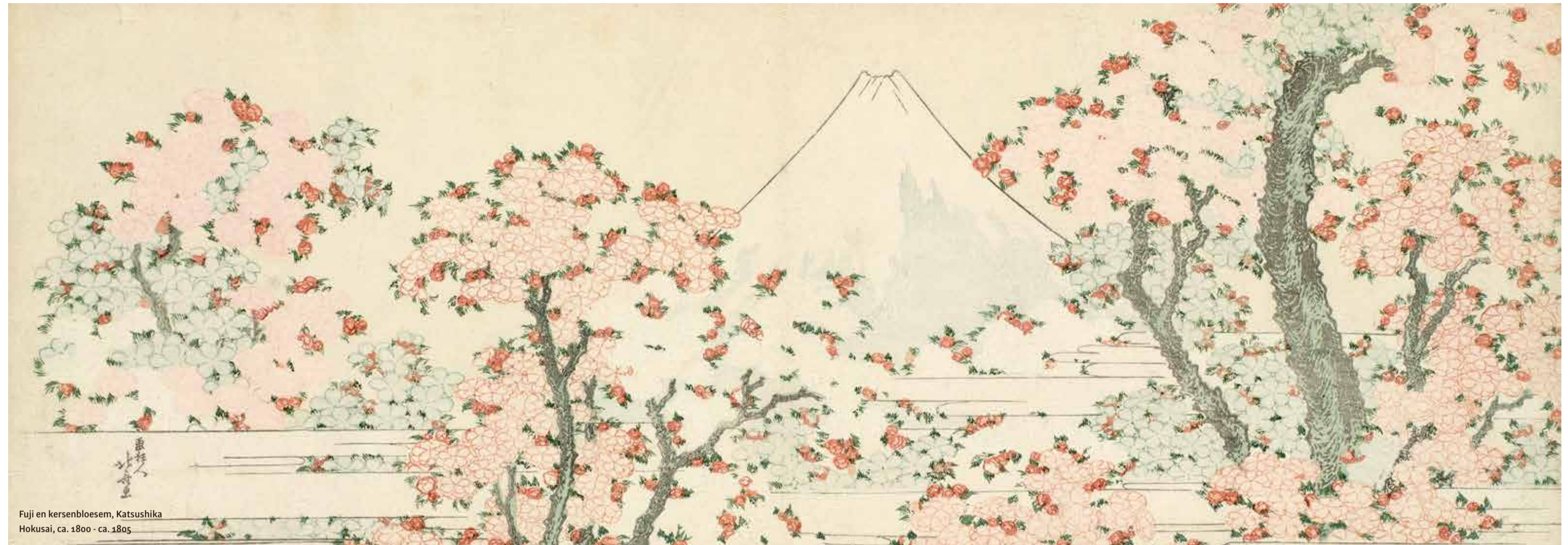
Fuji en kersenbloesem, Katsushika Hokusai, ca. 1800 - ca. 1805