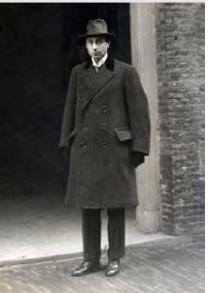
Eduard Meijers in 1917