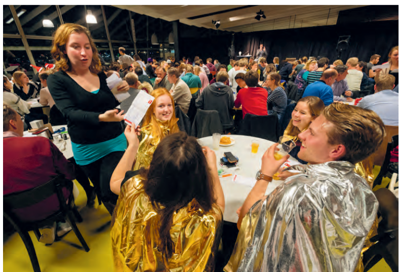
'Ik verlies dit altijd van mijn aio's of studenten.'

Team Dino, met daarin Van Wezels PhD-studenten, wint uiteindelijk de quiz, met 70,5 punten van de 80. De prijs: een universitaire koffiebeker, kerstkransjes en een fles champagne.