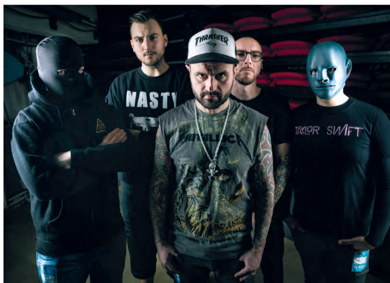
'Sorry, wij zijn geen Chinese Queen-tributeband.'

dy Melculy is wat groter geworden dan ik had verwacht. Dat is het 'm nu juist: er was niks gepland. Ik had een paar nummers geschreven en we moesten nog repeteren om daarmee op te treden.'