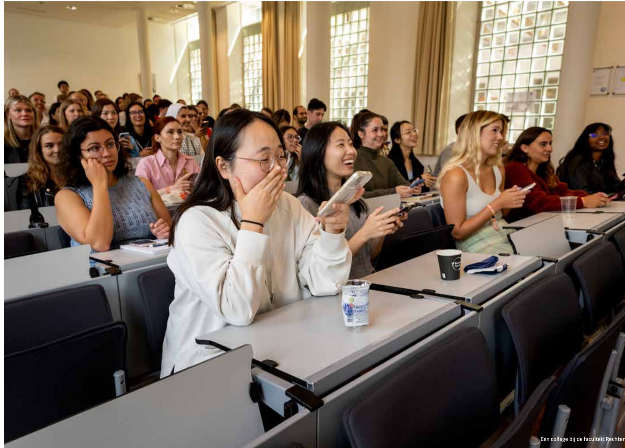
Een college bij de faculteit Rechten

Dat de voorzitter zijn functie heeft neergelegd wilden we in ieder geval zo snel mogelijk aan de leden laten weten. ‘Dat de mail bij de leden veel vragen kan oproepen, onderstreept hij. ‘We snappen heel goed dat de mail gevoelens kan oproepen. Als ze niet goed weten wat ze ermee aan moeten, kunnen ze naar onze vertrouwenspersoon stappen.’ Op de vraag hoe het kan dat zowel het bestuur als de raad van advies niet weten wat de reden is van het vertrek van de voorzitter, zegt hij: ‘Wij zijn geen alwetend orgaan. We zijn er om het bestuur op te vangen en te bekijken hoe ze het nu met zijn zessen moeten rooien.’ De vice-voorzitter neemt voorlopig de taken van de voorzitter over.