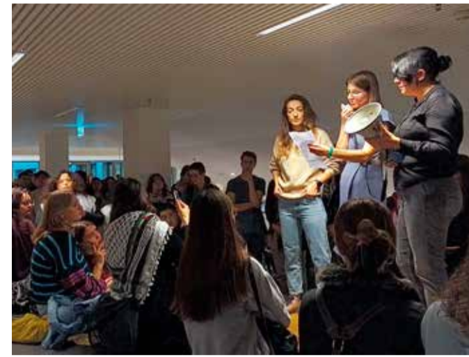
College van bestuur keurt demonstratie af: 'Wij zijn geschokt en treffen maatregelen'

Terwijl de student zich verderop in de winkel verschuilt, besluit Naeff nogmaals de achtervolgers aan te spreken: 'Wat gaan jullie dan doen als de student straks naar buiten wil? We voelen ons echt bijzonder onveilig.' De beveiligers horen haar aan, maar laten niets los over hun beweegredenen. In totaal blijven de twee achtervolgers ongeveer een kwartier voor de in-