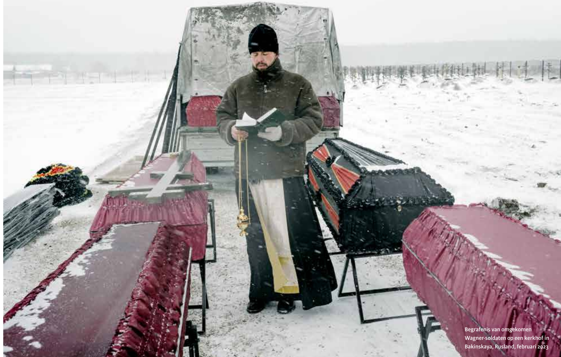
Begraving van omgekomen Wagnersoldaten op een kerkhof in Bakinskaya, Rusland, februari 2023