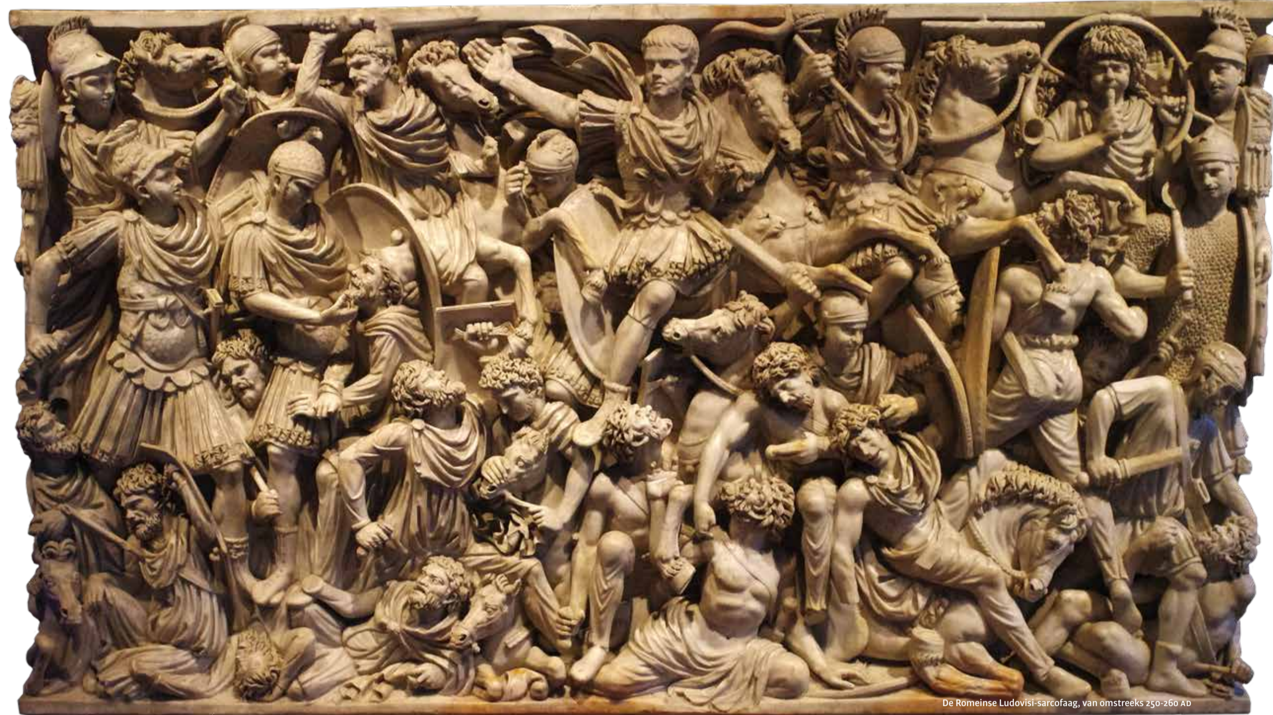
De Romeinse Ludovisi-sarcofaag, van omstreeks 250-260 AD