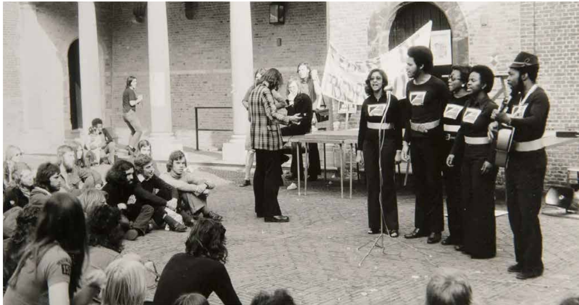
Openluichtoptreden door Surinaamse studenten in Dordrecht.