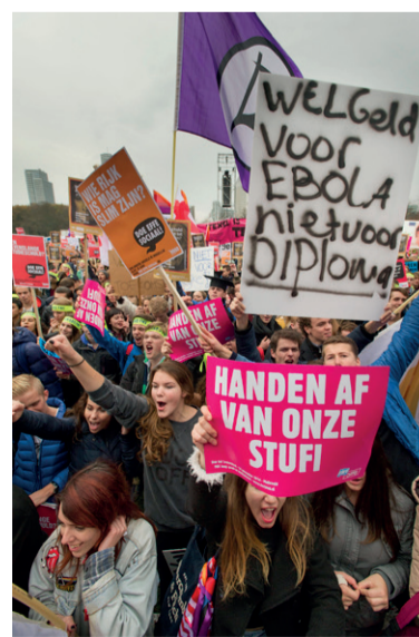
Studentenprotest tegen het leenstelsel op het Malieveld in Den Haag, 2014.

Ze voegde daar aan toe dat 'er groepen zijn die een grotere aversie hebben tegen het lenen, bijvoorbeeld ook de "eerstegeneratiestudenten", maar dat heeft geen invloed op hun beslissing om toch te gaan studeren.' VB