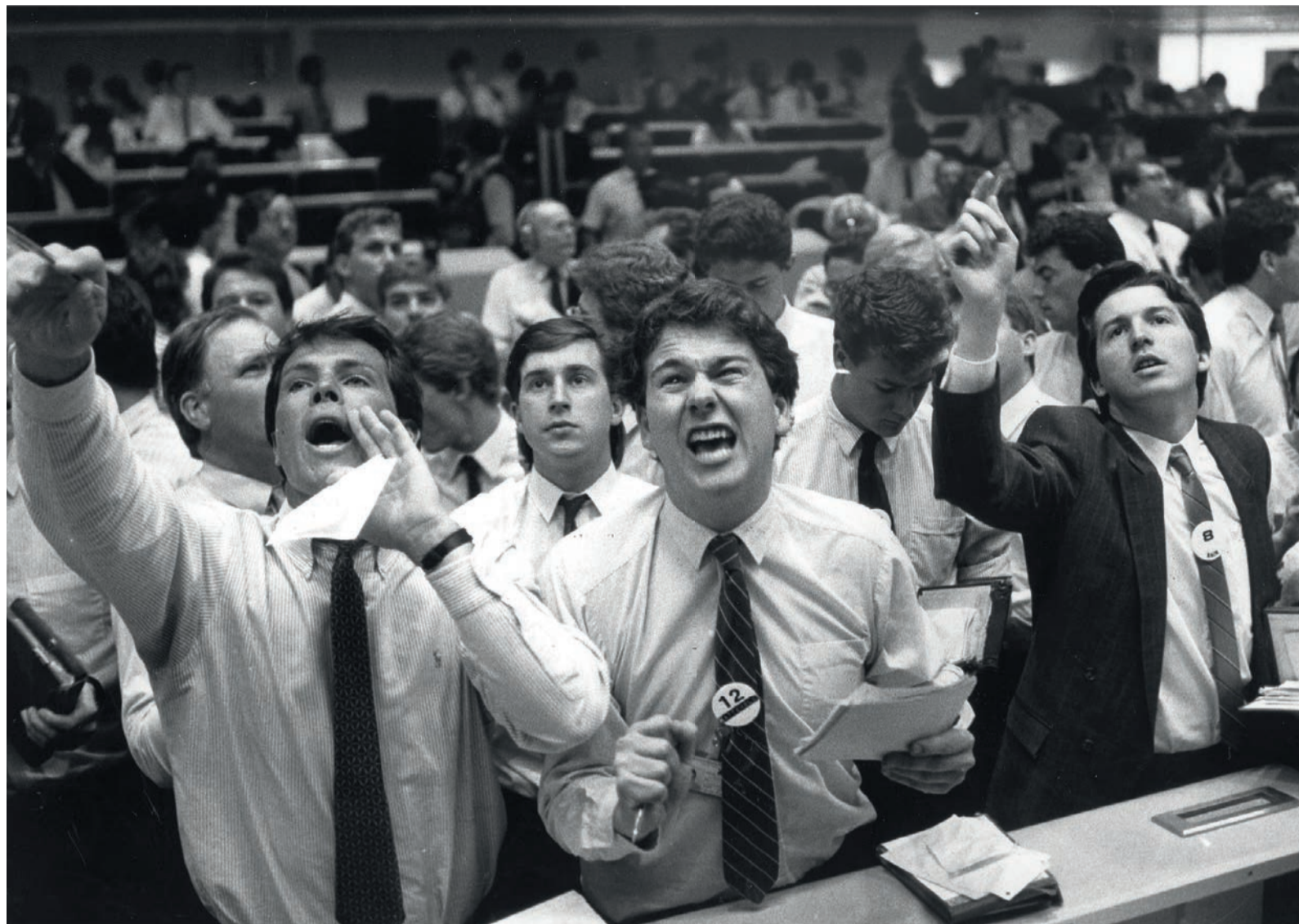
Beurshandelaren in actie, in de jaren tachtig van de vorige eeuw. Tegenwoordig verhandelen bedrijven in tienden van een seconde informatie over internetgebruikers. 'Bieders kunnen vervolgens aanbiedingen doen: dat zijn die reclames die steeds weer over jouw scherm flitsen.'

Hoe de achterkant van het internet ons in de gaten houdt