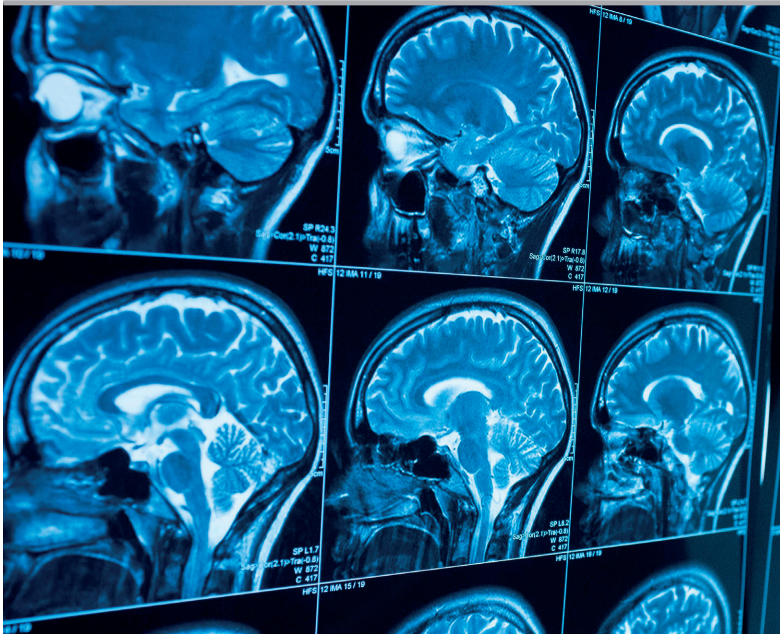
Doordat hun hersencellen sterven, verliezen van Huntington-patiënten zowel geestelijke vermogens als controle over de spieren.