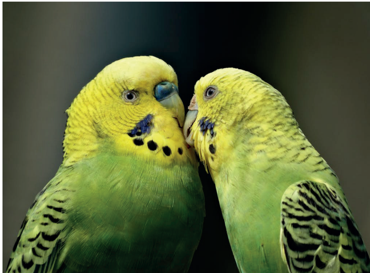
Yeah, he's cute. But does he understand that you cannot open a box if you're sitting on the lid?