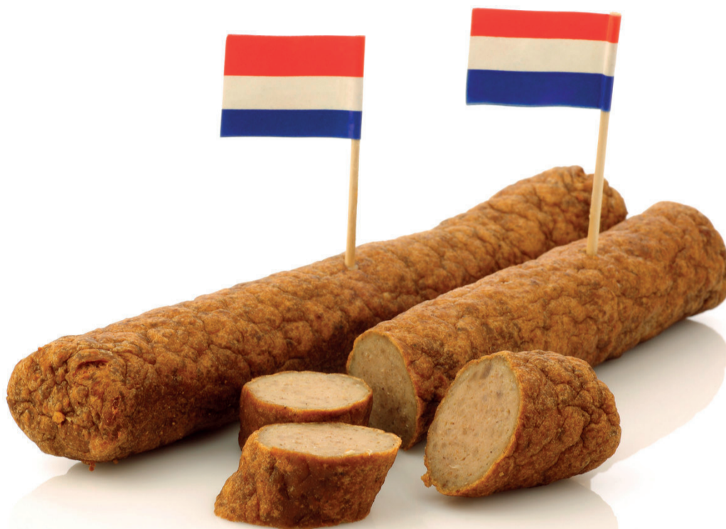
De zogeheten 'minced meat hot dog'.