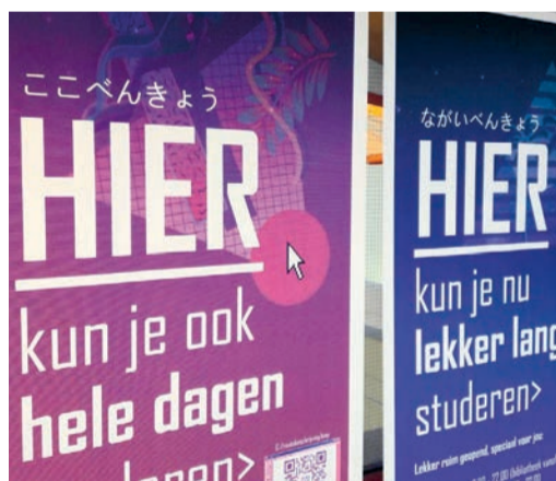
De gewraakte Japanse teksten, die in de Leidse UB (rechts) zijn afgeplakt.

maticaal correct Japans op de poster te zetten, dan hadden we een taaldocent benaderd voor een second opinion . Dat is ons beleid: vertalingen overlaten aan professionals. In dit geval hebben we dat niet gedaan. Het doel was namelijk niet om de boodschap te communiceren in het Japans. Grafische vormgeving en stijlkeuze ondermijnden grammaticale juistheid.