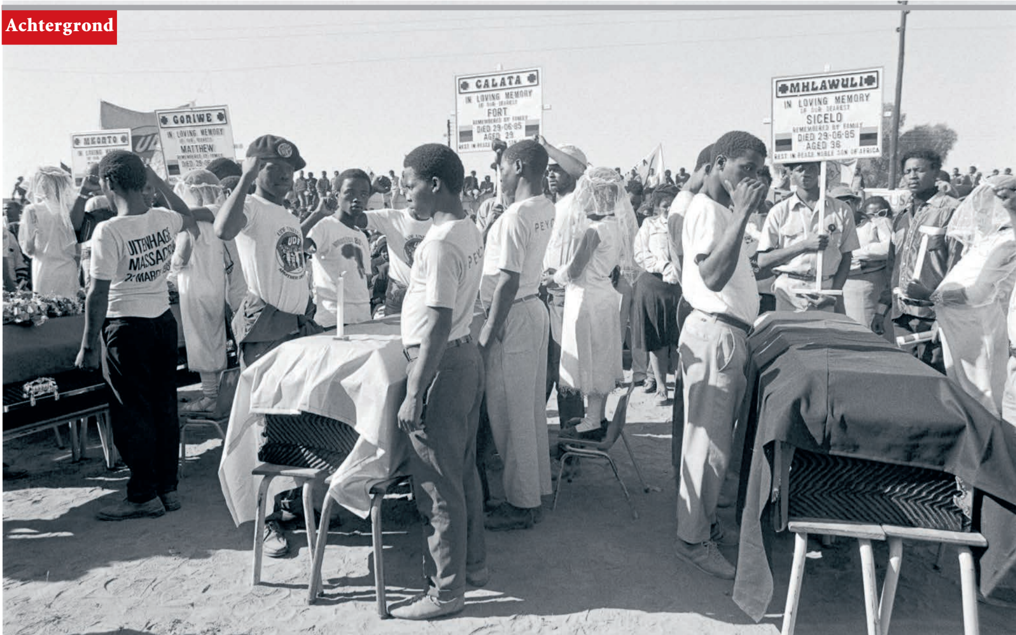
Begravenis van de door het Zuid-Afrikaanse regime vermoorde anti-apartheidsstrijders The Cradock Four , juni 1985.