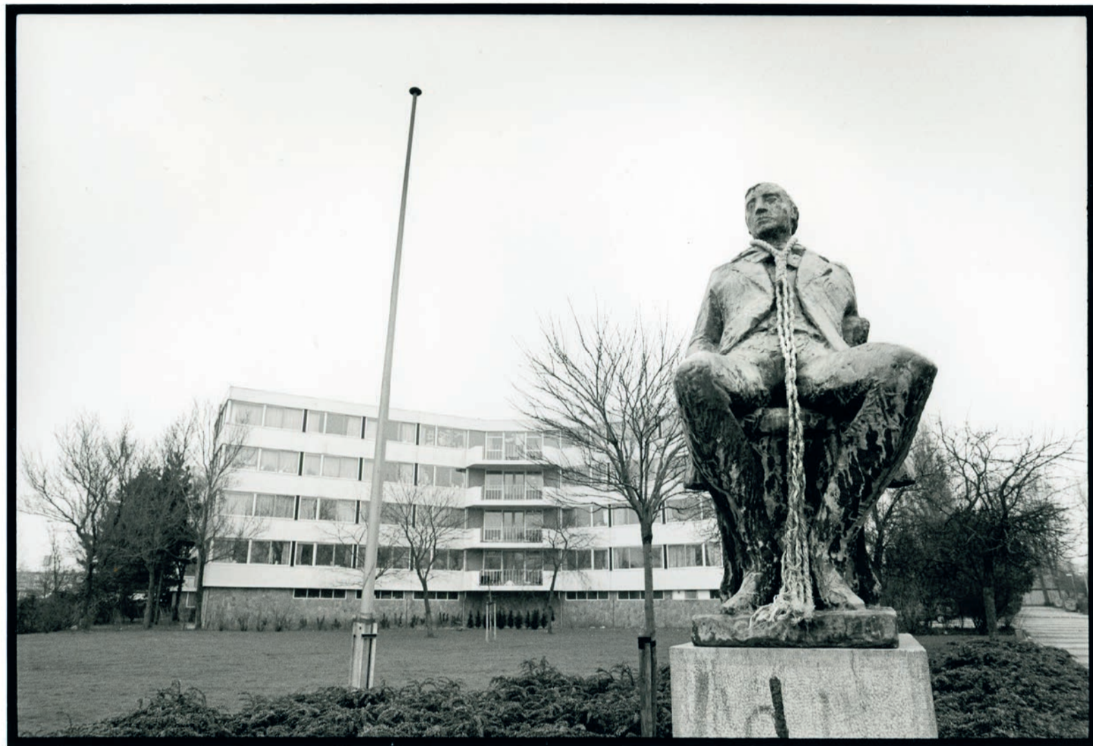
De Klikspanweg in 1993.

Hetzelfde geldt voor de brandveiligheidscontroles. Er wordt streng gecontroleerd op losse spullen in gangen, maar tegelijkertijd wordt de nooduitgang van de flat van Stad-