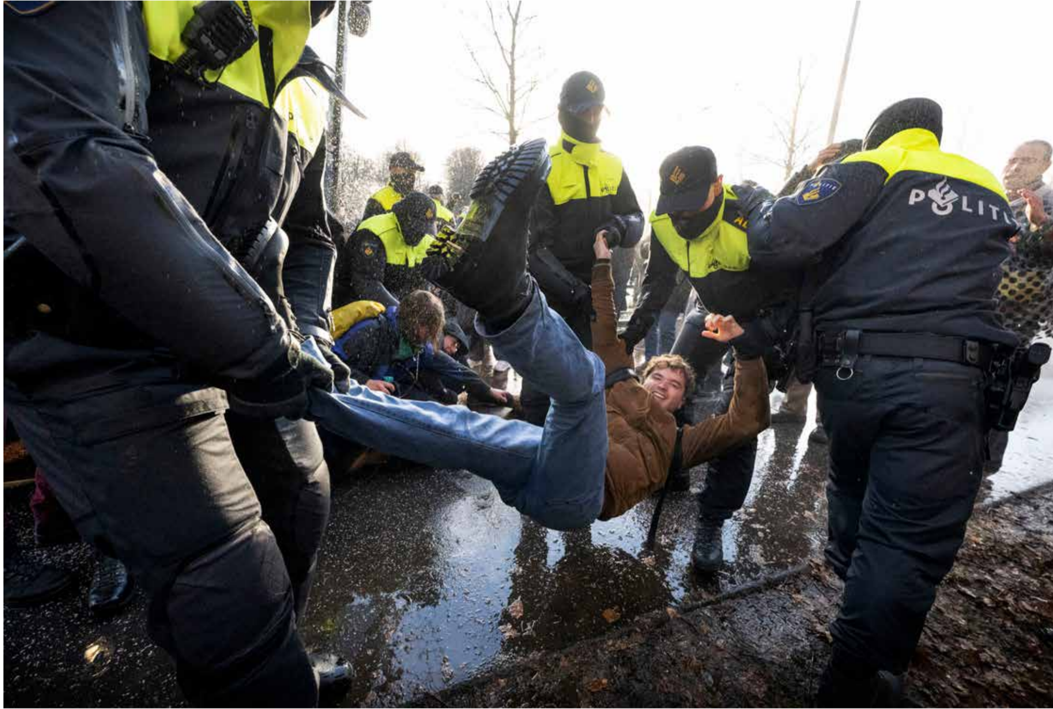
Een demonstrant wordt weggedragen door de politie tijdens de blokkade van de A52 in maart van dit jaar