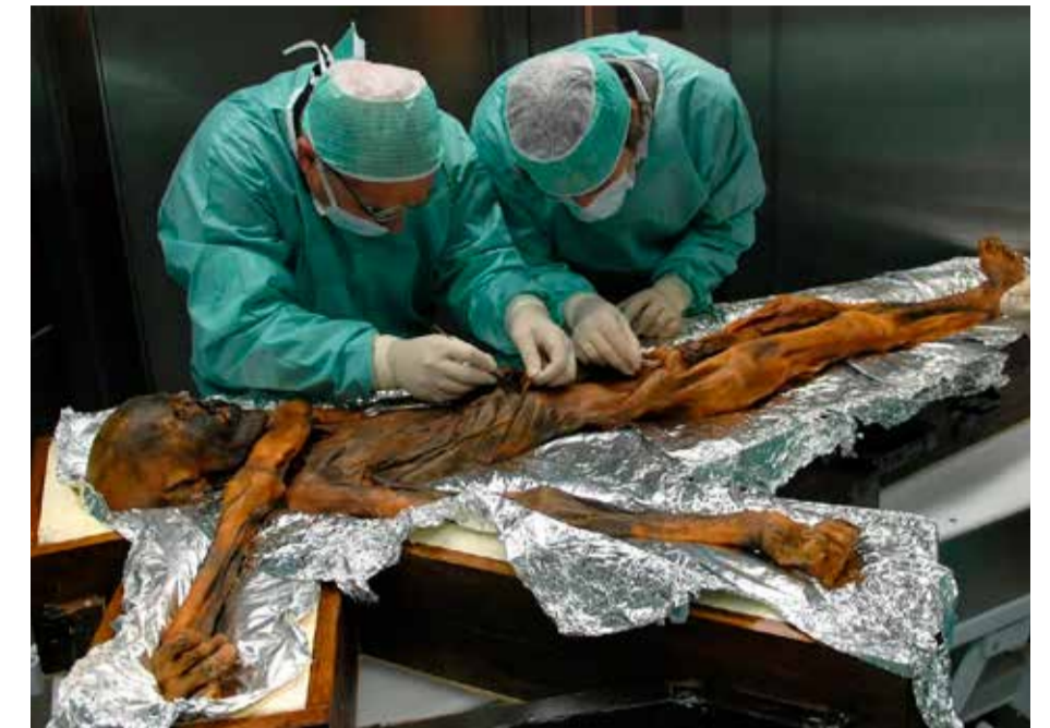
Onderzoek naar ijsmummie Ötzi.

Days of Art and Science , 11-17 september, verschillende locaties en toegangsprijzen