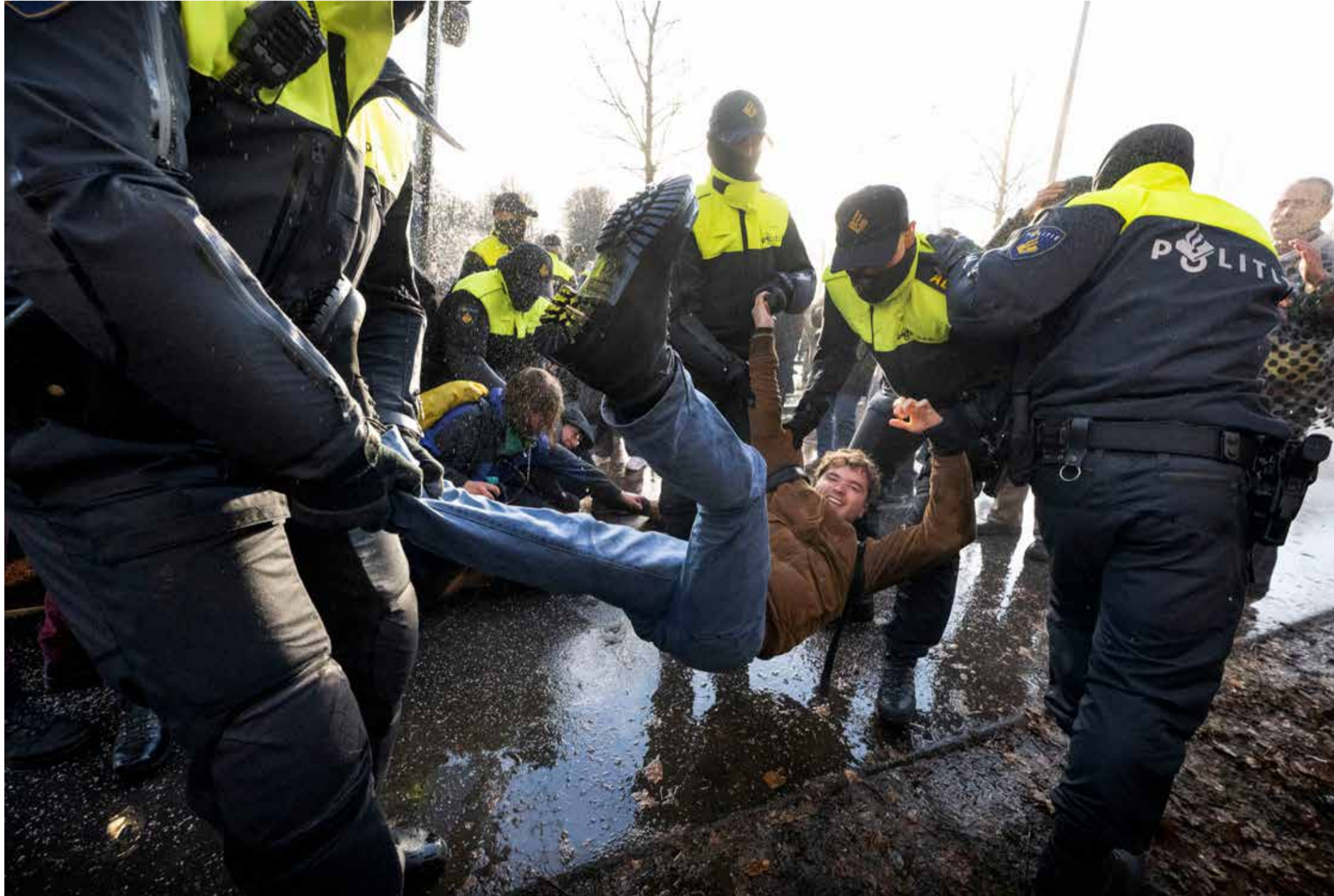
Een demonstrant wordt weggedragen door de politie tijdens de blokkade van de A52 in maart van dit jaar