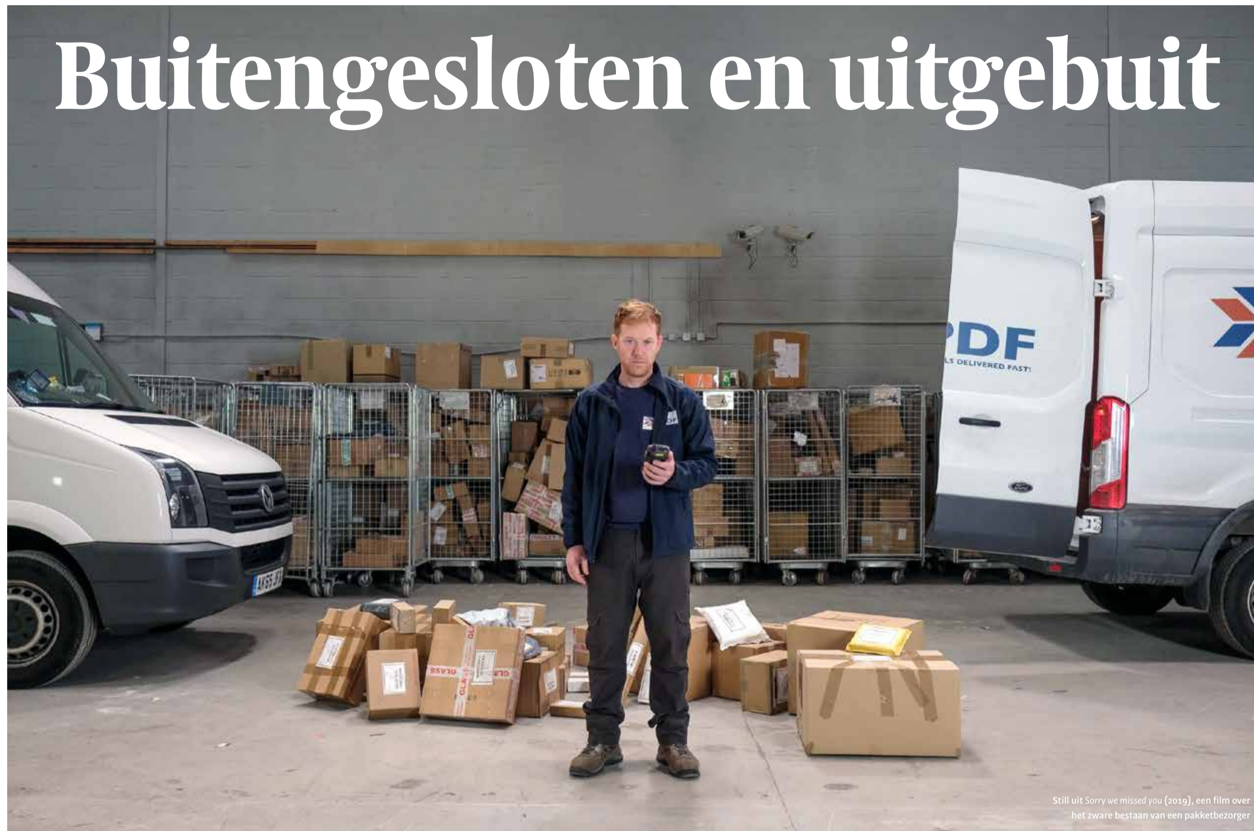
Stil uit Sorry we missed you (2019), een film over het zware bestaan van een pakketbezorger

Ook zullen de all-gendertoiletten worden voorzien van zogenoemde hygiënebakjes, voor bijvoorbeeld het deponeren van maandverband.