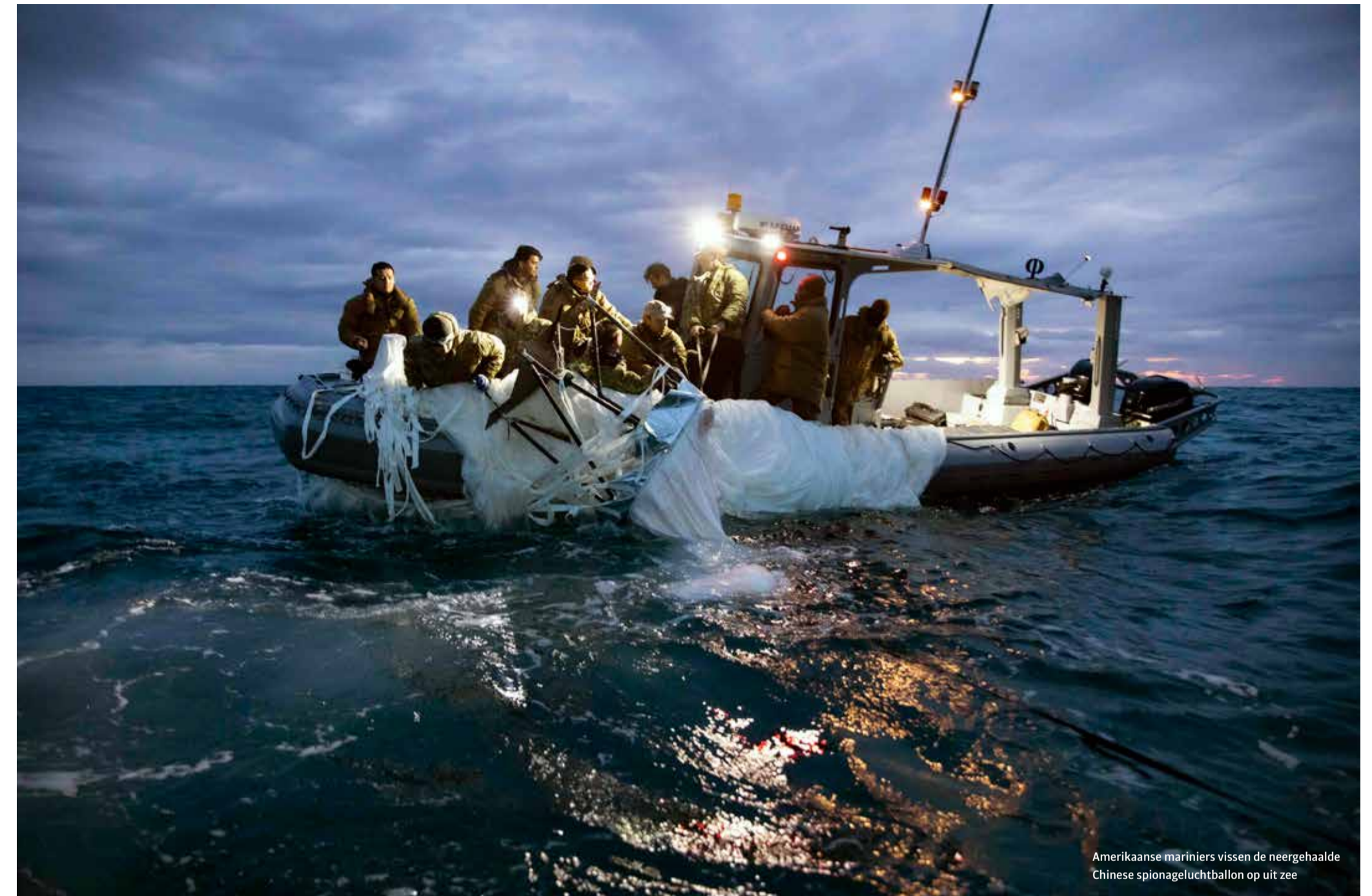
Amerikaanse mariniers vissen de neergehaalde Chinese spionageluchtballoon op uit zee

doet de Amerikaanse overheid dan? Ik zie veel potentiële problemen.' Er is duidelijk een machtsstrijd gaande. 'Pas de afgelopen jaren is er in de vs het besef gekomen dat er echt beleid moet worden gevoerd om China in toom te houden.' De nadruk ligt nu op China afschrikken, vertelt Mazarr. 'Er gebeurt een hoop op militair gebied. De overheid pompt miljarden in het zogeheten Pacific Deterrence Initiative . Bases in de regio worden versterkt en er wordt in specifieke wapens geïnvesteerd. Maar hoe lang ga je zo'n wapenwedloop volhouden?' Ook aan de technologische kant nemen de vs allerlei maatregelen, onder meer met restricties op het uitvoeren van chiptechnologie naar China. Chinese bedrijven krijgen hierdoor minder toegang tot chips voor kunstmatige-intelligentieprojecten. Mazarrs kritiek is dat de regering geen duidelijk beeld heeft van hoe Amerika zich op termijn wil verhouden tot China. 'Wat vinden we een acceptabele balans? Nu smijten we met maatregelen zonder een duidelijk einddoel. Is het bijvoorbeeld oké als China even sterk is in de wereld als de vs, en even machtig? Kunnen we daar mee leven, of niet? Die vragen moeten we beantwoorden. We hebben heel veel haast, maar geen plan.' Het gaat bijvoorbeeld nooit lukken om de technologische ontwikkeling van China significant te beperken, stelt Mazarr. 'Als over twintig jaar China wereldleider is op het gebied van technologie maar geen bedreiging